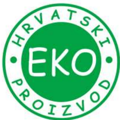
Slika 21. Ekološki proizvod Hrvatske

Zakonom o ekološkoj poljoprivredi te pratećim podzakonskim propisima određeno je što je to ekološka proizvodnja, te tko je nadležan za nadzor i izdavanje certifikata (ekooznaka). Pravilnikom o biljnoj proizvodnji točno su navedene sve mjere, tehnološki postupci i sredstva koja su poželjna i preporučena u procesu uzgoja grožđa i proizvodnje vina u sustavu ekološkog vinogradarstva, te oni koji su zabranjeni, odnosno nespojivi s ovom proizvodnjom. Zakonski je također određeno i vrijeme prelaska, odnosno preusmjeravanja na ekološku proizvodnju. Potrebno je da prođe odgovarajuće vrijeme između početka primjene propisane tehnologije proizvodnje da bi se ona uskladila s temeljnim načelima ekološkog uzgoja, tada se proizvodi mogu deklarirati kao ekološki i nositi odgovarajući znak. Pošto se u vinogradarskoj proizvodnji radi o uzgoju višegodišnje kulture, ovo razdoblje traje od tri do pet godina. Za ekološki uzgoj mogu se odabrati samo površine bez industrijskog oštećenja ili onečišćenja, odnosno ukoliko količina štetnih spojeva (metali, mineralna ulja, policiklički aromatski ugljikovodici) ne prelazi utvrđene granične vrijednosti koje se utvrđuju kemijskom analizom tla u ovlaštenom laboratoriju. Za ekološki uzgoj vinove loze nisu prikladne ni površine u blizini velikih prometnica, odnosno ekološki vinogradi moraju biti udaljeni najmanje 50 m od prometnica na kojima je gustoća prometa 100 vozila na sat ili 20 m ako su odvojeni ogradom visine 1,5 m.