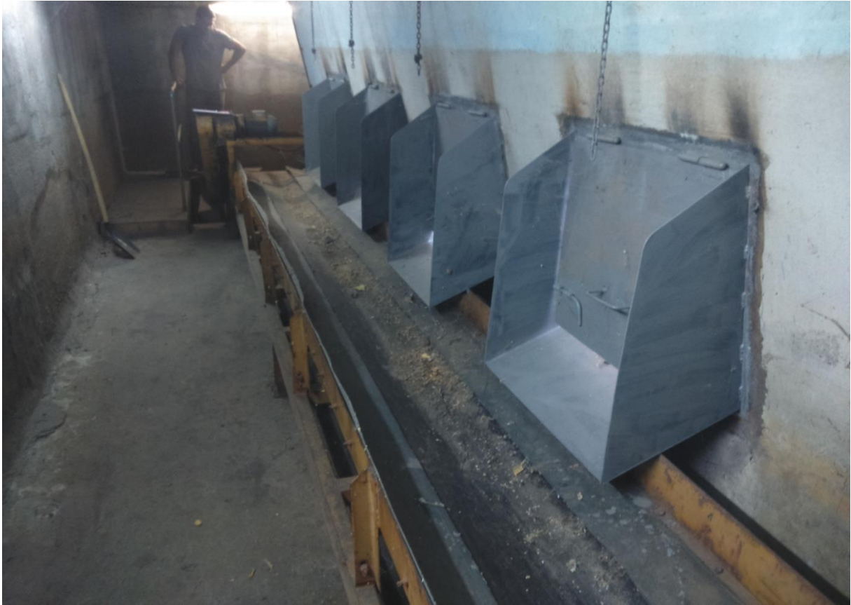
Slika 2. Prebiri stol