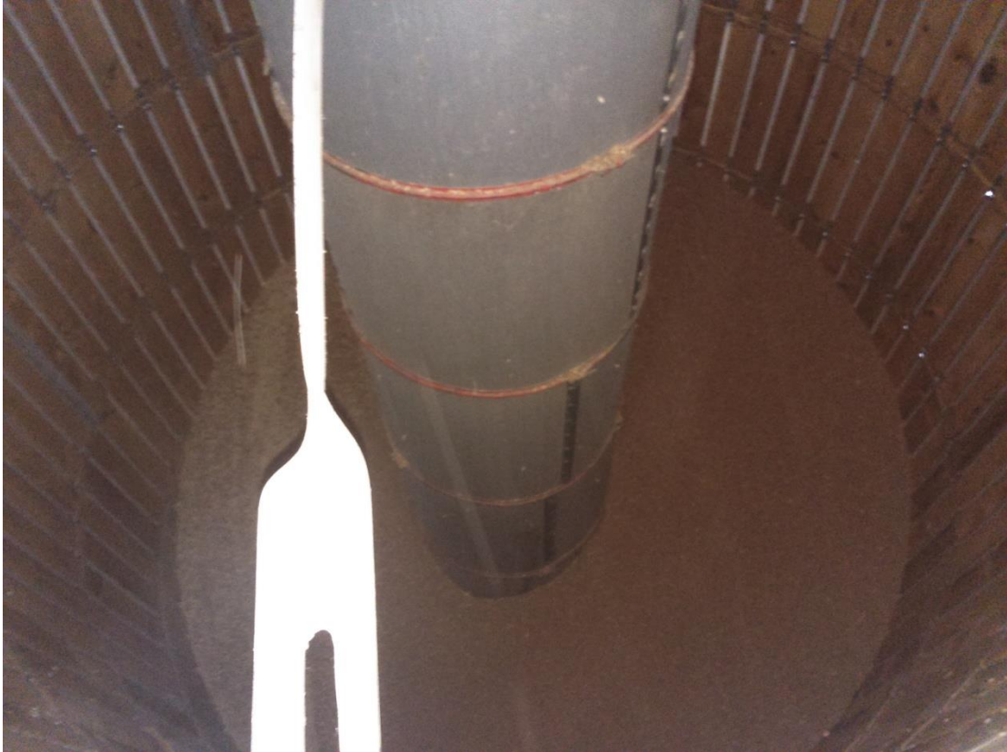
Slika 12. Središnja sitasta cijev

Središnja cijev (Slika 12.) je sitasta što omogućuje propuhivanje toplog ili hladnog zraka. U središnjoj cijevi je pomični čep koji služi kao zatvarač za prolaz zraka iznad položaja na kojemu je čep. Ovo je potrebno kada se suši roba koja nije ispunila cijeli prostor do vrha ili kada se tijekom sušenja gornja površina robe počinje spuštati. Potrebno je osigurati isti otpor prolazu zraka u vodoravnom i okomitom smjeru na gore. To se postiže namještanjem čepa na visinu kod koje je širina sloja jednolika visini iznad čepa. Sušara se puni na vrhu trakastim transporterom, a prazni na dnu (Slika 13).