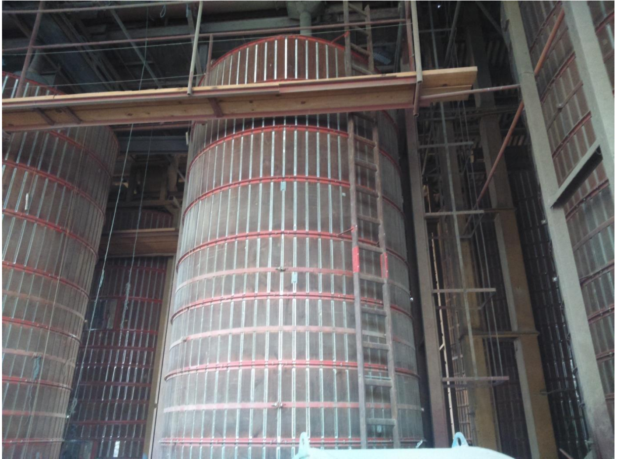
Slika 10. Perforirani valjkasti spremnik sušare