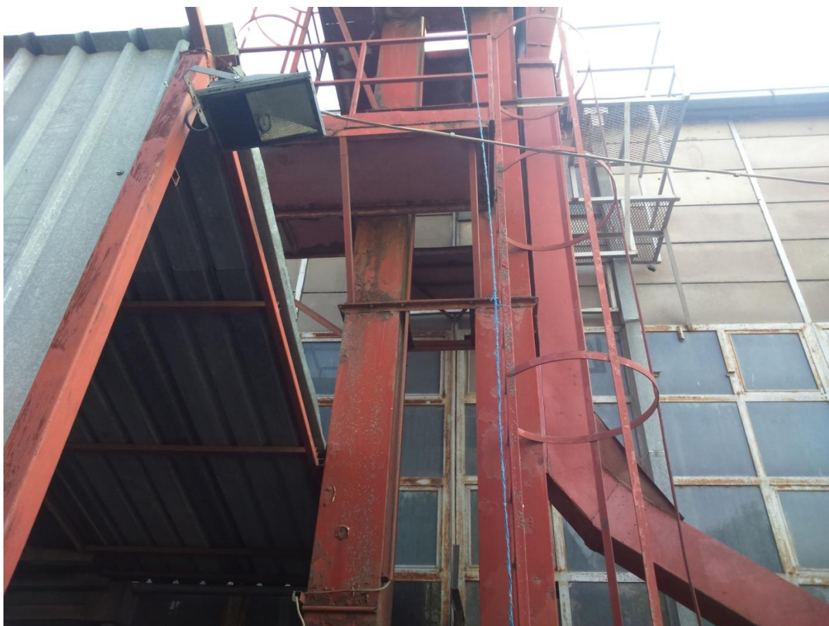
Slika 6. Elevator

Elevatori (Slika 6.) se upotrebljavaju za vertikalni transport sipkih materijala. Najčešće se primjenjuju elevatori čije se žlice prazne centrifugalnom silom. U konstrukciji je vrlo važan odnos između broja okretaja i promjera gornjeg lančanika ili remenice. Kada se masa zrna ili klipa u žlicama pokreće preko gornjeg lančanika, pojavljuju se dvije sile: sila gravitacije, koja djeluje vertikalno prema dolje, i centrifugalna sila, koja djeluje radijalno, od sredine lančanika ili remenice. Rezultanta tih sila uzrokuje pražnjenje materijala iz žlica elevatora. Kapacitet elevatora ovisi o volumenu žlica, njihovoj raspoređenosti na remenu, brzini remena ili lanca i stupnju punjenja žlica. Razmak između žlica određuje se na osnovi njihova oblika i karakteristika pražnjenja. Na brzohodnim elevatorima razmak između žlica može biti manji nego na elevatorima umjerene brzine. U praksi se uzima razmak između žlica 2 - 3 puta veći od njihove širine. Na brzohodnim elevatorima, žlice se ispunjavaju sa 85-90% od zapremnine ako se pune u nivou donje remenice ili iznad njezine osovine; ako se pune ispod te točke ispunjavaju se sa 80% ili čak manje.