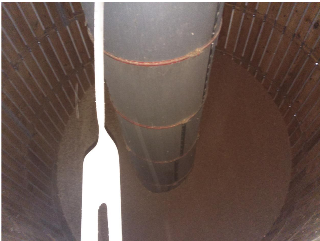
Slika 12. Središnja sitasta cijev

Središnja cijev (Slika 12.) je sitasta što omogućuje propuhivanje toplog ili hladnog zraka. U središnjoj cijevi je pomični čep koji služi kao zatvarač za prolaz zraka iznad položaja na kojemu je čep. Ovo je potrebno kada se suši roba koja nije ispunila cijeli prostor do vrha ili kada se tijekom sušenja gornja površina robe počinje spuštati. Potrebno je osigurati isti otpor prolazu zraka u vodoravnom i okomitom smjeru na gore. To se postiže namještanjem čepa na visinu kod koje je širina sloja jednolika visini iznad čepa. Sušara se puni na vrhu trakastim transporterom, a prazni na dnu (Slika 13).