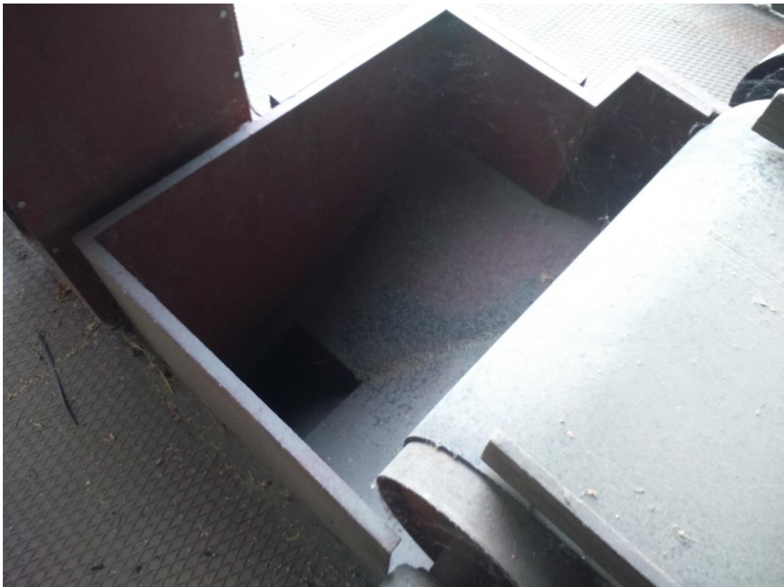
Slika 5. Kraj transportne trake, ulaz u elevator