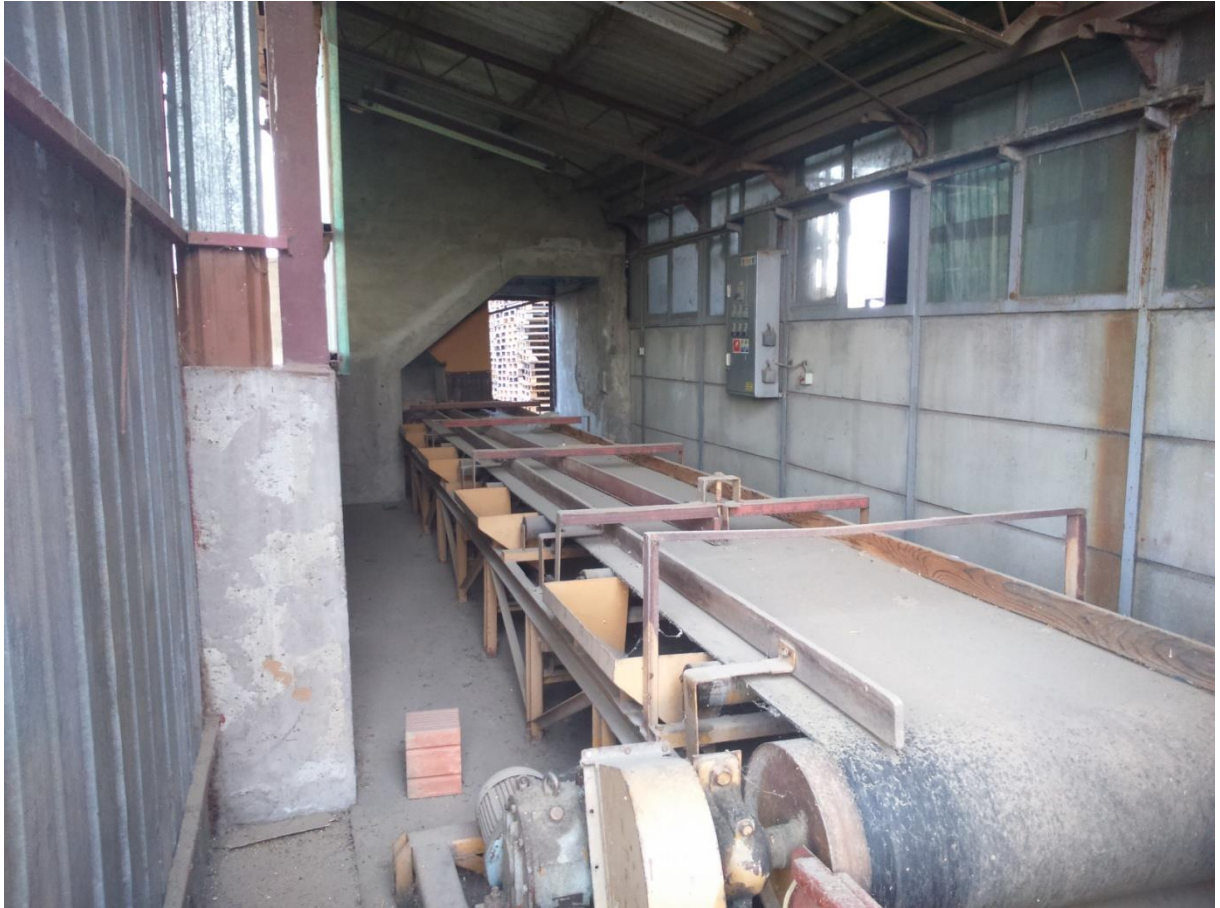
Slika 4. Transportna traka do elevatora