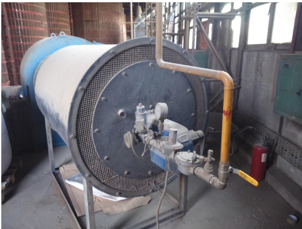
Slika 15. Plinska peć za zagrijavanje zraka