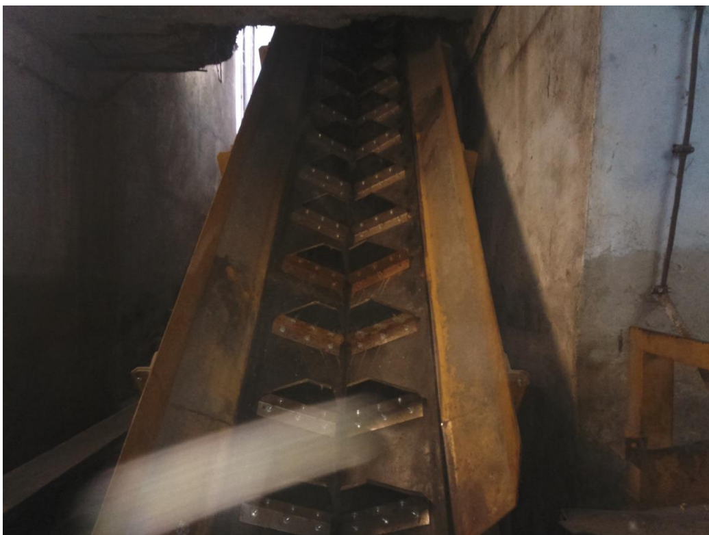
Slika 3. Transportna traka od prebirnog stola ka traci koja vodi do elevatora