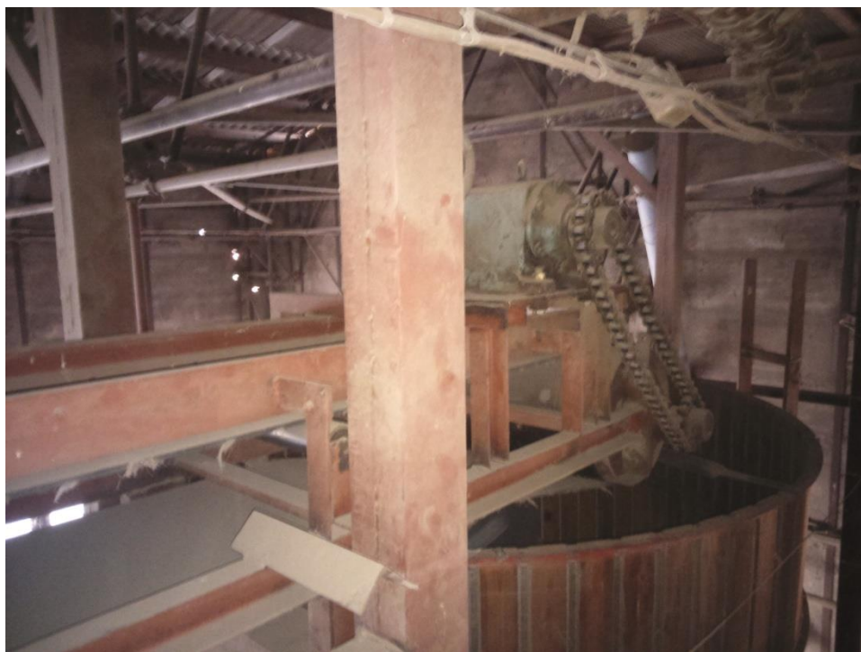
Slika 9. Mehanizam trake za raspoređivanje klipa u koševe