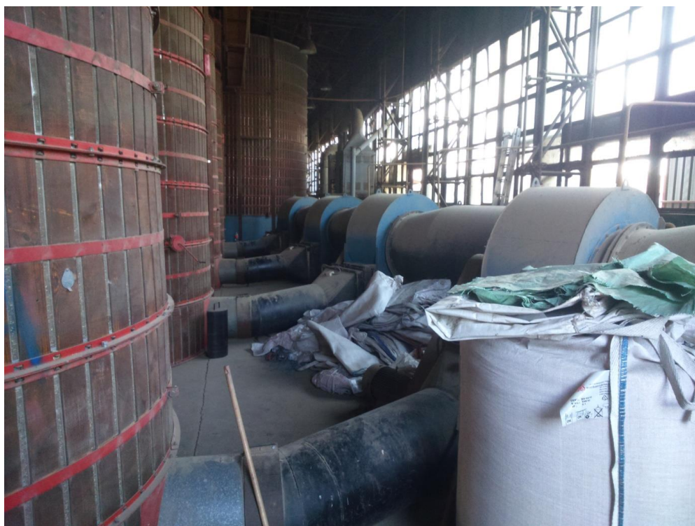
Slika 14. Mjesto upuhivanja hladnog ili toplog zraka u spremnik sušare

Sušenje se provodi upuhivanjem hladnog ili zagrijanog zraka u robu koju želimo sušiti. Upuhivanje se vrši radijalnim ventilatorom (Slika 14.) koji je postavljen pri dnu spremnika sušare.