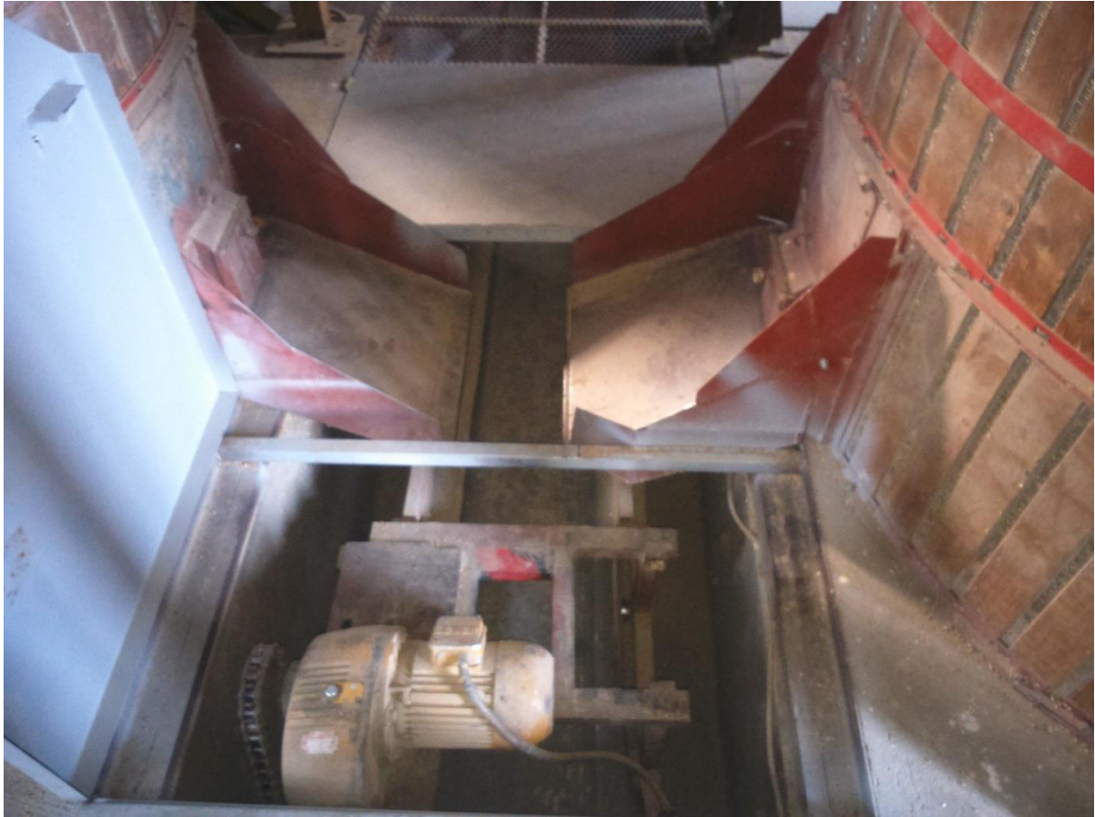
Slika 13. Mjesto pražnjenja spremnika sušare