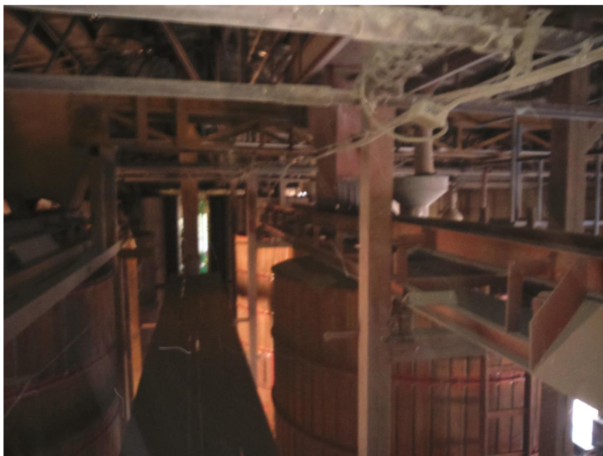
Slika 8. Traka za raspoređivanje klipa u koševima