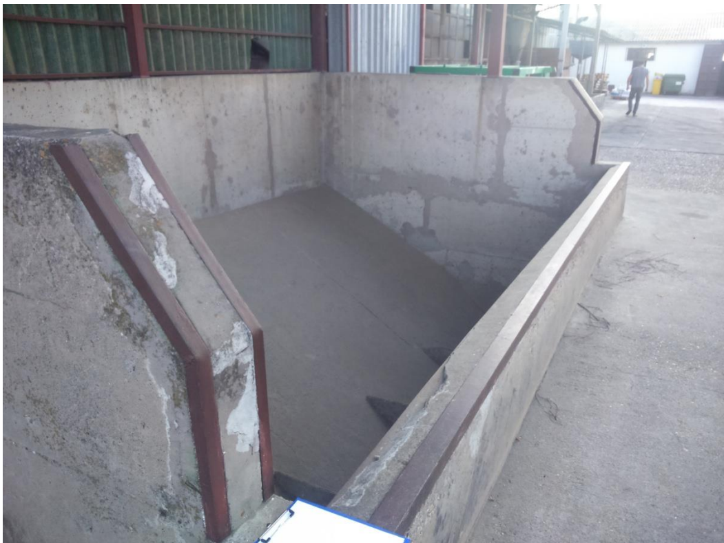
Slika 1. Prijemni bunker

Nakon mjerenja vlage kukuruz se istrese u prijemni spremnik (Slika 1.) ispod kojeg se nalazi prebirni stol (Slika 2.) na kojem se kukuruz čisti od krupnih nečistoća. S prebirnog stola, koji je ustvari pokretna traka, kukuruz se prenosi sustavom elevatora i traka do koševa u kojima se suši.