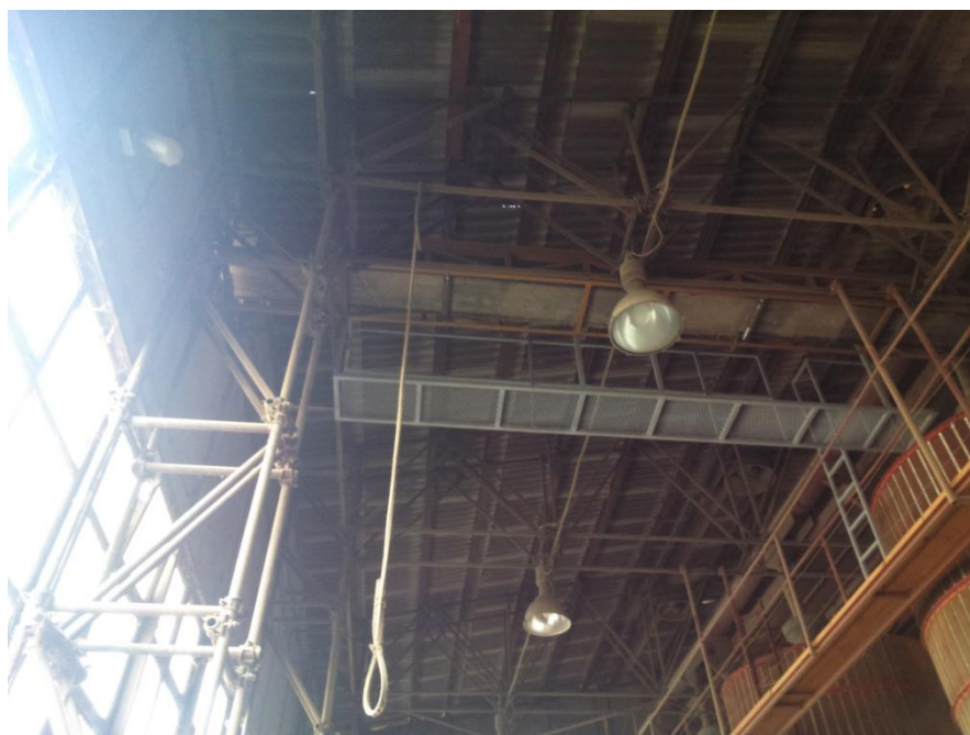
Slika 7. Traka od elevatora do trake koja raspoređuje klip u koševima

Pri vrhu elevatora počinje beskrajna traka (Slika 7.) koja nosi kukuruz od elevatora do trake koja raspoređuje kukuruz po koševima za sušenje (Slike 8. i 9.).