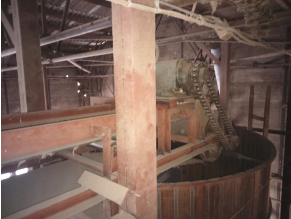
Slika 9. Mehanizam trake za raspoređivanje klipa u koševe