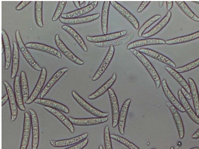
Slika 2. Makrokonidije F. solani (Poštić, 2012.)

Hlamidospore formira brzo i u velikom broju na CLA podlozi (podloga sa karanfilom). Veličina hlamidospora se kreće od 9,3 do 12,2 \mu\text{m} .