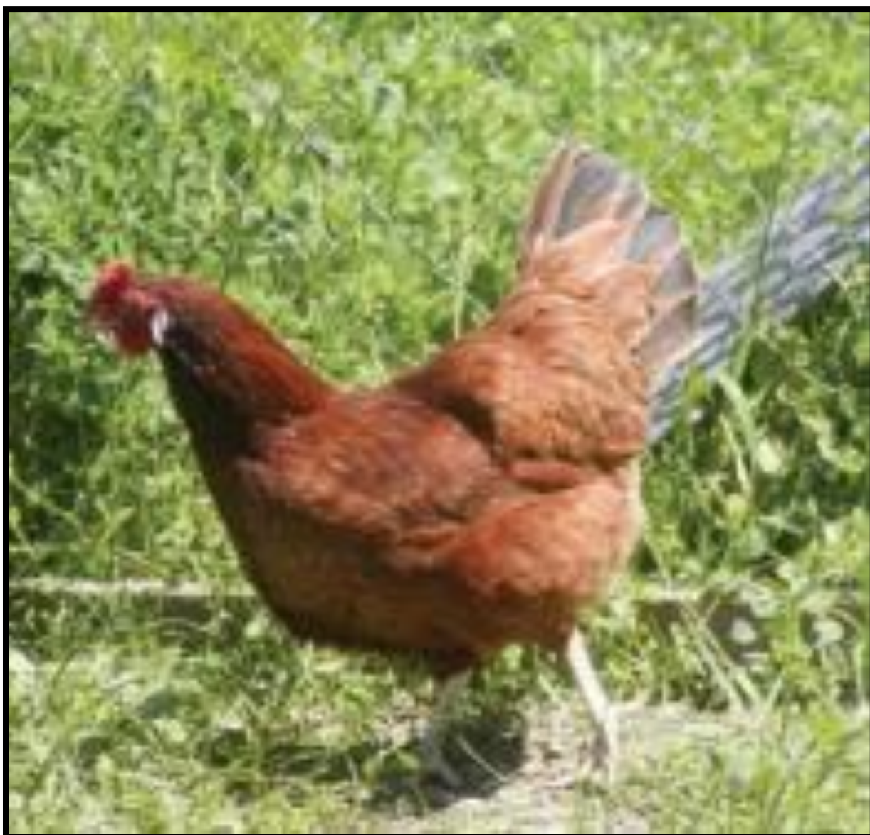
Slika 2. Kokoš hrvatica/crveni soj

Sukladno navodima HPA (2009.) pijetao i kokoš crvenog soja, najzastupljeniji su u uzgoju na malim gospodarstvima. Imaju osnovnu ciglasto-crvenu boju perja s narančasto-zlatnim vratom bez crnog crteža. Pijetao ima crni rep, metalno zelenog sjaja, dok je kod kokoši crno obojen samo vrh repa (slika 2.). Crveni soj je najzastupljeniji u ukupnom udjelu uzgoju kokoši hrvaticice u Hrvatskoj sa čak 70%.