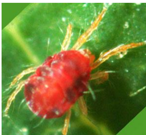
Slika 14. Koprivin crveni pauk

Mehaničkim (uništavanje korova), i kemijskim (primjena akaricida) putem.