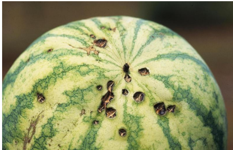
Slika 11. Simptomi antraknoze na plodu lubenice