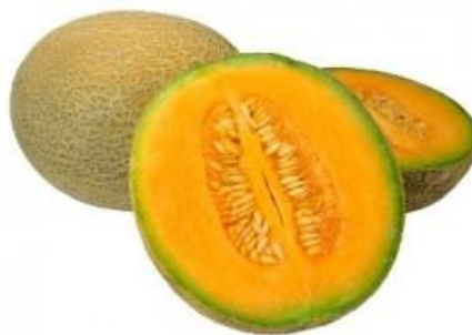
Slika 2. Dinja ( www.sirovahrana.hr )

Dinja ( Cucumis melo ) je jednogodišnja biljka takođe podrijetlom iz Afrike, a pripada porodici Cucurbitaceae ili bundeve (slika 2.). U Kini je bila poznata već 1000 godina p.n.e. Prema Bibliji kada su Izraelci napustili Egipat i s Mojsijem četrdeset godina lutali pustinjom, žalili su za svojom omiljenom hranom, posebice dinjom. Slike iz gradova Herkulanuma i Pompeja (79.g.) upućuju na to da su i Rimljani poznavali dinju ( www.coolinarka.com ).