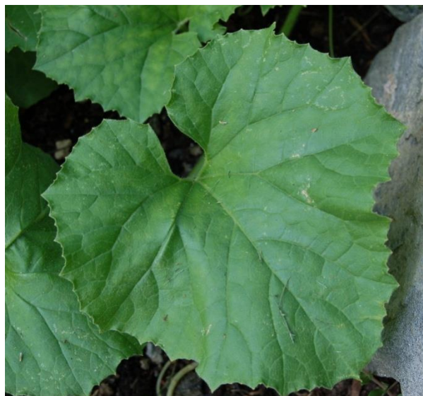
Slika 4. List dinje ( www.en.wikipedia.org )

List: dlakav, na dugim peteljka, peterokrast sa zaobljenim režnjevima (slika 4.).