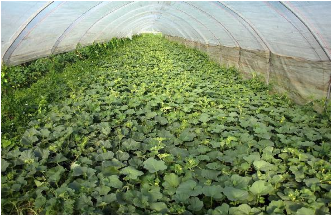
Slika 6. Proizvodnja lubenice u plasteniku

Najisplativija je rano proljetna proizvodnja u plastenicima i staklenicima, koja može biti horizontalna ili vertikalna (slika 6.). Poslije lubenice tlo ostaje čisto te je time pogodno za uzgoj drugih kultura. Sjetva presadnica se odvija krajem siječnja i nakon 30 do 35 dana biljke su spremne za presađivanje. Ista je priprema tla kao i za proizvodnju na otvorenom. Nakon sadnje biljke je potrebno dobro zaliti. Temperatura tijekom sunčanog perioda treba biti od 22 do 24°C, a noću od 15 do 17 °C. Tijekom vegetacije je potrebno regulirati rast lubenice, tako da se ostave 2 do 3 loze, a vrh se zakine iza trećeg list posljednjeg ploda, odnosno trećeg ploda. Oprašivači (bumbari i pčele) su neophodni za vrijeme cvatnje te je poželjno stavljati košnice ili bio-bumbar u staklenike ili plastenike.