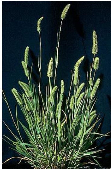
Slika 19. Zeleni muhar

Suzbijanje: mogućnost suzbijanja mehaničkim, kemijskim i biološkim mjerama.