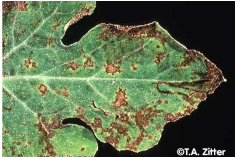
Slika 10. Antraknoza na listu lubenice

Lubenice koju se otporne na antraknozu jesu Crimson sweet, Charleston Grey, Royal sweet i druge novije hibridne sorte. Uzročnik se prenosi sjemenom, zato je sjeme potrebno tretirati s TMTD. Bolest se može spriječiti i sjetvom otpornih hibrida, plodoredom i prskanjem fungicidima tijekom vegetacije. Od fungicida se primjenjuju „Dithane M-45“ i „Saprol“.