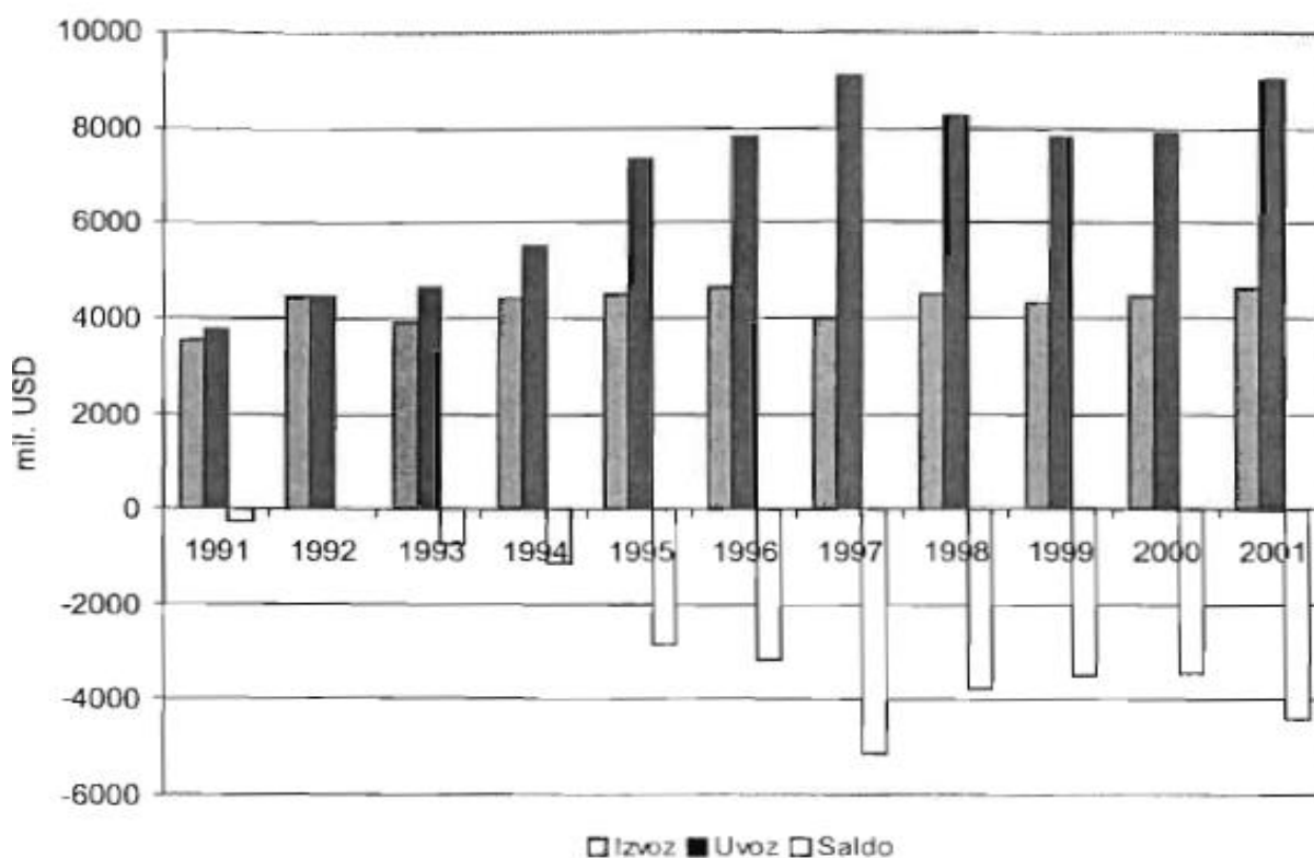
Grafikon 2. Vanjsko trgovinska bilanca (1991.-2001.)

Izvor: Hrvatska gospodarska komora (HGK)