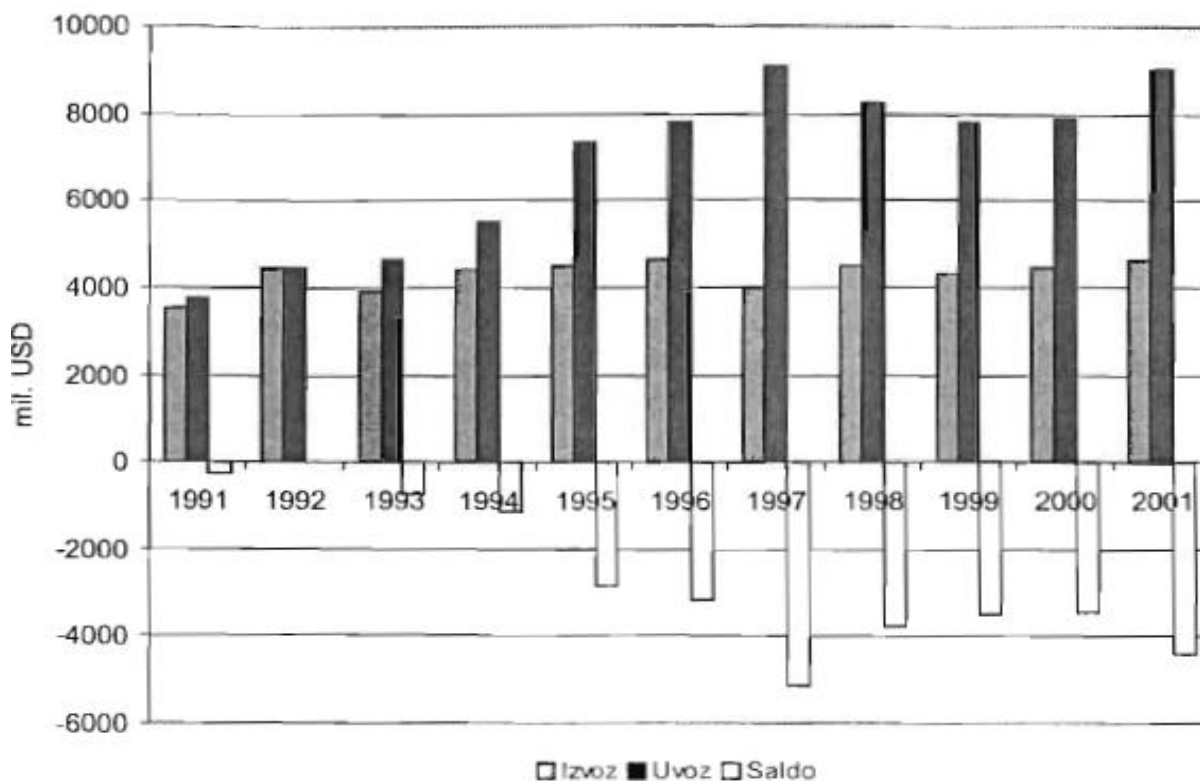
Grafikon 2. Vanjsko trgovinska bilanca (1991.-2001.)

Izvor: Hrvatska gospodarska komora (HGK)