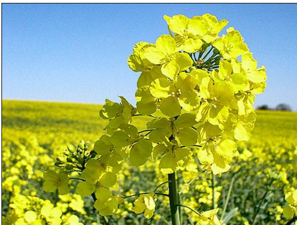
Slika 1. Uljana repica https://www.google.hr/search?q=uljana+repica