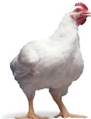
Slika 2. Ross 308 ( http://www.protofeeds.com/wp-content/uploads/2013/07/chickena.jpg )