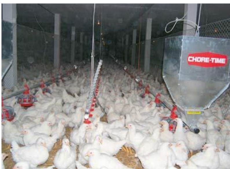
Slika 13. Podno držanje pilića

Uzgoj na rešetkastom podu je reguliran direktivom EC Direktive 199/74/EG, kojom gustoća naseljenosti ne smije biti veća od 9 kokoši po m 2 . Rešetke moraju biti konstruirane na način da podržavaju smjer prednjih noktiju noge, a nagib poda ne smije biti veći od 8°.