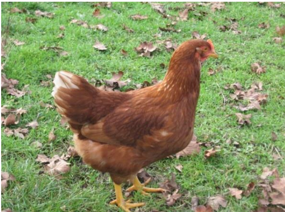
Slika 4. Lohmann

http://www.hubbardbreeders.com/media/f15_2_059047400_1108_12122014.jpg