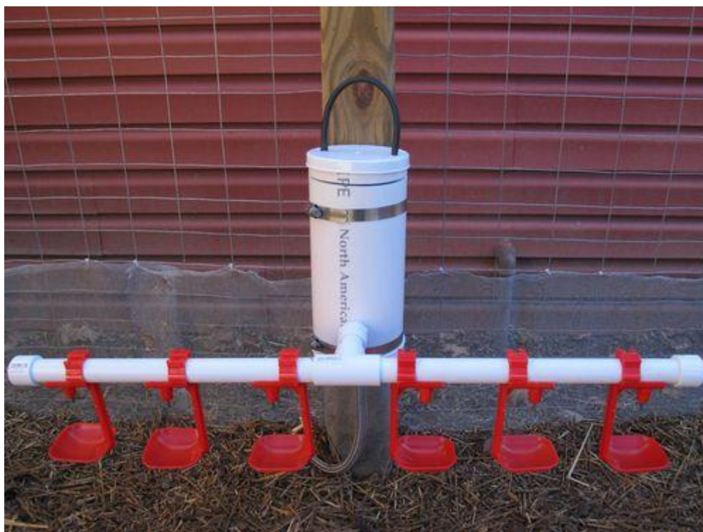
Slika 12. Automatska nipple pojilica ( https://s-media-cache-ak0.pinimg.com/736x/05/93/b9/0593b967df369aeca78cd5bfcff66726.jpg )

U intenzivnom uzgoji individualne pojilice su najzastupljenije jer se na taj način osigurava manje rasipanje vode i smanjenje mogućnosti stvaranja mikroorganizama u stelji zbog povećane vlage. Sustavi za napajanje s individualnim pojilicama su: priključak za vodu, filtra za vodu, vodomjer, dozator lijekova s miješalicom za lijekove, niskotlačni regulator tlaka do 0,3 do 1,5 bara, visokotlačni regulator od 1,5 do 6 bara, loptastog spremnika sa sustavom za isparavanje, sustav ovjesa, nipple pojilica sa šalicama i bez. Nipple pojilice prema izvedbama razlikujemo prema protoke vode. Rade na principu kontakta sa kljunom pileta. Kada pile dotakne pojilicu curi voda.