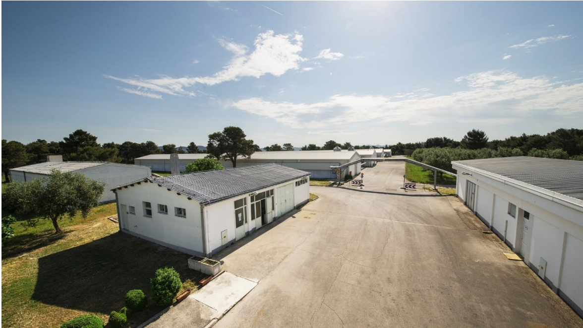
Slika 5. Peradarska farma