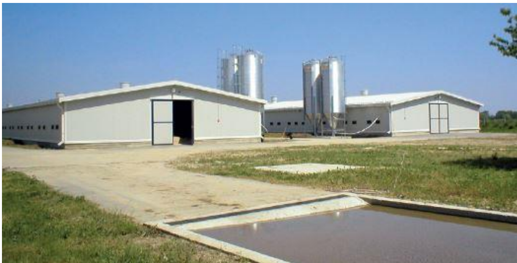
Slika 6. Dezbarijera na ulazu ( http://www.gospodarski.hr/Multimedia/Pictures/Prilozi/Drzanje_kokosi_nesilja/Drzanje_kokosi_nesilja_1.JPG )