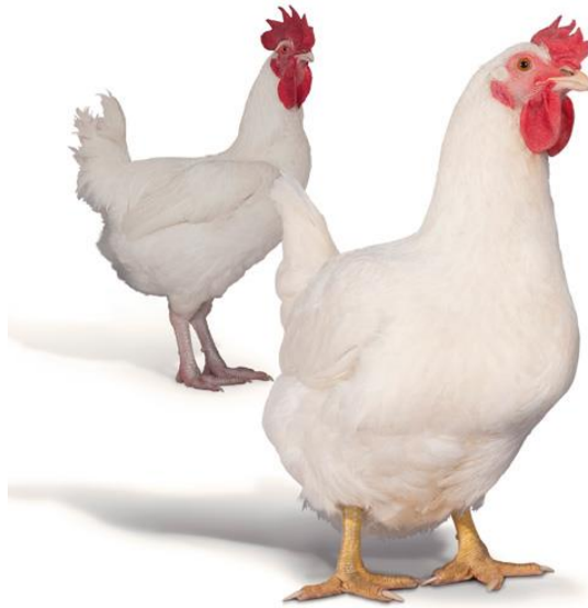
Slika 3. Hubbard

http://www.hubbardbreeders.com/media/f15_2_059047400_1108_12122014.jpg