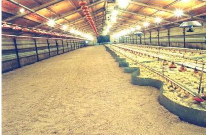
Slika 7. Pregrade u prvim danima tova

Djelomično zagrijavanje peradnjaka koristi se kod pilića u prvim tjednima rasta. Za zagrijavanje se koriste tzv. umjetne kvočke, odnosno infracrvene lampe, spiralni električni grijači i plinske infragrijalice koje proizvode toplinu i lokalno zagrijavaju određene dijelove peradnjaka.