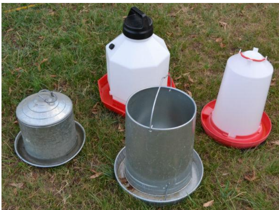
Slika 11. Manualne hranilice za piliće