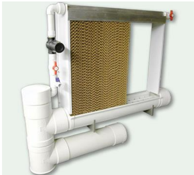
Slika 9. Pad Cooling - sustav za hlađenje prostora ( http://www.profarm.hr/fotografije/klima_kontrolori_ventilatori/pad_cooling1.jpg )

Previsoka temperatura negativno utječe na perad jer dolazi do povećanja koncentracije amonijaka u zraku zbog čega dolazi do smanjenja konzumacije hrane. Optimalna temperatura peradnjaka kreće se od 15 do 25°C. Hlađenje peradnjaka se može obaviti na više načina, jedan od načina je pojačavanje ventilacije. Drugi način je Pad Cooling - sustav za hlađenje prostora pomoću hladne vode kod kojeg voda prolazi kroz lamele, a sa druge strane ulazi zrak koji se hladi vodom i ulazi u peradnjak. Treći način je pomoću mlaznica visokog pritiska, na taj način voda u zraku kondenzira i povećava se vlaga, a ujedno i smanjuje temperatura peradnjaka unutar nekoliko minuta.