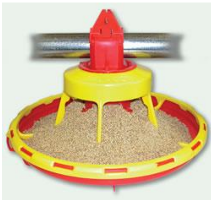
Slika 10. Automatska hranilica za piliće ( http://www.profarm.hr/fotografije/hranjenje_pojenje_perad/XL100NG.jpg )