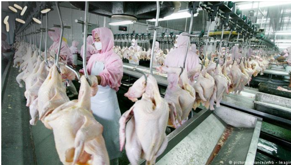
Slika 15. Automatizirana klaonica pilića ( http://www.dw.com/image/0,,15664821_303,00.jpg )

5 dana prije izlova peradi hrane se završnom smjesom, a 24 sata prije izlova im se uskraćuje hrana. Da bi izlov brojlera bio jednostavniji izlovljavaju se pod plavim svjetlom pod kojim slabije vide. Brojlere je potrebno prevesti u klaonicu po zakonskim regulativama da način da im se stres smanji na minimum. U klaonici se vješaju na pokretnu traku koja ih vodi do mjesta klanja, rez klanja je iza ušnog otvora pileta. Neposredno iza mjesta klanja počinje tunel za iskrvarenje i skupljanje krvi. Zatim slijedi šurenje pilića u toploj vodi temperature 50-62°C 2-3 minute. Zatim ga idu na čupanje perja gumenim prstima koji se vrte u raznim smjerovima i ne oštećuju kožu. Poslije čupanja perja slijedi pranje pilića, tada su spremni za daljnju obradu i mesari ih rasijecaju na dijelove ili pakiraju u komadu, najčešće ih pakiraju u vakumirane vrećice ili na stiroporske podloge.