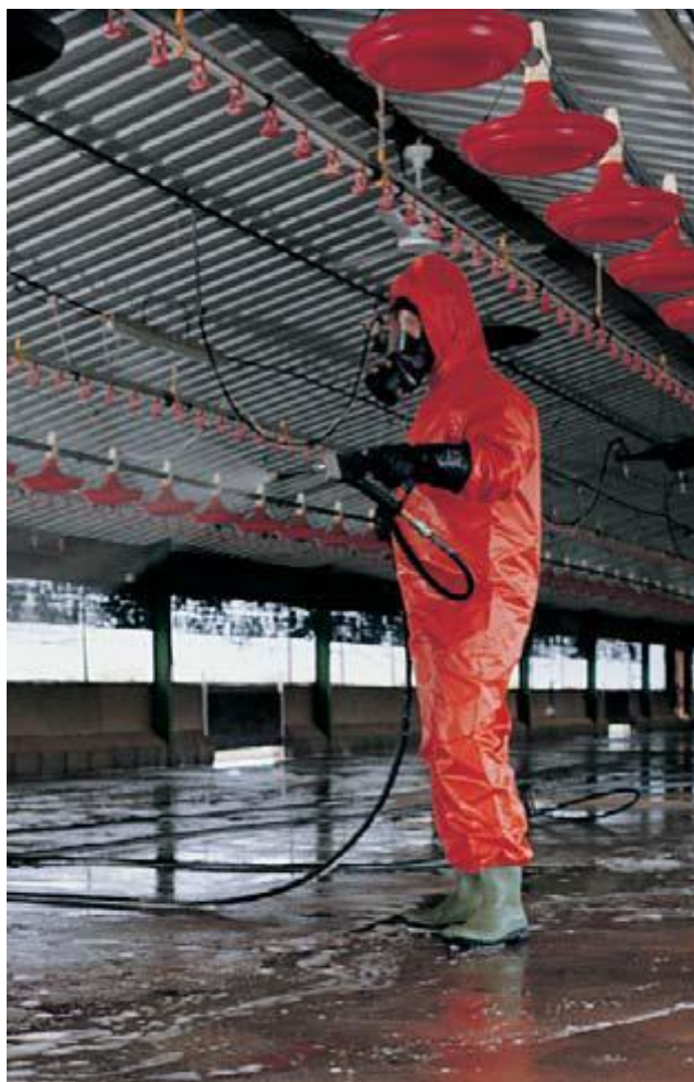
Slika 14. Čišćenje peradarnika ( http://bayer-veterina.hr/html/images/upload/biosigurnost/3.jpg )

Izgnojavanje se vrši nakon proizvodnog ciklusa kada svi brojleri napuste peradarnik. Po napuštanju peradarnika potrebno je izvršiti sakupljanje stelje i čišćenje svih ostataka hrane u sustavima za hranjenje. Proizvodni objekt se prvo čiste mehaničkim čišćenjem: metenjem, struganjem, četkanjem i ispuhivanjem svih površina (strop, zidovi, pod i oprema). Nakon čišćenja objekt se dezinficira efikasnim dezinfekcijskim sredstvom i priprema za novi turnus.