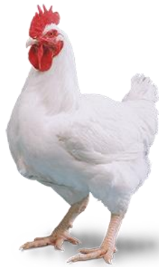
Slika 1. Cobb 700 ( http://www.cobb-vantress.com/img/products/Cobb700-small.png )

Proizvodnja pilećeg mesa odvija se poljoprivrednim gospodarstvima i na velikim peradarskim farmama. Uspješnost uzgoja ponajviše ovisi o pravilnom odabiru hibrida, radi toga velike selekcijske tvrtke za potrebe uzgajivača stvaraju nekoliko proizvodnih tipova koji se razlikuju po proizvodnim osobinama. Cilj hibrida je u što kraćem vremenu imati ostvariti što veći prirast, zbog toga se hibridima poboljšava konverzija hrane, otpornost, veći udio mesa u trupu te bolja kvaliteta trupa u odnosu na ostale pasmine. U hrvatskoj najzastupljeniji linijski hibridi su: Ross, Hubbard, Cobb i Lohmann. Selekcijom su ih namijenili za tov i ne mogu se koristiti u daljnjoj reprodukciji. Reprodukcijskim hibridom dolazi do smanjenja proizvodnih svojstava. Ovi hibridi su dugotrajnom selekcijom, koji je složen i stručan posao obavili istraživački instituti, da bi postigli dobre proizvodne rezultate, poboljšali otvorenost, ojačali konstituciju i konverziju hrane, te meso zadovoljavajuće prehrambene i tehnološke kvalitete.