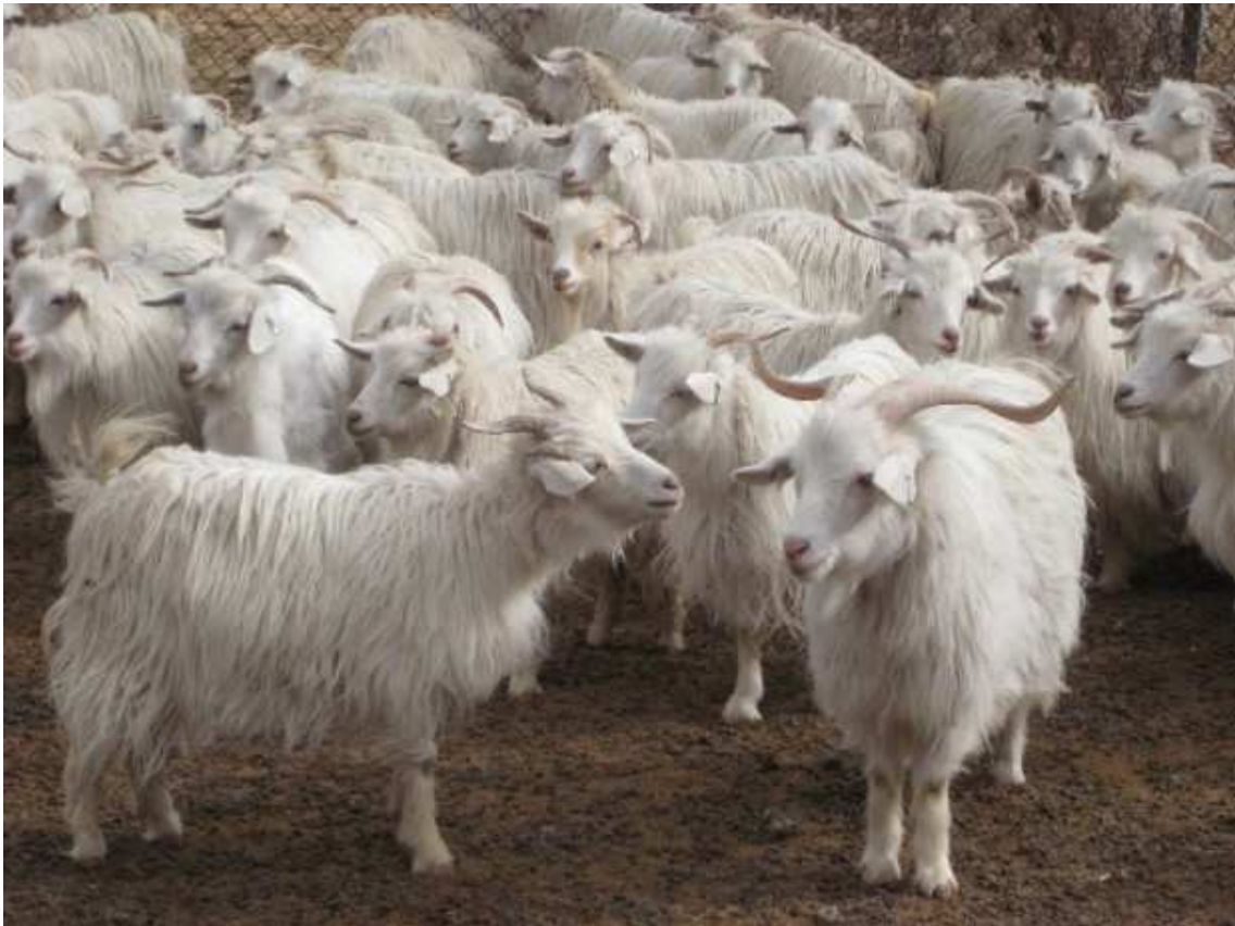
Slika 5. Kašmirska koza