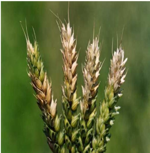
Slika 4. Palež klasa i lista pšenice uzrokovana s Fusarium sp.