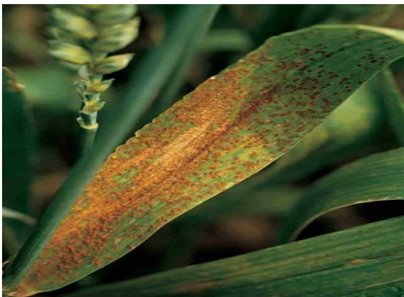
Slika 7. Puccinia recondita