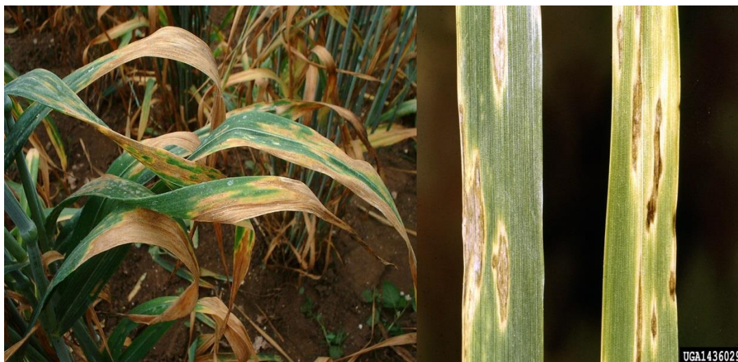
Slika 2. Septoria tritici

vegetacije. Za pojavu bolesti u jakom intenzitetu potrebno je duže vremena vlažno vrijeme, a optimalne temperature za klijanje konidija su 20-25 °C. Iako u prirodi dolazi i do napada klasova, za sada nije poznato da se prenosi sjemenom.