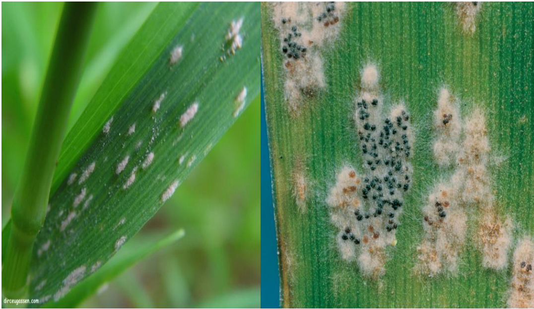
Slika 9. Erysiphe graminis ( http://www.plantmanagementnetwork.org/ )