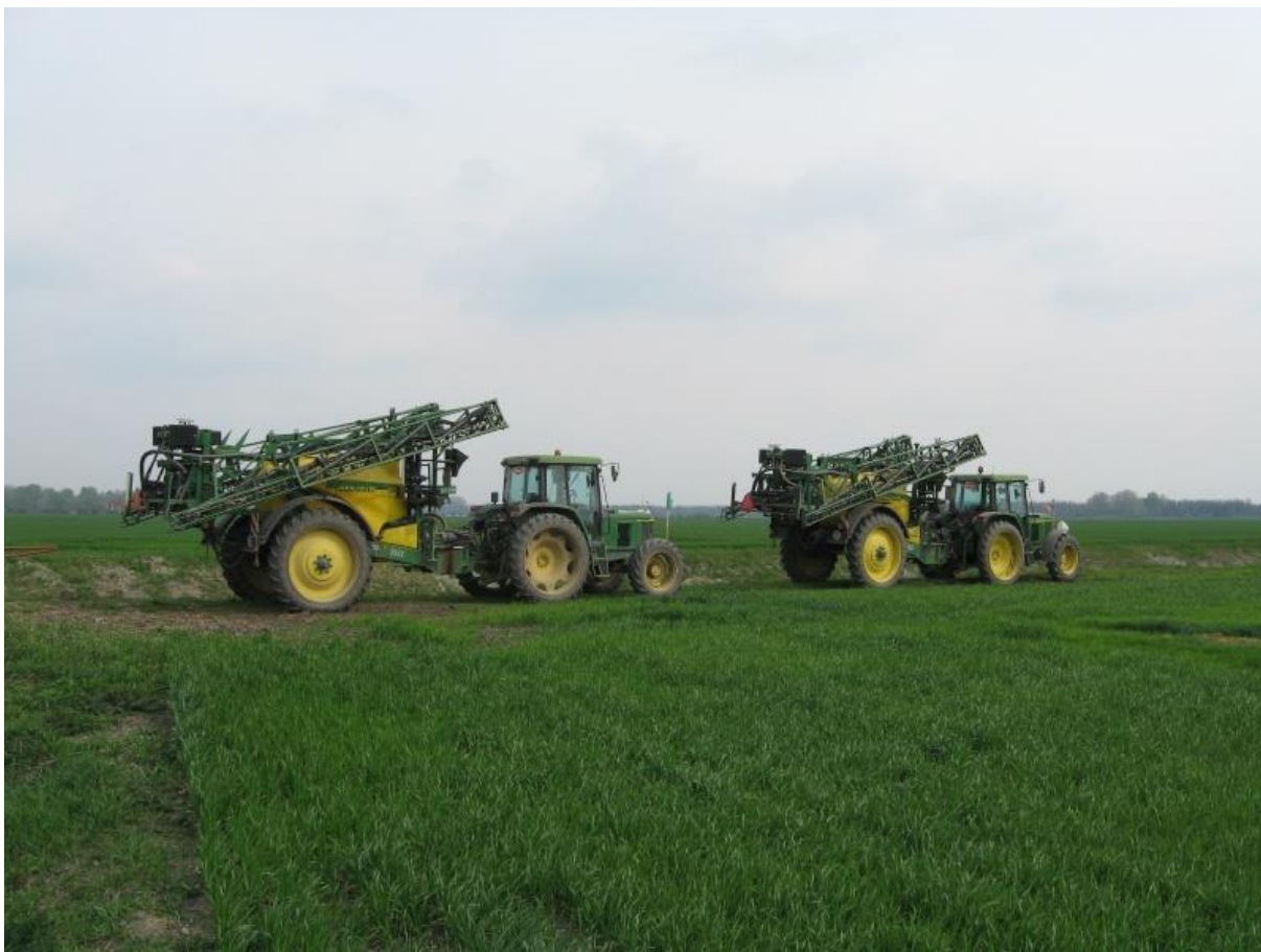
Slika 10. Zaštita pšenice na Kutjevo d.d.

Na temelju pravila struke određuje se i provodi zaštita pšenice fungicidima koji za tu namjenu imaju dozvolu u RH. Zaštita pšenice se provodi uglavnom preventivno, prije pojave prvih simptoma bolesti iako se u nekim slučajevima (kada se nije moglo ići u zaštitu usjeva zbog nemogućnosti ulaska traktorskih prskalica u tablu) u zaštitu pšenice od bolesti ide i kada se pojave simptomi bolesti. Značajnog napada bolesti na pšenici nije bilo.