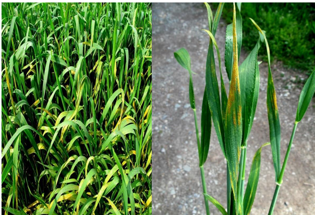
Slika 8. Puccinia striiformis ( http://www.plantmanagementnetwork.org/ )