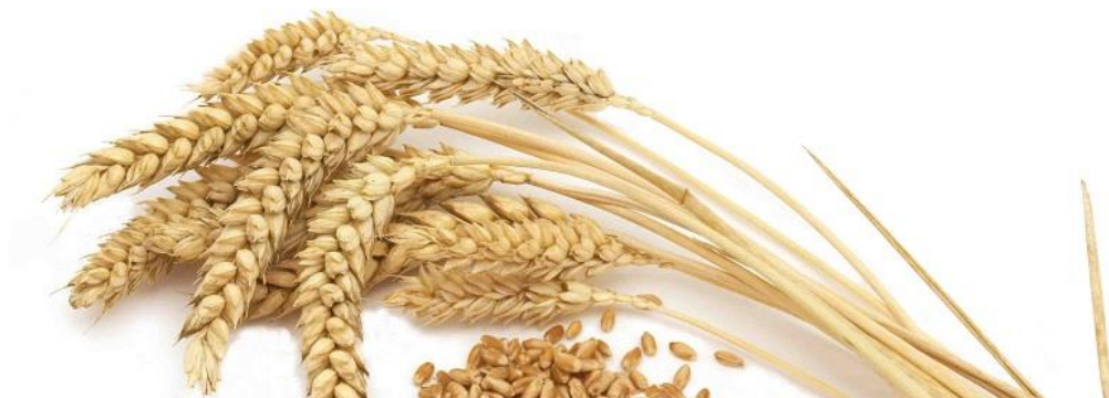
Slika 1. Pšenica ( Triticum vulgare )

Pšenični kruh osnovna je je hrana za oko 70 % ljudske populacije i sadrži 15-17 % proteina, 18 % ugljikohidrata i oko 1,3 % masti. Dobro je probavljiv i bogat vitaminima B kompleksa.