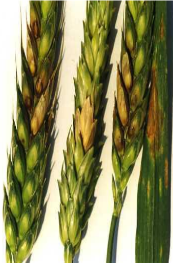
Slika 3. Palež klasa pšenice uzrokovana s Fusarium graminearum ( https://blogs.cornell.edu )