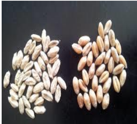
Slika 5. Microdochium nivale ( http://klei.artwerbung.net/ )