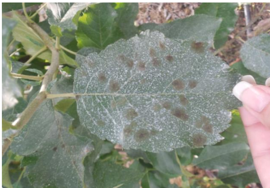
Slika 2. Mrljavost lista

Pjege na peteljckama ploda i lista su iste ili slične. Simptomi na cvjetovima obično se pojavljuju kao male, tamno zelena mrlje, a simptomi su vidljivi na cvjetnoj stapci, listićima čaške i čaški. Može doći do otpadanja cvjetova što rezultira manjim prinosom (Vaillancourt i sur. 2005.).