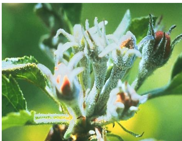
Slika 5. Pepelnica na cvjetovima

Cvjetovi razvijeni iz zaraženog cvjetnog pupa su zelenkasti i lapovi su im pepeljasti, latice zaostanu u rastu, ostaju vrlo malene i imaju zelenkastu boju s malenim uškama, pa se u takvim cvjetovima prašnici i tučak jače ističu (Slika 5.). Ti cvjetovi više ne mogu razviti plod jer su sterilni. Infekcije ploda su sekundarne infekcije i one se ostvaruju ili kod zametanja ploda ili dok je još plod sitan. Na plodovima se javlja mrežasta nekroza koja umanjuje kvalitetu plodova (Slika 6.) (Cvjetković, 2010.).