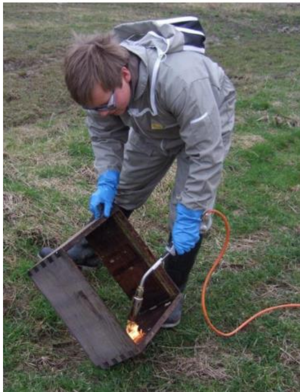
Slika 8. Fizikalna dezinfekcija košnice plinskim plamenikom; Izvor: Ljubičić, I.: Higijena pčelinjaka , Veleučilište „Marko Marulić“ u Kninu, 2011., str. 21.

Fizikalna dezinfekcija. Toplina je najvažnije fizikalno sredstvo pri dezinfekciji, a postiže se na više načina. Primjerice, plamenom benzinskog ili plinskog plamenika. Plamen treba zahvatiti svaki dio košnice, ali isto tako treba paziti da se ne spali previše. Drvo treba dobiti svijetlo žutu boju.