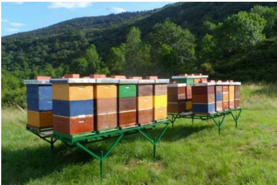
Slika 4. Smještaj ekološkog pčelinjaka