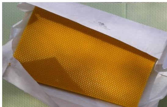
Slika 6. Ekološka satna osnova – izrađena od voska; Izvor: www.google.hr/search?q=ekološke+satne+osnove , 3.1.2016.

Jedna od najčešćih i najopasnijih bolesti pčela protiv kojih se bore pčelari dilje svijeta, jest nametnička bolest – varooza. Čiji je uzročnik grinja Varroa destructor . Odrasle jedinke