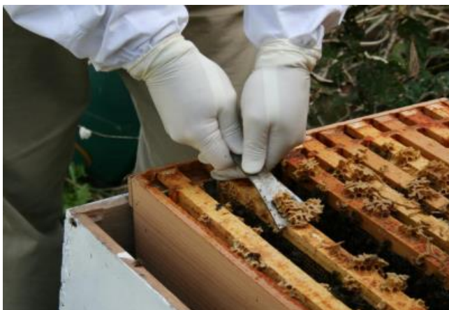
Slika 7. Struganje voska, propolisa i drugih nečistoća s košnice;

Prije provedbe postupka čišćenja treba odvojiti nastavke, odnosno sve sastavne dijelove košnice. Također korisno je sve sastavne dijelove staviti u ledenicu (-20°C) u trajanju od najmanje 48 sati. Duboko zamrzavanje uništava štetnika – voskovog moljca. Dijelovi košnice čiste se na tlu koje je prethodno prekriveno kartonom ili novinskim papirom. Čišćenje započinje temeljitim struganjem naslaga voska, propolisa i nečistoća sa svih drvenih dijelova košnice. Sav zarazni materijal i nečistoće koje pri čišćenju padnu s okvira, ostaju na prostrtom papiru i po završetku procesa čišćenja treba ih skupiti i uništiti spaljivanjem. Pribor korišten za struganje (pčelarsko dlijeto) na kraju postupka također treba očistiti (Ljubičić, 2011.).