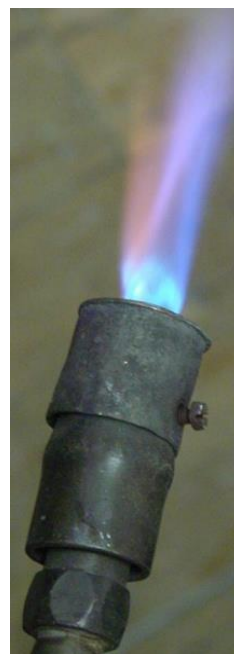
Slika 9. Benzinski plamenik

Vlažna toplina podrazumijeva iskuhavanje, pranje u perilici na povišenim temperaturama (90°C), te upotrebom pare pod tlakom (autoklav) na 110°C.