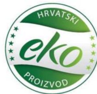
Slika 2. „Hrvatski eko proizvod“