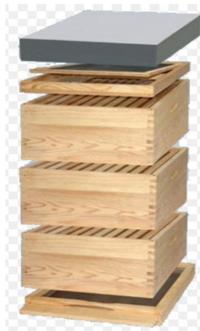
Slika 5. LR košnica s vrlo malo metalnih dijelova – najprikladnija za ekološko pčelarenje;

Kada je riječ o satnim osnovama, zakonski propisi o ekološkom pčelarstvu zahtijevaju isključivo uporabu ekoloških satnih osnova. (Članak 14, st. 4 Pravilnika o ekološkoj proizvodnji bilja i životinja: Pčelinji vosak za nove satne osnove mora potjecati iz jedinica ekološkog uzgoja ). Ekološki materijal za izradu satnih osnova je, dakle, vosak. Ako