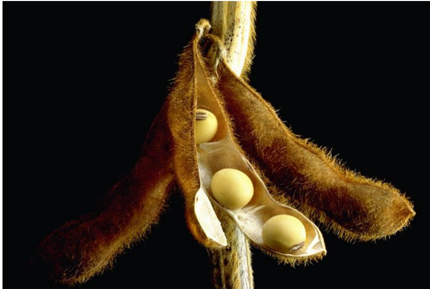
Slika 6. Zrela mahuna soje