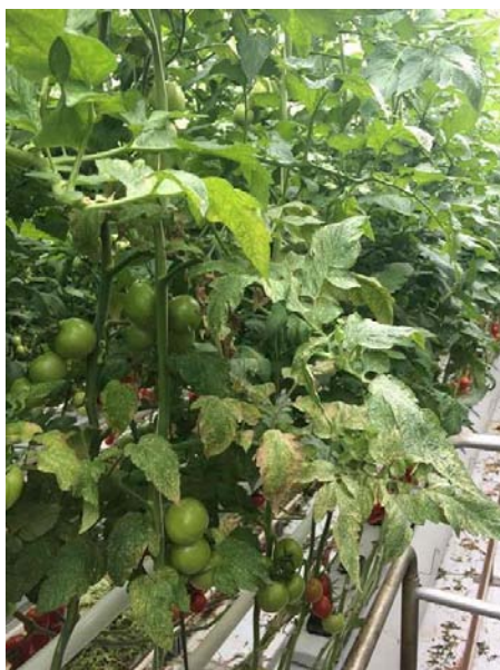
Slika 26. Simptomi na lišću