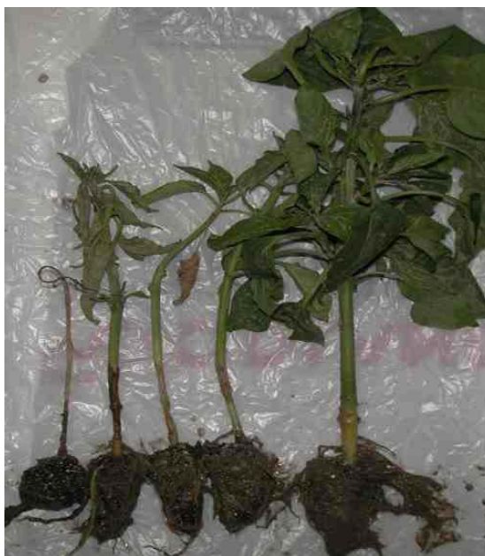
Slika 10. Uvenule mlade biljke