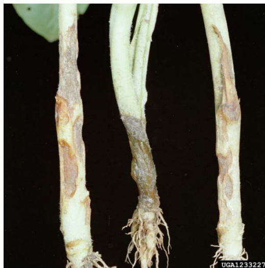
Slika 9. Simptomi na korijenovom vratu

Bolesne biljke poliježu i na njima se javlja bjeličasti micelij koji se širi i po površini tla / supstrata (slika 10.). Starije biljke slabije obolijevaju i na njima se mogu naći pjege na stabljici, zaostaju u rastu i javlja se venuće (Maceljski i sur.,2004.).