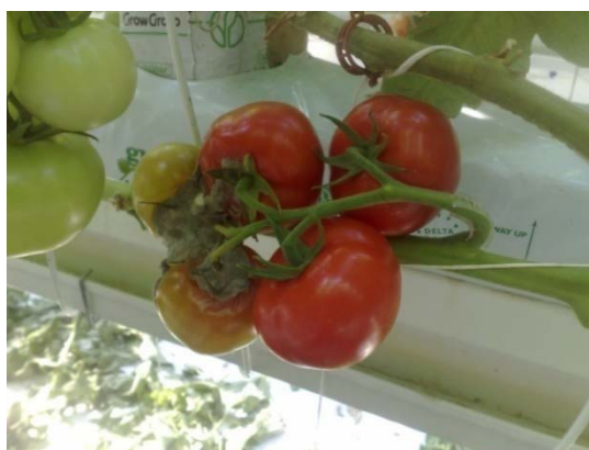
Slika 27. Simptomi na plodovima