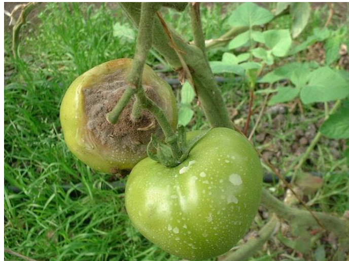
Slika 4. Simptomi na plodu