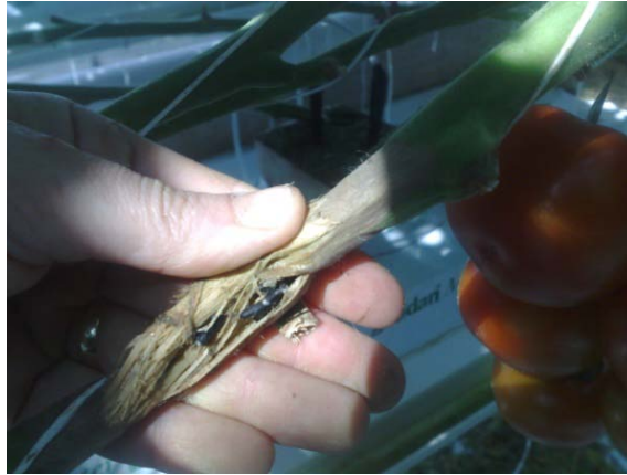
Slika 30. Simptomi na stabljici

Bijela trulež se u prirodi održava u vidu sklerocija koje mogu klijati u micelij ili se nakon perioda niskih temperatura na njima formiraju askusi s askosporama. Kao i kod prethodne dvije bolesti, askospore nošene vjetrom dopijevaju u staklenik tijekom prozračivanja. Askospore vrše zaraze kroz oštećene dijelove biljke.