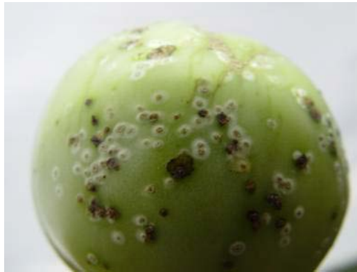
Slika 14. Simptomi na plodu