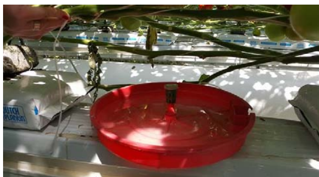
Slika 23. Tutasan trap