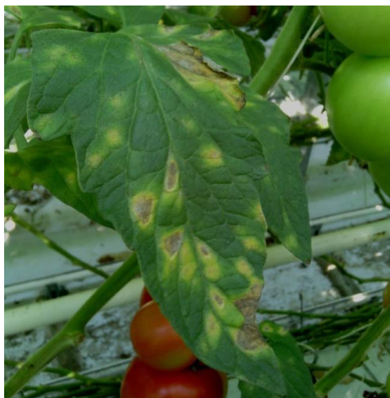
Slika 2. Pepelnica