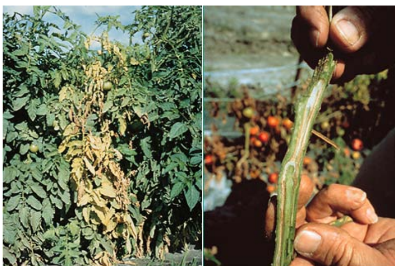
Slika 6. Simptomi venuća izazvanog Fusarium oxysporum f. sp. lycopersici