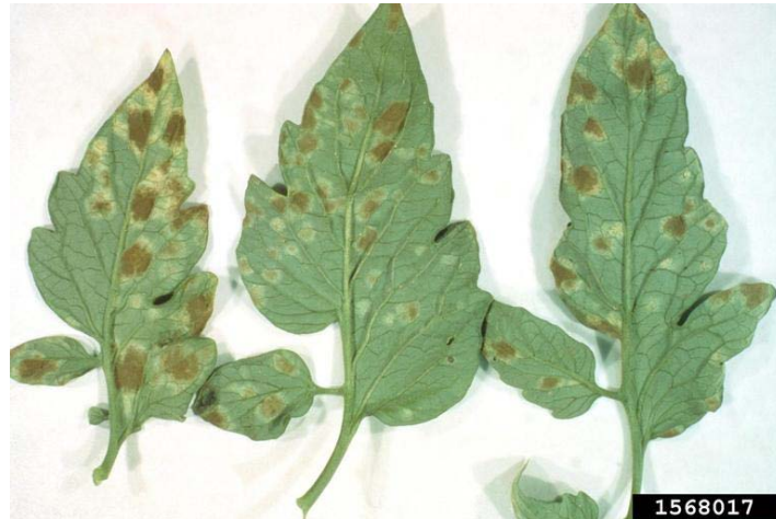
Slika 11. Baršunasta plijesan na listovima

pjege, a na zrelih plodovima ulegnute žute pjege. Kada su zaraženi plodovi, micelij prodire duboko u plod pa su zaražene i sjemenke. Nakon sjetve zaraženog sjemena mlade biljke su također zaražene. Optimalna temperatura za infekciju je 22°C uz relativnu vlagu zraka od 90 do 95 % (Maceljski i sur.,2004.).