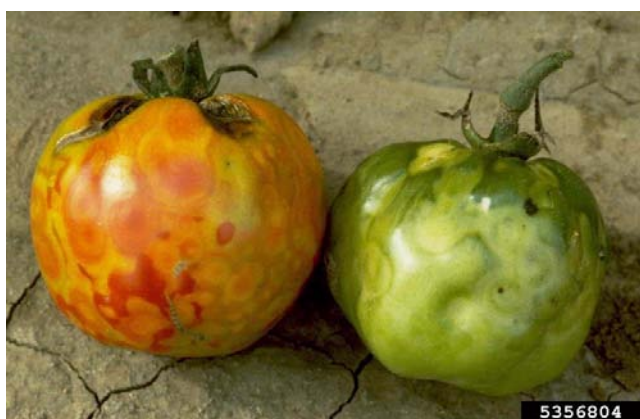
Slika 17. Simptomi na plodovima

Virus se prenosi mehanički ili putem vektora odnosno uz pomoć čovjeka ili životinja ili kontakt zaražene i zdrave biljke kod vjetra i nevremena. Ulazi u stanicu domaćina preko rana. Vektori su kukci iz reda Thysanoptera -resičari ili tripsi (Kajić i Milanović, 2013.).