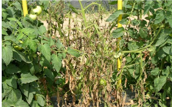
Slika 15. Bakterijsko venuće rajčice