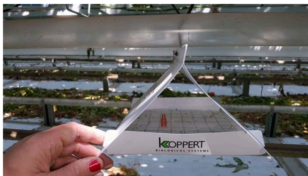
Slika 22. Delta trap