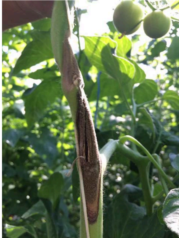
Slika 3. Simptomi na stabljici