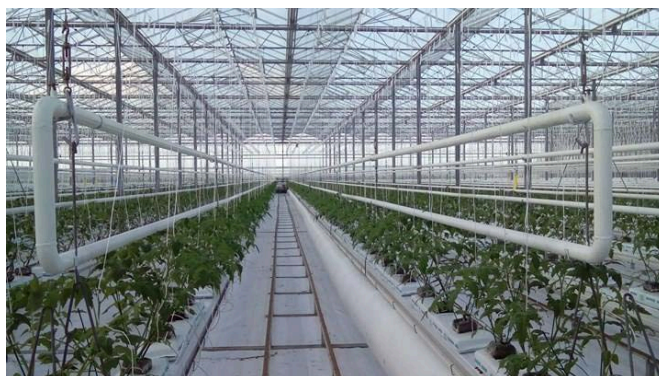
Slika 19. Mlade biljke u stakleniku

Presadnice za hidroponski uzgoj proizvode se u grijanim zaštićenim prostorima sjetvom u čepove kamene vune s kojima se u fazi kotiledonskih listova biljke presađuju u veće blokove, najčešće kvadratičnog oblika širine 10cm i visine 7,5 cm. Čepovi i blokovi se vlaže hranjivom otopinom sastava prilagođenog razvojnom stadiju biljke, a temperaturni režim je isti kao kod kontejnerskog uzgoja presadnica i u grijanim zaštićenim prostorima. Presađivanje na stalno mjesto se obavlja postavljanjem presadnica s blokovima kamene vune na prethodno napravljene otvore na supstratuistih dimenzija kao što su blokovi s presadnicama(slika 19.). Raspored biljaka može biti isti kao i pri klasičnom načinu uzgoja u zaštićenim prostorima. Do svake biljke se provede cijev za dovod hranjive otopine. Centralnim sustavom za distribuciju hranjive otopine dozira se, ovisno o razvojnom stadiju biljke i uvjetima za fotosintezu, određena količina hranjive otopine. Višak hranjive otopine koji se kanalima dovodi do sabirnog mjesta može se ponovno uključiti u sustav. Hranjiva otopina sadrži u optimalnom odnosu sve hranjive biogene elemente, određene je pH vrijednosti i koncentracije koja se određuje stupnjem električne provodljivosti. Ostali režimi tijekom uzgoja, kao što su temperature, relativna vlaga zraka, ili sadržaj ugljičnog dioksida te sama tehnika uzgoja, identični su onima koji se primjenjuju u klasičnom načinu uzgoja u zaštićenim prostorima.