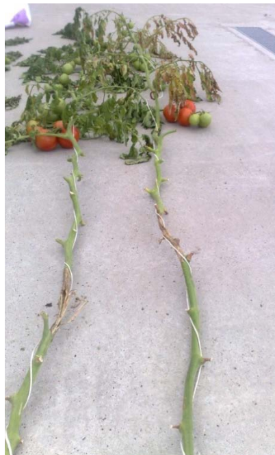
Slika 31. Simptomi na stabljici i listovima