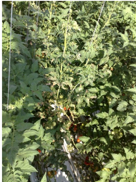
Slika 32. Simptomi na lišću

Simptomi su se javili na listovima u vidu klorotičnih pjega, list je uvenuo i sušio se (slika 32.). Simptomi bolesti nisu utvrđeni na stabljikama plodovima.