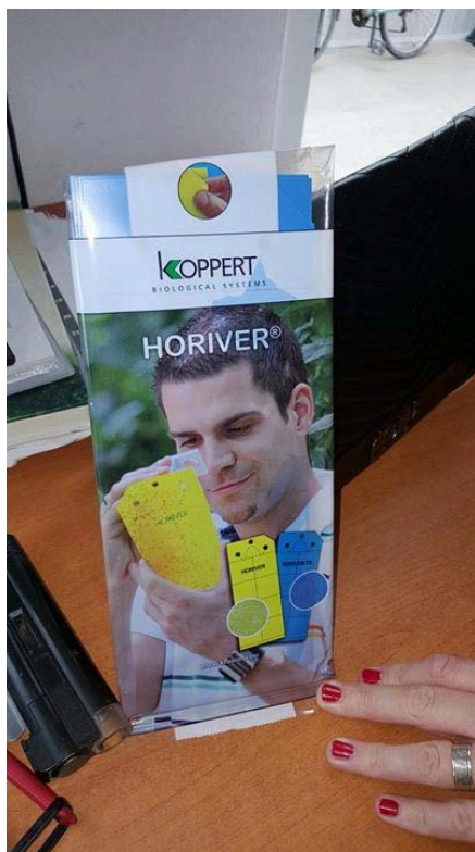
Slika 21. Plave i žute ljepljive ploče

Zaštita od bolesti i štetnika se vrši u skladu s tehnološkim uputama za integriranu proizvodnju povrća, biološkom zaštitom te samo u iznimnim slučajevima upotrebom SZB u skladu s uputama proizvođača. Redovito se provodi pregled na bolesti i štetnike kako bi se odmah uočila pojava bolesti ili štetnika te poduzele odgovarajuće mjere za njihovo suzbijanje. Prisutnost i brojnost štetnika prati se pomoću feromonski lovki (slika 22. i 23.), ljepljivim pločama (slika 21.) i direktnim pregledom.