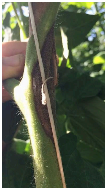
Slika 24. Siva plijesan na stabljici

Simptomi su do sada utvrđeni na stabljici (slika 24.) i vrlo rijetko na lišću i plodovima. Na stabljici se razvija sivo smeđi micelij (slika 25.), a na listovima palež i nekroza (slika 26.). Na plodovima se razvija sivi micelij i trulež (slika 27.).