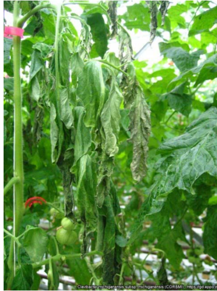
Slika 12. Simptomi na listu

Parazit se prenosi sjemenom i zaraženim biljnim ostacima. (Maceljski i sur.,2004.)