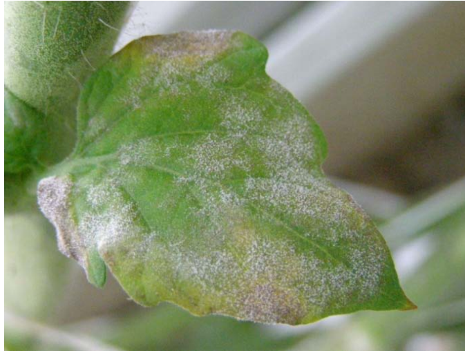
Slika 28. Prevlaka micelija na licu lista