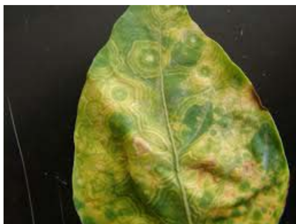
Slika 18. Simptomi na listu