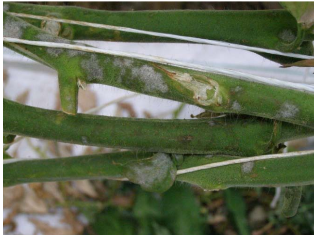
Slika 29. Prevlaka micelija na stabljici