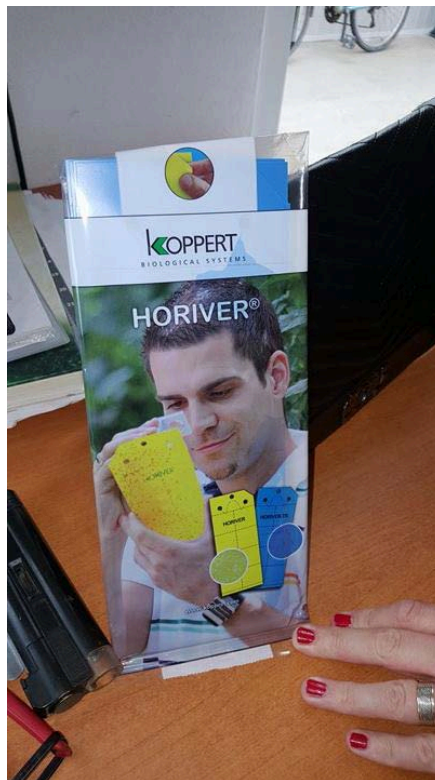
Slika 21. Plave i žute ljepljive ploče

Zaštita od bolesti i štetnika se vrši u skladu s tehnološkim uputama za integriranu proizvodnju povrća, biološkom zaštitom te samo u iznimnim slučajevima upotrebom SZB u skladu s uputama proizvođača. Redovito se provodi pregled na bolesti i štetnike kako bi se odmah uočila pojava bolesti ili štetnika te poduzele odgovarajuće mjere za njihovo suzbijanje. Prisutnost i brojnost štetnika prati se pomoću feromonski lovki (slika 22. i 23.), ljepljivim pločama (slika 21.) i direktnim pregledom.