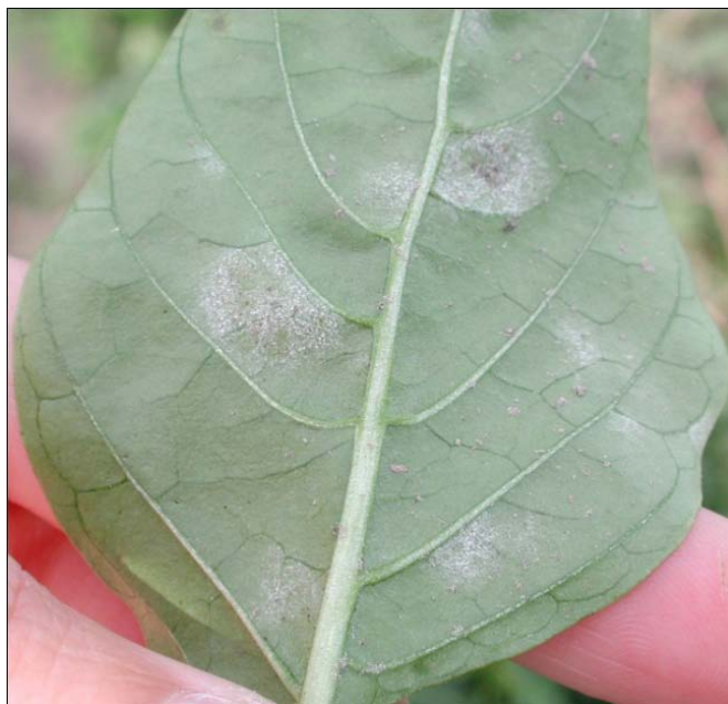
Slika1.Baršunasto bijela prevlaka na listu

sredina nekrotična (slika 2). Listovi žute i uvijaju se, zatim se potpuno ili djelomično osuše i otpadaju (Miličević, 2016.).