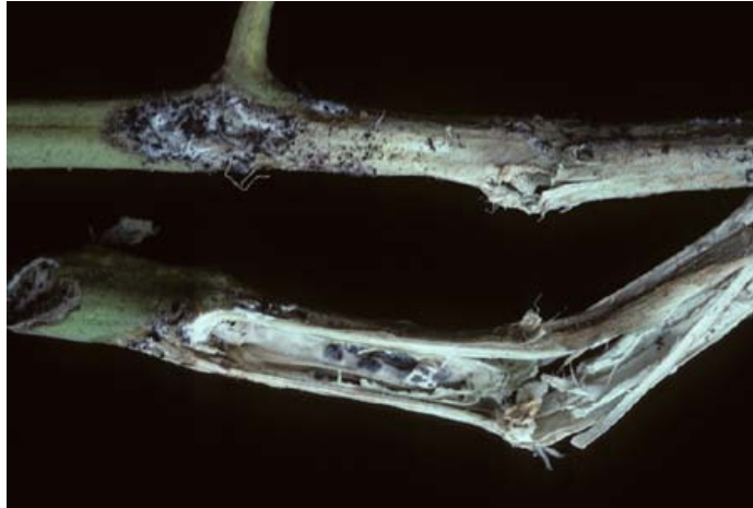
Slika 7. Simptomi bijele truleži na stabljici