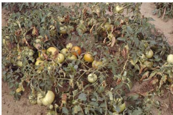
Slika 5. Venuće biljaka izazvano Verticillium dahliae