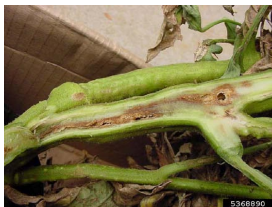
Slika 13. Simptomi na stabljici