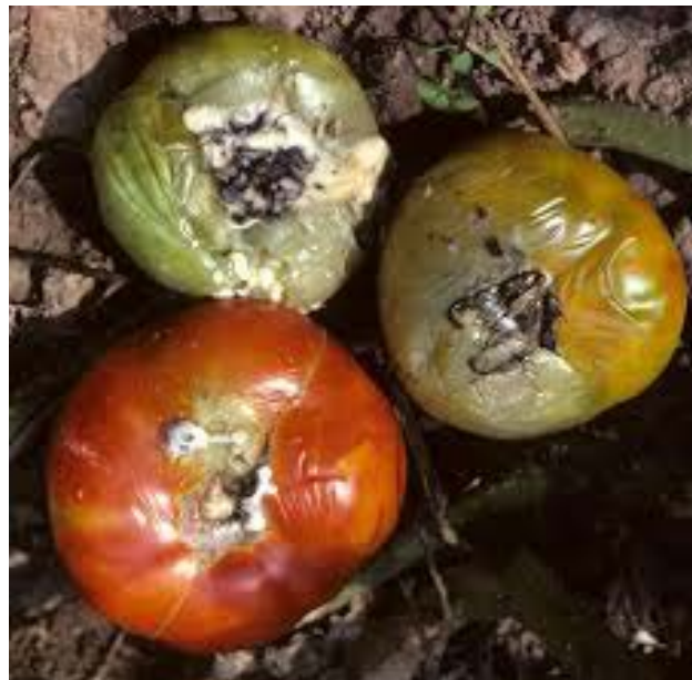
Slika 8. Trulež plodova