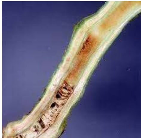
Slika 16. Nekroza provodnog tkiva stabljike