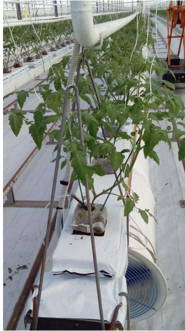
Slika 20. Sustav „kap po kap“