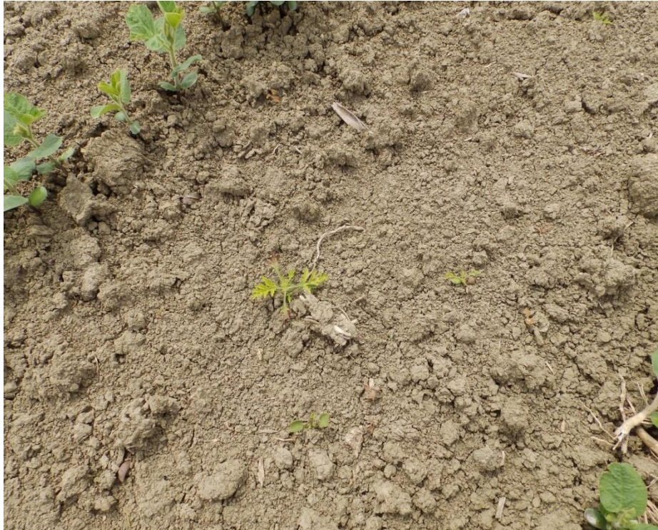
Slika 4. A. artemisifolia u usjevu soje, Cerna 2016.

Iz analize indikatorskih vrijednosti vrsta s obzirom na temperaturu (T) može se uočiti jednaka brojčana zastupljenost vrsta iz skupina T4 i T5. Ove skupine karakteriziraju vrste ( E. crus – galli , S. halepense ) rasprostranjene izvan izrazito kontinentalnih područja i vrste kojima imaju širok areal rasprostranjenosti u nižim područjima srednje Europe.