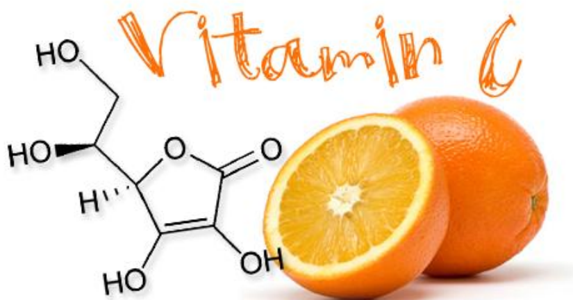
Slika 11. Vitamin C

Vitamin C (Slika 11.) se još naziva i askorbinska kiselina. Spoj se također upotrebljava za vrijeme eksplantacije i za sprječavanje zamračivanja. Osim toga, njegova uloga kao antioksidansa, askorbinska kiselina je uključena u podjelu stanica i produživanje, npr. u stanicama duhana kako je opisao De Pinto i sur. (1999.). Askorbinska kiselina ( 4 - 8 \times 10^{-4} M) također je pojačala formaciju mladog i starog duhanskog kalusa (Joy i sur., 1988.).