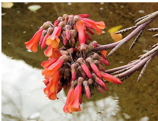
Slika 4. Biljka Bryophyllum tubiflorum L.