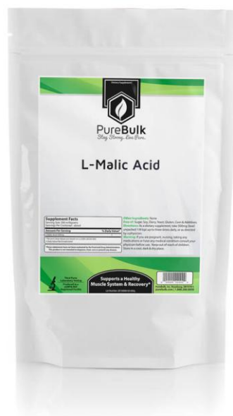
Slika 14. L – jabučna kiselina u pakiranju

Čini se da neke biljke dobivaju prehrambenu korist prisustvom jedne posebne organske kiseline. Murashige i Tucker (1969.) dokazali su da narančin sok dodan hranjivoj podlozi koji sadrži MS soli potiče rast kalusa agruma ( Citrus spp.). Jabučna i druge kiseline Krebsovog ciklusa također imaju slične efekte; od tih, limunska kiselina (Slika 13.) proizvodi najizraženije stimulacije rasta. Dodavanje L - jabučne kiseline (Slika 14.) u hranjivu podlogu (Savage i sur. 1979.) znatno se poboljšala stopa opstanka i snage malih kaktusa.