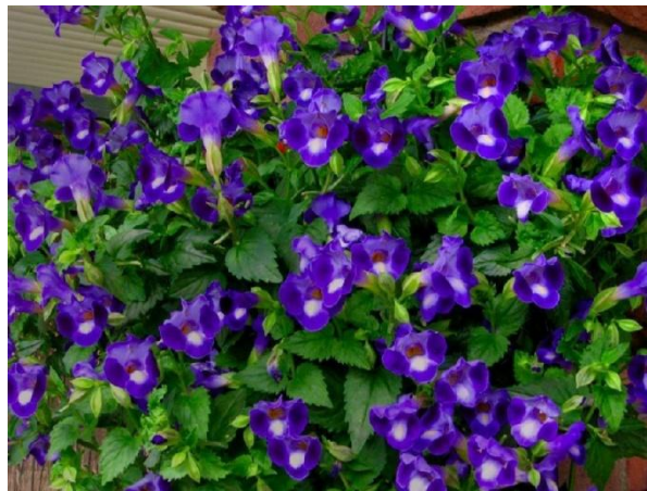
Slika 6. Torenija ( Torenia fournieri L.)

Nedostatak kalcija u biljkama rezultira slabim rastom korijena te tamnjenjem i uvijanjem rubova apikalnog lišća, često popraćeni prestankom rasta i odumiranjem vrha izbojka.