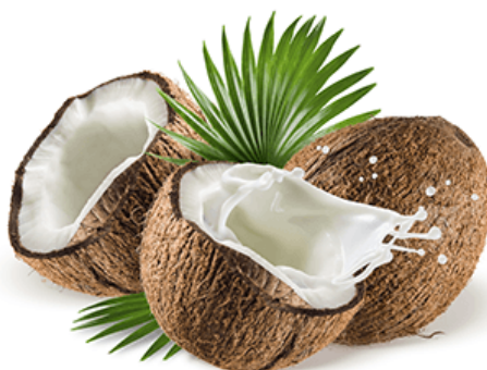
Slika 12. Kokos i kokosovo mlijeko

Kada se dodaju u hranjivu podlogu koji sadrži auksin, tekući endosperm ploda kokosove palme ( Cocos nucifera ) (Slika 12.) može potaknuti biljne stanice da se podijele i rastu brzo. Tekućina se najčešće naziva kokosovim mlijekom, iako Tulecke i sur. (1961.) tvrde da je točan engleski izraz „kokosova voda“. Van Overbeek i sur. (1941., 1942.) otkrili su da je dodavanje kokosovog mlijeka hranjivoj podlozi nužno za razvoj vrlo mladih embrija biljke bijelog kužnjaka ( Datura stramonium ). Burnet i Ibrahim (1973.) su utvrdili da je 20% kokosovog mlijeka (tj. jedna petina konačnog volumena podloge) bilo potrebno za inicijaciju i nastavak rasta tkiva raznih vrsta Citrus u hranjivoj podlozi MS. Rangan (1974.) je dobio poboljšani rast prosa ( Panicum miliaceum ) u MS hranjivoj podlozi korištenjem 2,4 - D u prisutnosti 15% kokosovog mlijeka. Međutim, dodavanje kokosovog mlijeka u hranjive podloge često daje jednostavan način za postizanje zadovoljavajućeg rasta ili morfogeneze bez potrebe za izradom odgovarajuće definirane formulacije.