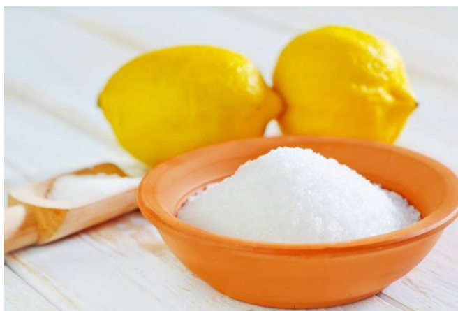
Slika 13. Limunska kiselina

Dodavanje organskih kiselina na hranjive podloge nije nedavna spoznaja. Mnogi autori su utvrdili da su neke organske kiseline i njihove natrijeve ili kalijeve soli stabiliziraju pH hidroponskih otopina (Trelease i Trelease, 1933.) ili in vitro hranjivih podloga (Van Overbeek i sur., 1941., 1942.; Arnou i sur., 1953.), iako se mora priznati da oni nisu učinkoviti kao sintetički biološki puferi. Norstog i Smith (1963.) otkrili su da 100 mg/L jabučne kiseline djeluje kao djelotvorno pufersko sredstvo u hranjivoj podlozi za kulture zrna ječma i također se čini da se poboljšava rast u prisutnosti glutamina i alanina.