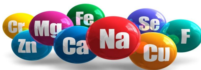
Slika 7. Mikroelementi

Zahtjevi biljaka prema mikroelementima razjašnjeni su tek u posljednjih 50 - 60 godina. Prije kraja prošlog stoljeća znalo se da nedostatak željeza uzrokuje pomanjkanje klorofila kod biljkama, no da bi se dokazala važnost ostalih elemenata bilo je potrebno mnogo godina istraživanja. U začetima istraživanja kulture biljnog tkiva postajala je nesigurnost vezana za esencijalnost pojedinih mikroelemenata. Mnoga tkiva su nesumnjivo uspješno uzgajana jer su kultivirana na hranjive podloge pripremljene od nečistih kemikalija ili ukrućene agarom koji je djelovao kao izvor mikroelemenata (George, 2008.).