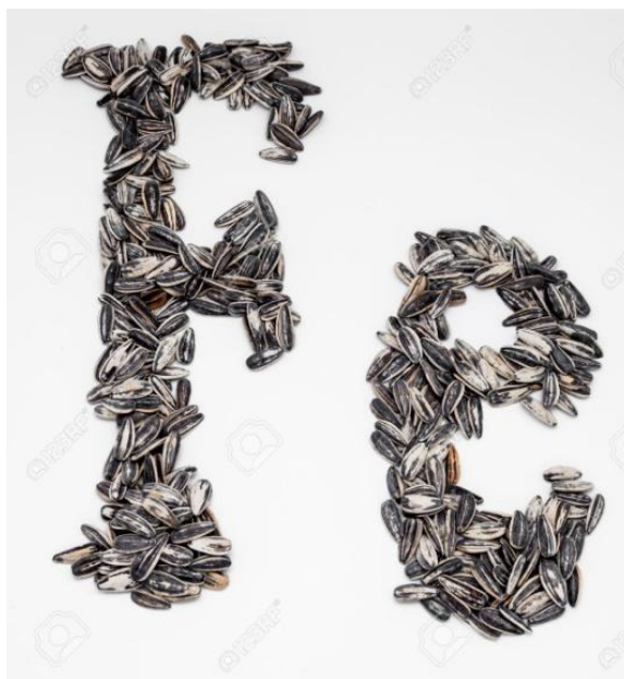
Slika 9. Simbol elementa željeza načinjen od sjemenki suncokreta