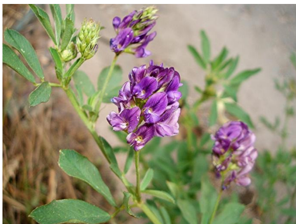
Slika 5. Lucerna ( Medicago sativa L.)