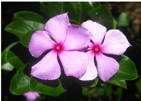
Slika 3. Madagaskarski zimzelen; Vinka ( Catharanthus roseus L.)

U tekućoj hranjivoj podlozi dalija usvoji fosfat gotovo u potpunosti za 2 tjedna. Nakon iskorištenja koncentracija fosfora u tkivu je normalna. Iskorištenje fosfata u ranoj fazi kulture ima veliki utjecaj na pH hranjive podloge u kojoj je fosfat ujedno i puferna komponenta (George, 2008.).