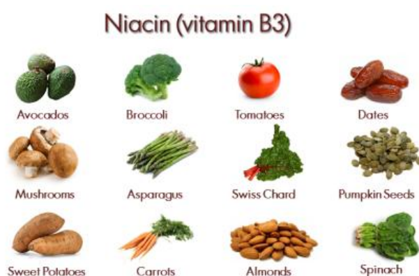
Slika 10. Niacin u biljkama

Vitamini su spojevi koji su potrebni životinjama u vrlo malim količinama kao nužni pomoćni hranjivi čimbenici. Odsutnost od prehrane dovodi do abnormalnog rasta i razvoja i nezdravog stanja. Mnoge od tvari također su potrebne biljnim stanicama kao bitni međuprodukti ili metabolički katalizatori, ali netaknute biljke, za razliku od životinja, mogu proizvesti same sve što je potrebno. Međutim, u nekim čimbenicima može doći do nedostatka kultiviranih biljnih stanica i tkiva, kao što su rast i preživljavanje te se zatim poboljšavaju njihovim dodavanjem u kulturu tkiva. U ranijem radu zahtjevi kultura tkiva za količinama tragova određenih organskih tvari zadovoljeni su "nedefiniranim" dodacima, kao što su voćni sokovi, kokosovo mlijeko, ekstrakti kvasca ili slada i hidrolizirani kazein. Ti dodaci mogu doprinijeti vitaminima, aminokiselinama i regulatorima rasta u kulturi tkiva. Korištenje neodređenih dodataka smanjilo se jer je definirana potreba za određenim organskim spojevima, a one su u katalozima bile navedene kao čiste kemikalije (George, 2008.).