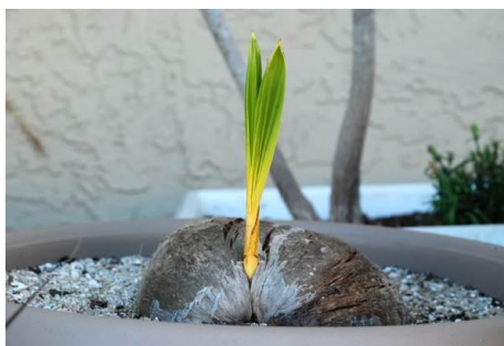
Slika 8. Kokosova palma

Eeuwens (1976.) je dodao 0,05 mM kalijeva jodida svojoj Y3 hranjivoj podlozi (deset puta veći sadržaj nego u Murashige i Skoog hranjivoj podlozi) te je spriječio tamnjenje kulture tkiva kokosove palme (Slika 8.). Prisutnost 0.06 \mu\text{M} kalijevog jodida malo je poboljšala opstanak i rast tkiva prunusa ( Prunus ) (Quoirin i Lepoivre, 1977.).