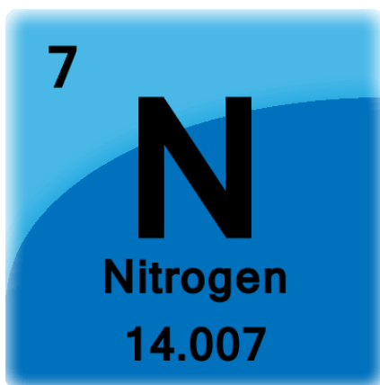
Slika 2. Dušik

Većina podloga sadrži više nitrata nego amonijevih iona, ali kako podloge kulture biljnih tkiva nisu uglavnom namjerno puferirane dodane koncentracije amonijačnih i nitratnih iona su ondje vjerojatno više radi praktične pH kontrole nego zbog potrebe biljnih tkiva za jednim ili drugim oblikom dušika. Usvajanje nitrata se efikasno događa jedino u kiselom pH, ali je praćeno izdvajanjem aniona iz biljke što vodi do postupnog smanjenja kiselosti podloge (George, 2008.).