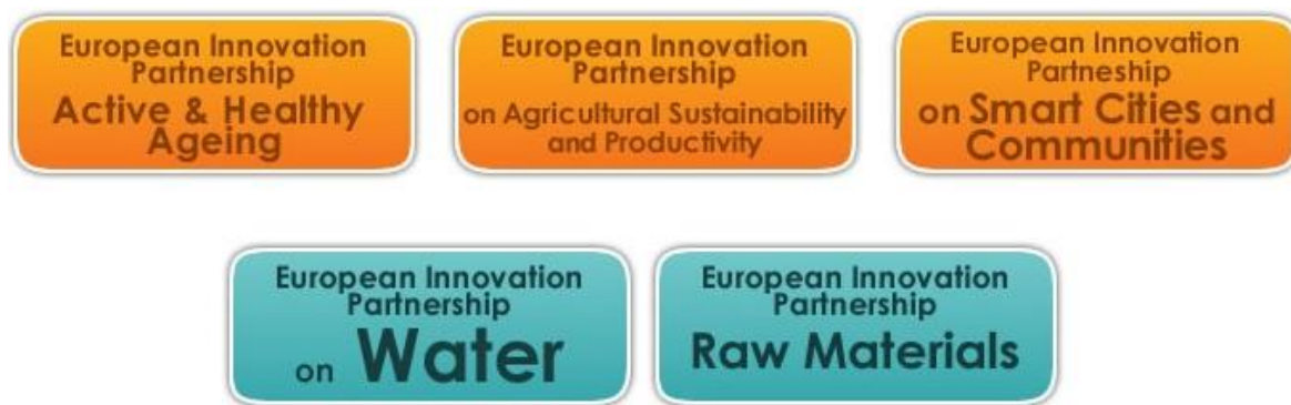
Slika 6. Područja djelovanja EIP AGRI partnerstva

Izvor: http://ec.europa.eu/eip/agriculture/