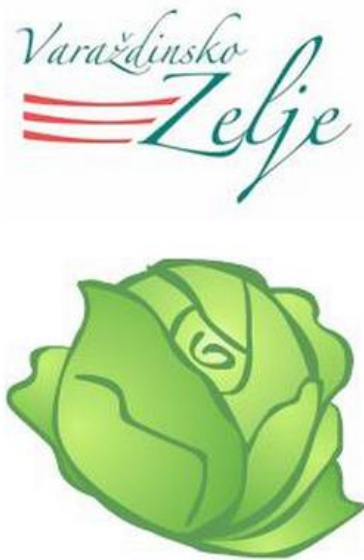
Slika 11. Logo Varaždinskog zelja koje proizvodi obitelj Cafuk

Izvor: http://www.savjetodavna.hr/savjeti/17/440/varazdinsko-zelje-na-eu-sortnoj-listi/