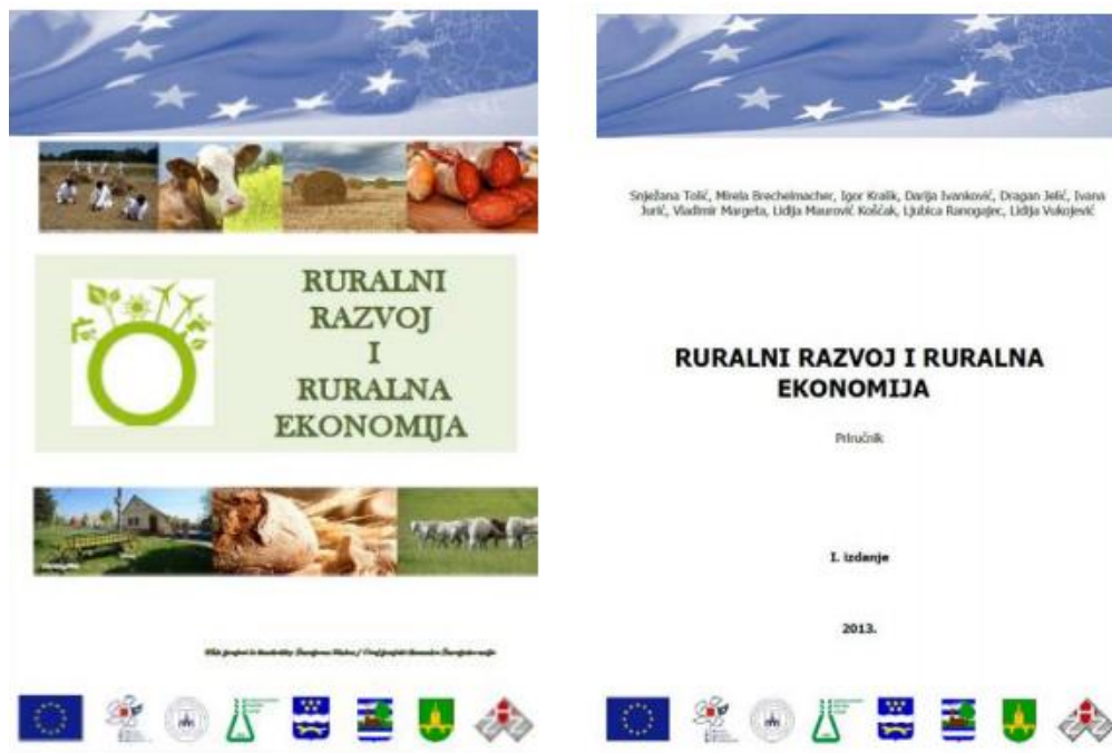
Slika 9. Naslovnica priručnika „Ruralni razvoj i ruralna ekonomija“