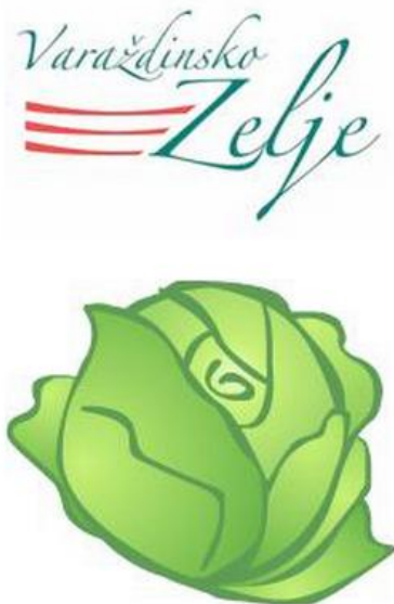
Slika 11. Logo Varaždinskog zelja koje proizvodi obitelj Cafuk

Izvor: http://www.savjetodavna.hr/savjeti/17/440/varazdinsko-zelje-na-eu-sortnoj-listi/