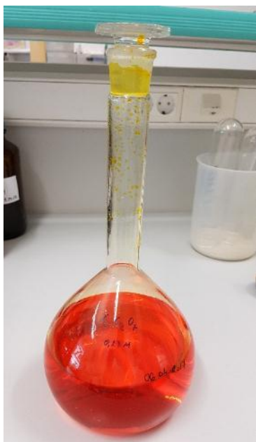
Slika 3. Otopina K-bikromata