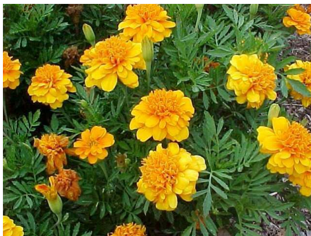
Slika 3. Tagetes patula L.

Često se naziva i Francuska kadifica te osvjetljava vrt svojim veselim nijansama žute, narančaste i crvene boje. Niska je biljka, rano cvjeta te ukrašava gredice, balkone i terase sve do kasne jeseni. Obilno cvate i na siromašnim tlima (Slika 3.) ( http://www.gardening.cornell.edu/homegardening/scene6cc9.html ).