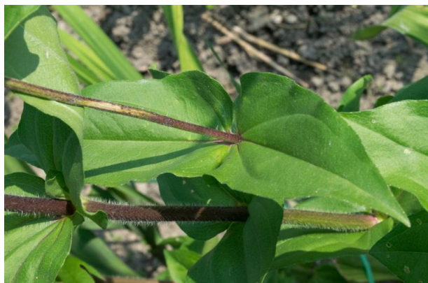
Slika 9. List Zinnia elegans