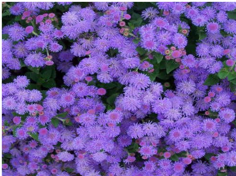
Slika 12. Ageratum hawaii

Jednogodišnja biljka koja stvara humak. Ima zašijeno jajolike listove i od ljeta do jeseni skupine perastih, četkastih, patselno modrih cvjetnih glavica. Visine je 20 – 30 cm (RHS, 2008.).