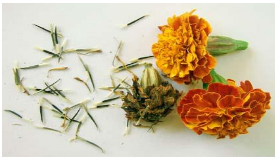
Slika 1: Plod i sjeme Tagetes L.