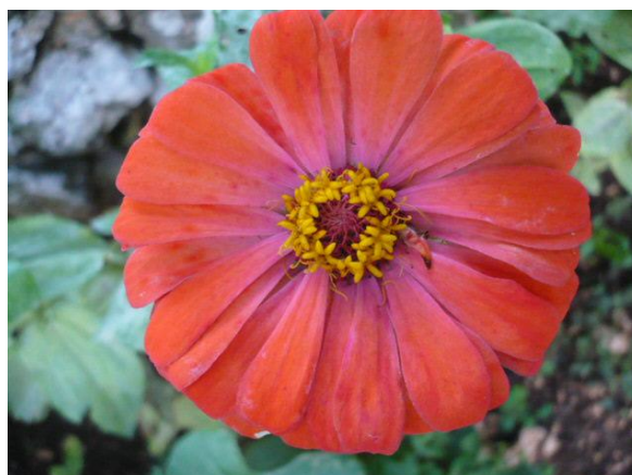
Slika 10. Cvijet Zinnia elegans