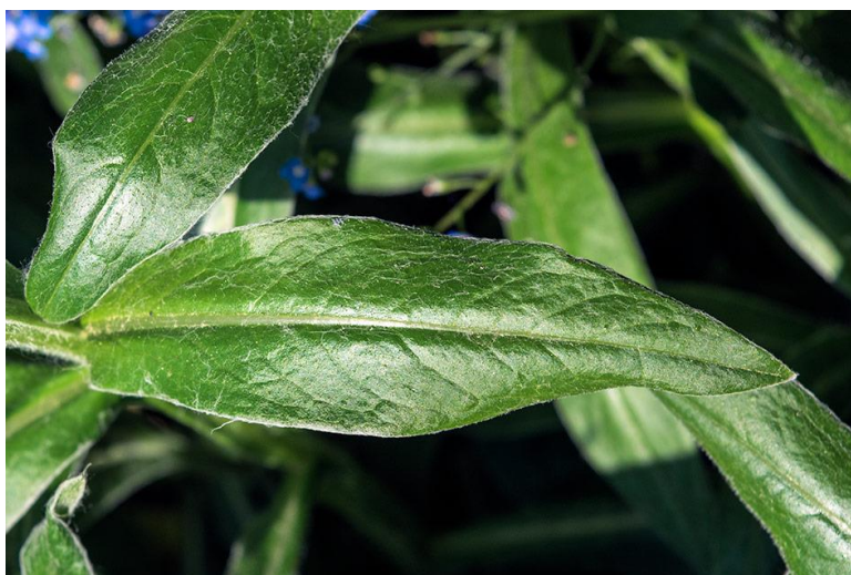
Slika 7. List Centaurea cyanus