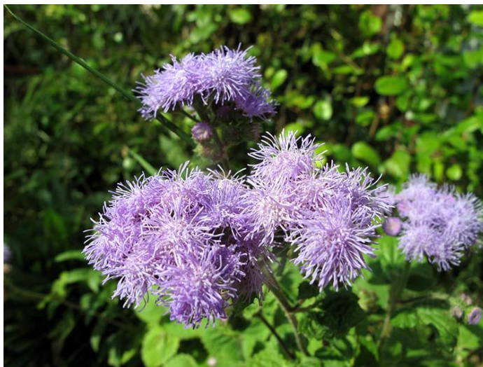
Slika 11. Ageratum houstonianum Mill.

Ima veliku popularnost jer cvjeta obilno i dugo, od svibnja pa do jeseni. Obavezno treba uklanjati uvele cvjetove kako bi se produžila cvatnja i zalijevati kada je suho vrijeme. Grmolikog je rasta i naraste do 30 centimetara (Hessayon, 1996.). Također, ima i sorti koje izrastu do 50 centimetara u obliku svilenkastih niti sljezovo-plave u pahuljastim glavicama koje se dugo drže svježim (Parađiković, 2014).