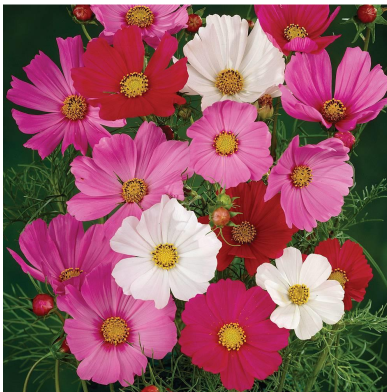
Slika 15. Cosmos bipinnatus 'Sensation Mixed'

Visine je 90cm. Ima rapsodiju boja od bijelih, ružičastih do crvenih cvatova. Koristi se za rezani za rezani cvijet (Hessayon, 1996.).