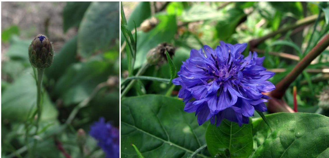
Slika 6. Cvijet Centaurea cyanus L.

ovoja trepavičasto-resasti, dugi oko 14 mm, a unutrašnji su duguljasti i često ljubičasti. Donji su listovi lancetasti ili linearni i sjedeći te sivozelene boje (Slika 7.). Roška je bijela, obrasla svilenim dlakama i ima crvenosmeđu kunadru. Sjemenke klijaju u jesen ili u proljeće. Biljka proizvede 700 – 1600 roški. Masa 1000 roški je 3,0 – 4,5 g (Knežević, 2006.). Vrijeme cvatnje je od lipnja do rujna (Šarić, 1989.).