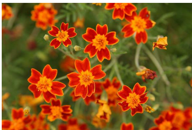
Slika 5. Tagetes tenuifolia L.

Mala niska kadifica koja naraste do 50 cm u visinu. Cvjetovi su u narančastoj, žutoj i crveno žutoj boji (Slika 5.) (Noordhuis, 1995.).