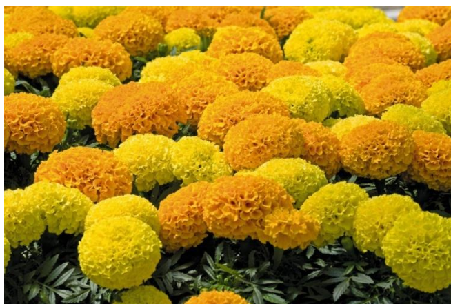
Slika 4. Tagetes erecta L.

Može narasti i do 1 m visine, a naziva se još i Američka ili Afrička kadifica. Također nosi i naziv velika kadifica jer se na kraju cvjetne stapke stvaraju veliki loptasti cvjetovi žute i narančaste boje te njihovih različitih nijansi (Slika 4.) ( http://www.missouribotanicalgarden.org/PlantFinder/PlantFinderDetails.aspx?kempercode=a609 ). Tagetes erecta L. dijeli se na visoke, poluisoke i niske sorte (Parađiković, 2014.).