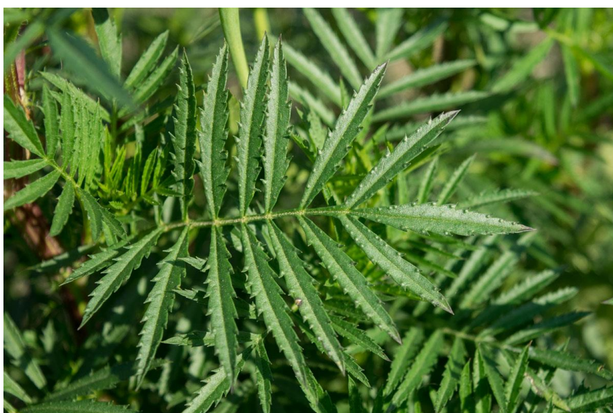
Slika 2: List Tagetes L.