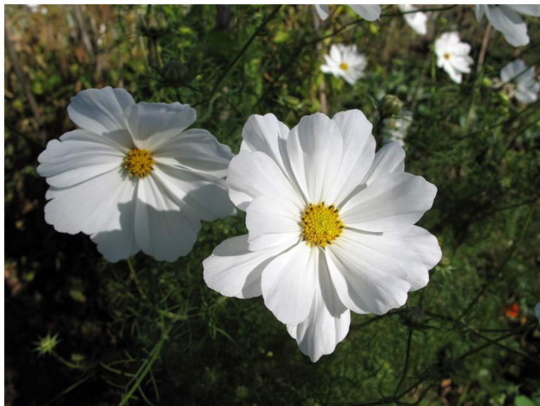
Slika 14. Cvijet Cosmos bipinnatus