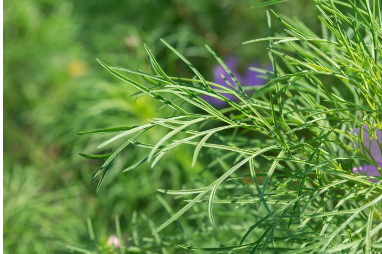
Slika 13. List Cosmos bipinnatus