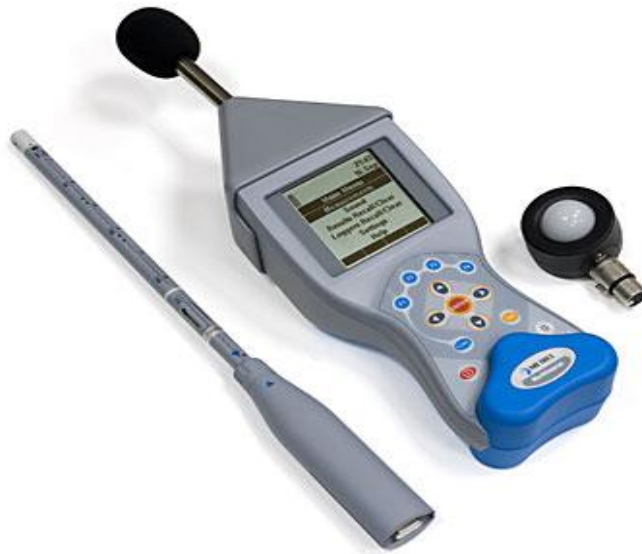
Slika 8. Uređaj proizvođača METREL tipa Multinorm MI 6201 EU

Prilikom istraživanja korišten je uređaj proizvođača METREL tipa Multinorm MI 6201 EU s pripadajućom zvučnom sondom (mikrofon klase B) istog proizvođača (slika 8.).