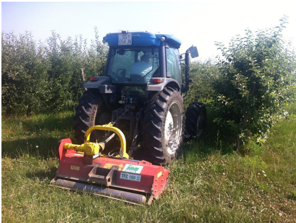
Slika 5. Malčer VOGER model TFZ 160 (Vlastiti izvor)

Malčiranje je način pripreme i obrade zemlje kojim se koriste prednosti velike količine organskog materijala koje možemo prikupiti, ili u svom dvorištu ili u susjedstvu. Korištenjem ovakvog materijala možemo stvoriti bogato i zdravo tlo za svoj vrt. Tijekom ovog mjerenja malčer se koristio u voćnjaku što prikazuje (slika 5.) (Izvor: Premakultura http://www.permakultura.hr/savjeti/51-malčiranje (22.5.2017.))