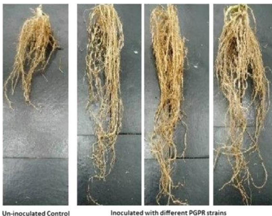
Slika 3. Utjecaj PGPR koje sadrže ACC deaminazu na rast korijena kukuruza u uvjetima salinitetnog stresa (Nadeem, 2013.)

Slično tome, prisutnost drugih svojstava kao što su indol-3- octena kiselina, proizvodnja siderofora, topivost fosfata, proizvodnja fitohormona povoljno djeluju na toleranciju stresa biljaka. proizvodnja antioksidativnih enzima štite biljku od štetnog utjecaja reaktivnih kisikovih radikala (Goswami, 2016.). Kao odgovor na stvaranje radikala biljka proizvodi antioksidativne enzime kao što su superoksid dismutaza, peroksid dismutaza, katalaza i glutathion reduktaza (Arora i sur., 2002.). Inokulacija s korisnim mikroorganizmima pojačava aktivnost ovih enzima i pomaže im smanjiti utjecaj stresa (Fu i sur., 2010.).