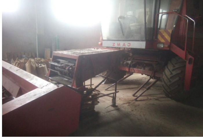
Slika 22. Priprema kombajna za žetvu

Emert i sur. 1995. navode da je prije početka rada potrebno izvršiti vizualnu kontrolu stroja te dotegnuti sve vijčane spojeve, a uočene deformacije ili oštećenja otkloniti. Sve prijenosnike pogona potrebno je prije početka rada provjeriti te ih po potrebi dotegnuti. Hederski stol ne smije biti oštećen, a uočene nedostatke potrebno je otkloniti. Tijekom rada potrebno je provjeriti letve bubnja te njezine vijke. Na podbubnju održavanje obuhvaća provjeru čistoće podbubnja. Vizualno kontrolirati odbojni biter, vizualno treba provjeriti slamotrese, te redovito provjeravati ležajeve na slamotresima. Sabirnu ravan potrebno je držati čistom, a gumene brtve na njoj moraju biti ispravne zbog manjeg rasipa. Provjeravati ispravnost svih spirala i svih prijenosa zrna. Mjere koje navode isti autori se provode na gospodarstvu.