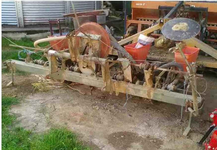
Slika 9. Sijačica PSK 4

regulatora pritiska. U zavisnosti od vremenskog perioda sjetve, obavlja se na dubini od 3-7 cm. Održavanje se sastoji od: podmazivanja svih rotirajućih dijelova litijevom masti Lis 2, podmazivanje pogonskih lanaca, po potrebi radi se skraćivanje lanca, izmjena plastičnih zubčanika ukoliko su napukli ili su se istrošili, podmazivanje pritiskajućih kotača i markira, kardana. Po potrebi radi se izmjena crijeva za protok zraka. Nakon sjetve slijedi čišćenje od zemlje, podmazivanje i garažiranje koje se obavlja u zatvorenom prostoru.