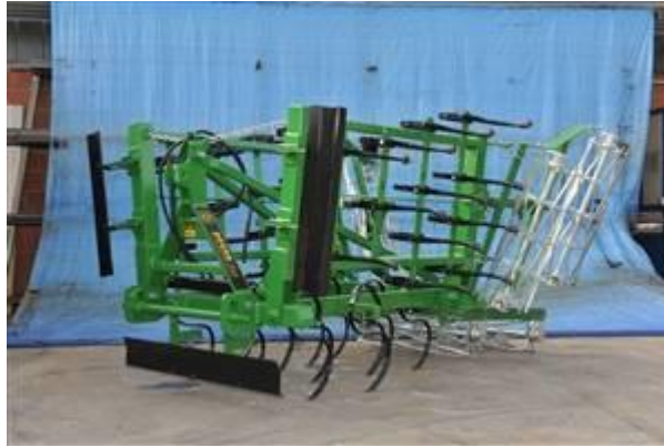
Slika 2. Sjetvospremač "PECKA"

Žetveni ostaci su se vrlo dobro zaorali pošto su prethodno usitnjeni i rašireni po površini tla. U proljeće kada se tlo prosušilo pristupilo se zatvaranju zimske brazde sjetvospremačem proizvođača "PECKA" zahvata 420 cm (Slika 2). Pred samu sjetvu na ovoj parceli su izvršili još jedan prohod sjetvospremačem i posijali suncokret.