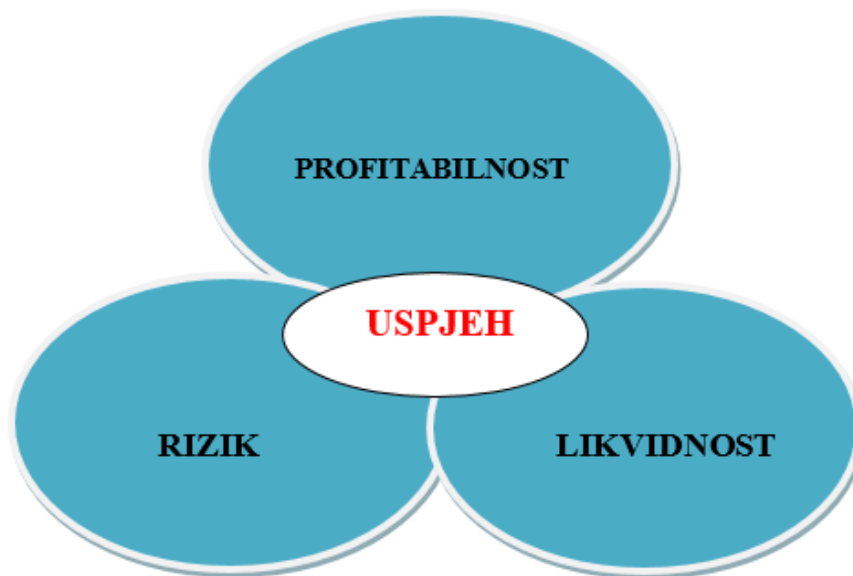
Slika 1. Financijski ciljevi poslovanja

Pri ostvarenju svojih ciljeva, poduzetnici poduzimaju financijske akcije, organiziraju poslovanje, ali nerijetko i riskiraju. Karić (2002.) napominje kako je jedna od najvažnijih svrha ekonomike gospodarskih subjekata zapravo istraživanje čimbenika uspješnosti poslovanja te kako je njihova svrha definiranje pravila čijom se primjenom nastoji poboljšati samo poslovanje koje obuhvaća utvrđivanje zakonitosti koje se isključivo odnose na ekonomski sustav gospodarskih subjekata.