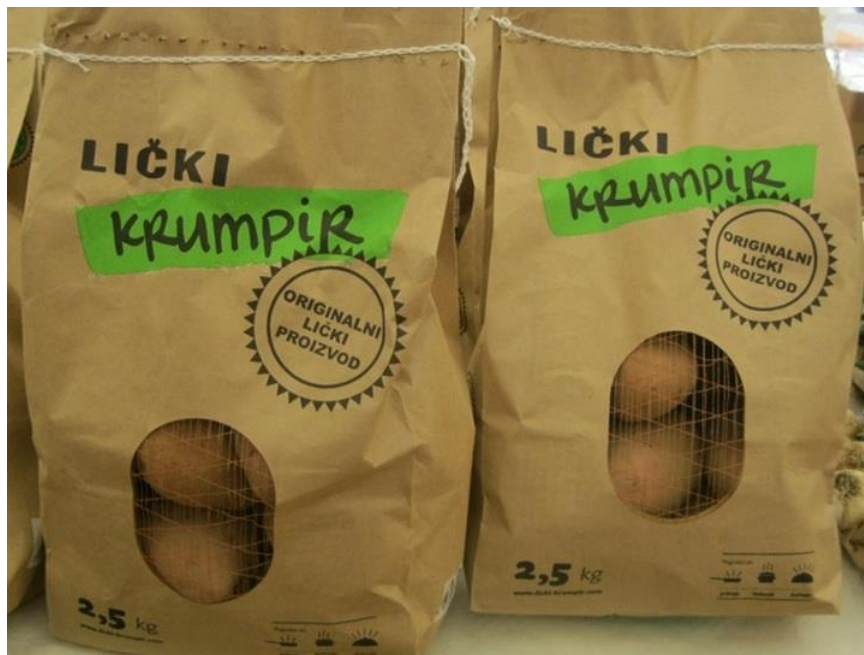
Slika 10. Lički krumpir ( http://alpedunavjadran.hrt.hr/emisija/13-11-2015/zasticen-kao-licki-krumpir/ )