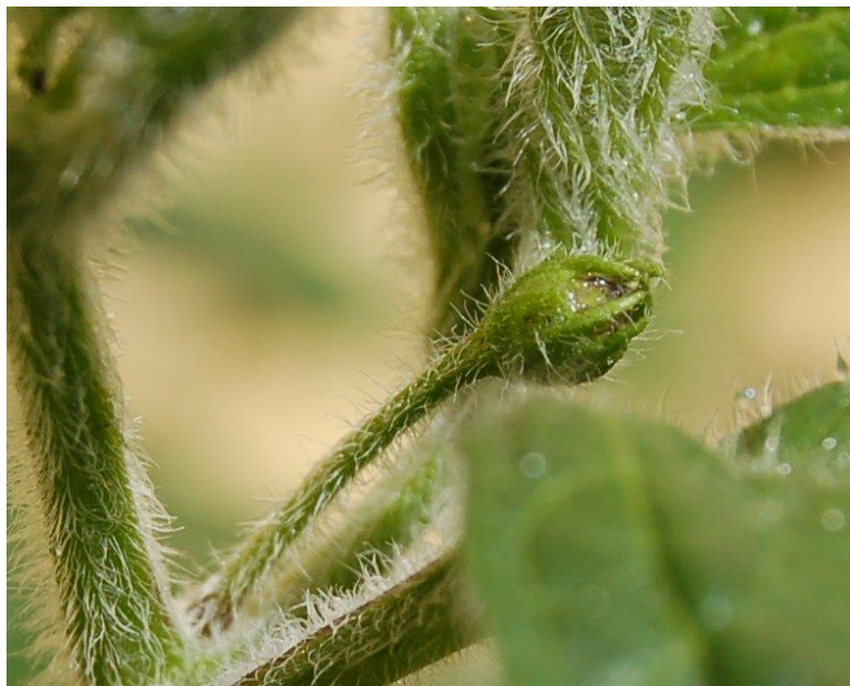
Slika 9. Biljka obrasla dlačicama ( https://bs.wikipedia.org/wiki/Trihom )

U ekološkoj proizvodnji preporuča se korištenje domaćih autohtonih sorti koje su najbolje prilagođene za dotično područje uzgoja. Pri izboru sorte (hibrida) vrlo važno je od šireg izbora prilikom kupovine na za to određenim mjestima, odabrati sortu koja je po svojim karakteristikama otporna na određene bolesti ili štetnike. Neke sorte su otpornije na štetočine, neke na bolesti, dok su druge osjetljive na napad istih. Primjerice, biljka koja ima više dlačica (Slika 9.), imati će manje oštećenja od sitnih štetnika nego na bijkama koje na svom lišću nemaju toliko razvijene dlačice; ili se razvojni stadij biljke ne poklapa sa vremenom intenzivnog napada štetnika i na taj način biljka je prividno otporna (Miličević, 2004.).