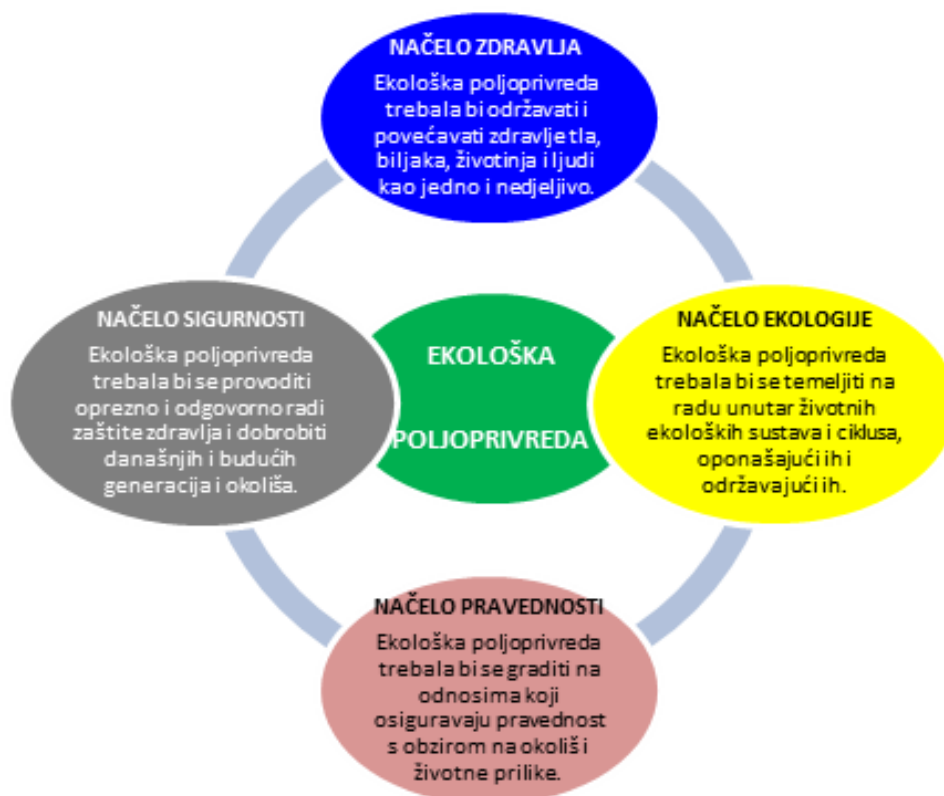
Slika 1. Načela ekološke poljoprivrede

Ekološka poljoprivreda predstavlja poljoprivredu koncipiranu tako da štiti tlo, vodu, zrak, biljne i animalne te genetske resurse, nije za okoliš degradirajuća, tehnički je primjerena, ekonomski opstojna, a socijalno prihvatljiva (Kisić, 2014.). Ekološki prihvatljive mjere zaštite bilja su mjere koje uz stručnu primjenu nisu opasne/štetne za ljude i korisne organizme, koje ne onečišćuju okoliš, koje minimalno narušavaju uspostavljenu ravnotežu organizama i što manje negativno djeluju na biološku raznolikost. Kada se govori o ekološki prihvatljivim mjerama, one se mogu razvrstati u dvije skupine- preventivne i kurativne mjere zaštite biljaka koje mogu biti provedene s dopuštenim sredstvima u ekološkoj poljoprivredi (Kisić, 2014.). 2004. godine na Glavnoj skupštini IFOAM-a (International Federation of Organic Agriculture Movements) usvojena su revidirana načela ekološke poljoprivrede (Slika 1.).