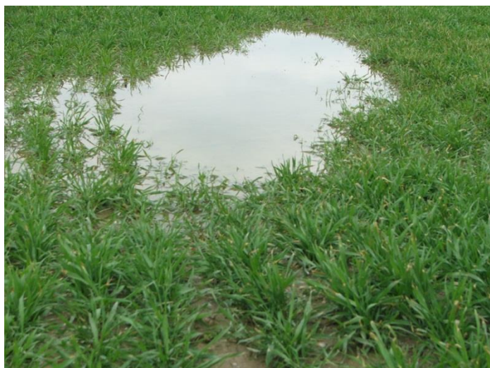
Slika 3. Tlo prezasićeno vodom ( http://www.savjetodavna.hr/vijesti/1/3577/sto-uciniti-na-oranicnim-povrsinama-prezasicenima-vodom/ )