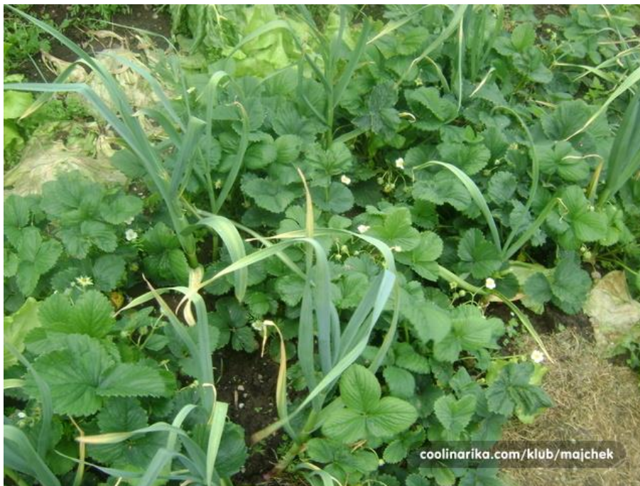
Slika 11. Češnjak između jagoda

Među biljkama zaštitnicima vrta najpoznatije su buhač, dragoljub, kadifica, neven, kopriva, hren, luk i češnjak. Posebno korisne ove će biljke biti ako ih uzgajamo u redovima, tik do redova povrća, nastojeći da niti jedna gredica ne bude pretrpana istom vrstom, već da miješanje bude pomalo nalik onom prirodnom. S toga upravo miješanjem biljaka postizemo prirodnu ravnotežu i tako djelujemo preventivno, stvarajući zdravu sredinu. Ako se hren posadi ispod trešnje, jabuke ili kruške sprječiti će pojavu gljivične bolesti monilije. Češnjak posađen između redova jagoda sprječava pojavu sive pljesni (Slika 11.) (Benyovsky Šoštarić, 2013.).