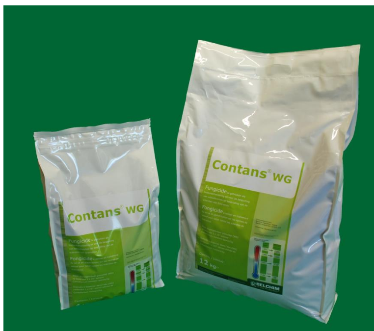
Slika 12. Preparat Contans ( http://195.98.196.121/en/distribution/belgien/ )