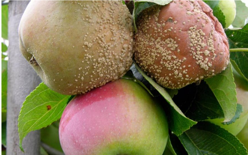
Slika 6. Trulež ploda jabuke ( http://pinova.hr/hr_HR/baza-znanja/vocarstvo/zastita-vocnjaka/zastita-jabuke/bolesti-jabuke/smeda-trulez-plodova-jabuke )