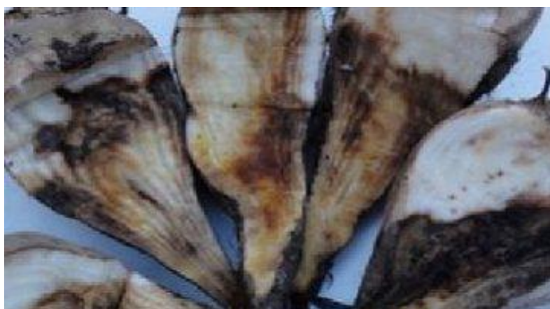
Slika 5. Nedostatak bora kod šećerne repe ( http://ratarstvo.net/tag/repa/ )

Svaki biogeni element, bio on osnovni (N, P, K, Ca, Mg i dr.) ili mikroelement (Cu, Br, Zn, Mn, Co, Fe i dr.) na specifičan način utječe kako na otpornost i osjetljivost biljke, tako i na razvoj bolesti. Na veću ili manju otpornost ne utječe samo količina gnojenja i u vezi s tim, opskrbljenost tla pojedinim i ukupnim hranjivima nego i specifični zahtjevi pojedinih kulturnih biljaka na određena i ukupna hranjiva u tlu, a i to u kojem i kakvom se stanju i obliku ona nalaze. Ima bolesti što se intenzivnije razvijaju na slabo ili slabije hranjivima opskrbljenim biljkama (Slika 5.) i obratno, koja se jače razvijaju na dobro i obilno opskrbljenim biljkama (Kišpatić, 1992.).