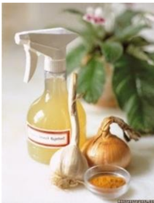
Slika 13. Preparat od luka i češnjaka ( http://my-garden-of-flowers.blogspot.hr/2015/04/nekoliko-prirodnih-preparata-za.html )

Preparat se pravi od 500 grama luka i češnjaka koji se stave u 10 litara vode. Gotovo gnojivo se, razrijeđeno u omjeru 1:10, polijeva po dnu gredica i ispod drveća. Ono povećava obrambene snage protiv gljivičnih oboljenja, prvenstveno kod krumpira i jagoda. Luk i češnjak mogu se koristiti pomiješani ili zasebno. Preparat od ljuske luka nastaje od 20-50 g ljuski i propalih dijelova luka koji se moraju močiti tijekom 4-7 dana u 1 litri vode. Tim gnojivom prskamo protiv grinja i gljivičnih bolesti kao što je plamenjača rajčice i krumpira. Juha od 75 g sjeckanog luka ili češnjeva češnjaka i 10 litara vode mora stajati najmanje 5 sati. Potom se nerazrijeđena može prskati po biljkama i tlu (Slika 13.). Pomaže protiv gljivičnih oboljenja. Kod svih preparata od luka i češnjaka odlučujuću ulogu vjerojatno ima visok sadržaj sumpora kao i antibiotskih tvari koje uništavaju klice.