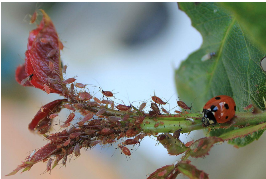
Slika 2. Bubamara kao prirodni neprijatelj lisnih ušiju

Biološka zaštita bilja sve se više koristi i u Hrvatskoj. U prirodi svaki živi organizam ima svog prirodnog neprijatelja – tzv. „Zakon prirode“ (Slika 2.). To osigurava ravnotežu u prirodi ili bi barem trebalo osigurati tu ravnotežu. Biološka zaštita pomaže da se odnos štetnika i prirodnog neprijatelja uravnoteži. Takve vrste zaštita se sastoje od uporabe prirodnih neprijatelja – predatora raznih štetnika. Biološka zaštita bilja je kompleksnija od kemijske, ali nudi prednosti u tome da je biološka zaštita ekološki prihvatljivija.