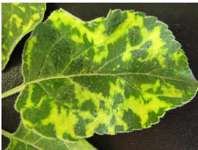
Slika 7. Mozaik jabuke ( http://agronomija.rs/2014/mozaik-jabuke/ )