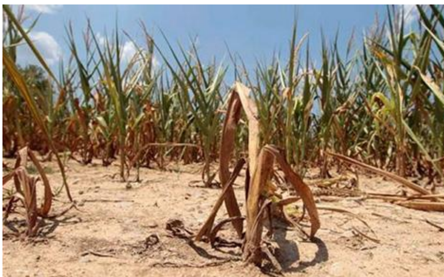
Slika 4. Posljedice suše ( http://www.sjemenarna.net/novosti-i-savjeti/novosti-i-savjeti/posledice-suse-na-poljoprivrednu-proizvodnju/ )