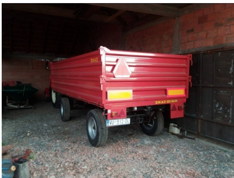
Slika 23. Garažiranje "ZMAJ"