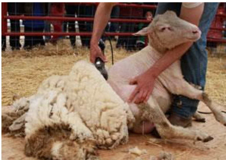
Slika 5. Šišanje ovce

Prvo razrađujemo plan šišanja gdje je potrebno razvrstati životinje po spolu, dobi i rasi, pripremiti životinje i odrediti načine šišanja. Zatim moramo odrediti vrijeme šišanja. Ovce i koze obično se šišaju jedanput godišnje u nekim zemljama i dva puta. Vuna šišana jedanput godišnje ima veću vrijednost na tržištu od one šišane dvaput. Šišanje se obično obavlja u ljetnim i proljetnim mjesecima, da se posao može što prije obaviti. Određivanje vremena šišanja bitno je i zbog proljetnog opadanja vune (linjanja), kako ne bi smo izgubili previše vune, što za posljedicu ima smanjene prinose. Uzročnik opadanja mogu biti i bolesti.