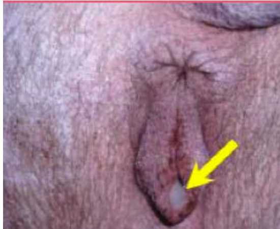
Slika 9. Iscjedak iz spolnog organa