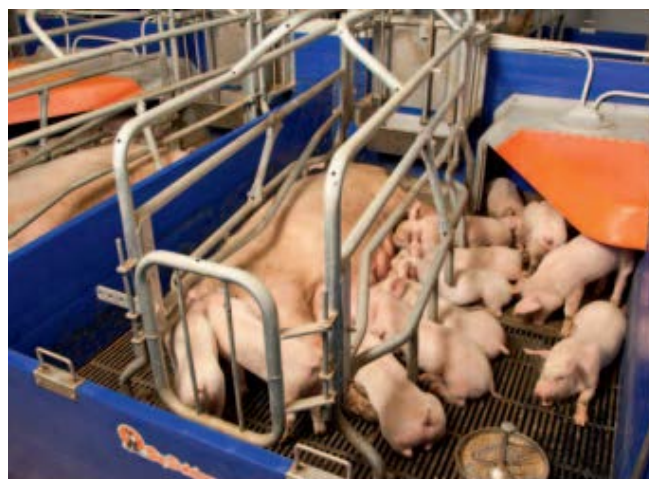
Slika 18. Klasični boks sa plastičnim rešetkastim podom i grijanim pokrovom za odojke

1. Klasični ili standardni boks – dužine su od 200 do 220 cm i širine 160 cm. Imaju dva dijela, u prvom je smještena krmača, a u drugom prasci. Prasci se slobodno kreću po cijelom boksu, a krmača je uklještena i boravi samo u srednjem dijelu boksa. Srednji dio napravljen je od metalnih cijevi koji imaju razmak od 20 cm. Hranilica i pojilica za krmaču su u prednjem dijelu boksa, a hranilica i pojilica za prasce su u postranom dijelu boksa.