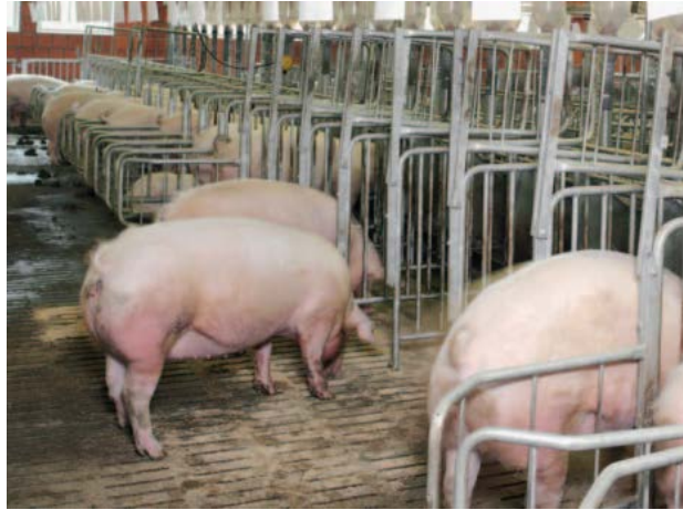
Slika 15. Grupno držanje sa pojedinačnim uklještanjem