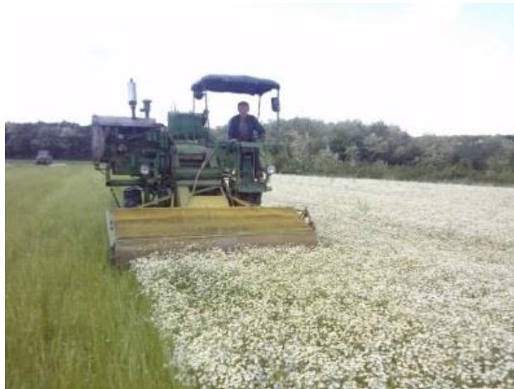
Slika 3. Berba kamilice

Njega usjeva u ekološko prihvatljivoj proizvodnji kamilice je delikatna. Zaštita kamilice se ne oslanja na samo jednu metodu već na zajedničko djelovanje više njih. Potreban je odabir kvalitetnog sjemena jer čistoća sjemena uvjetuje rast korova u usjevu. Pravilna obrada tla, oranje uništava korov prije sjetve. Pravilan plodored, smanjuje zakorovljenost te sprječava pojavu štetnika. Gnojidba dušikom u proljeće potiče rast kamilice u odnosu na korov.