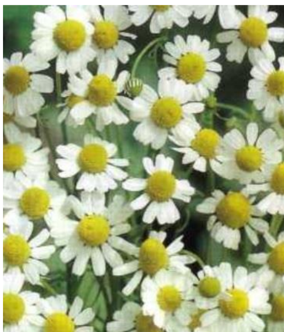
Slika 1. Izgled kamilice u cvatu

Matricaria chamomilla L. znanstveni je naziv za kamilicu. Rod Matricaria pripada porodici Asteraceae, glavočiike. Kamilica je jednogodišnja biljka raširena u cijelom svijetu, uspijeva na siromašnim i bogatim tlima. Od kamilice se koristi suhi cvijet ( Chamomilla flores ) i destilacijom izdvojeno eterično ulje ( Chamomilla aetheroleum ). Od cvijeta kamilice prave se čajevi, kupelji i tinkture. Upotreba kamilice (djeluje protiv svih vrsta upala) ima dugu tradiciju, te su ljudi bolje upoznati s ljekovitim svojstvima kamilice u usporedbi s drugim ljekovitim biljem (Parađiković, 2014.).