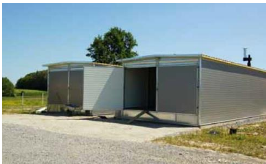
Slika 4. Suvremene sušare za ljekovito bilje