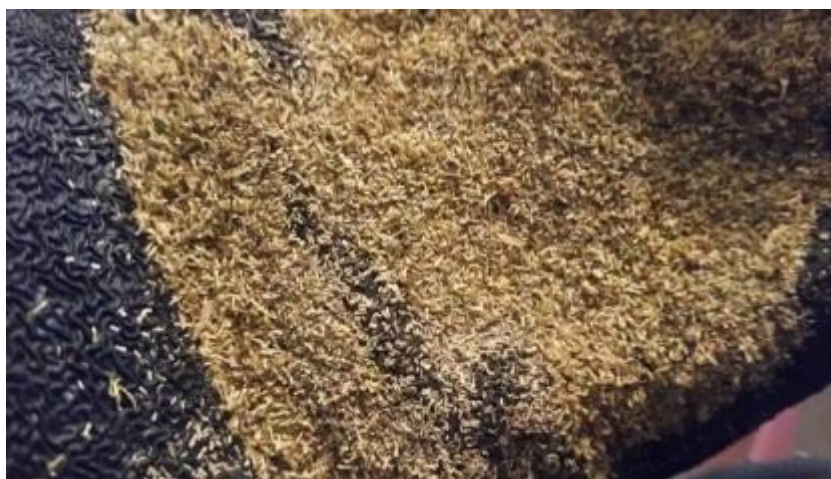
Slika 2. Sjeme kamilice

Pripremu tla za proizvodnju kamilice treba obaviti krajem kolovoza do sredine rujna. Nakon žetve pretkulture prvo se obavlja prašenje strništa kako bi se smanjio gubitak vlage i kako bi se potaknuo rast korova. Oranje se obavlja na dubinu do 25 centimetara, a može se i iskoristiti produženo djelovanje dubokog oranja pretkulture, pa umjesto oranja obaviti tanjuranje na 10 do 20 centimetara dubine. Oranje ili tanjuranje omogućuje kasnije ukorjenjivanje kamilici, te uništava iznikle korove mehaničkom mjerom koja se smatra zdravijom od kemijske (herbicidima). Zatvaranje brazde i priprema sjetvenog sloja obavlja se odmah nakon oranja kako se zemlja ne bi isušila i zgrudala. Prije sjetve treba izvaljati površinu u dva do tri prohoda, ovisno o tipu i strukturi tla, dok se ne dobije ravna i zbijena površina (savjetodavna.hr 2017.).