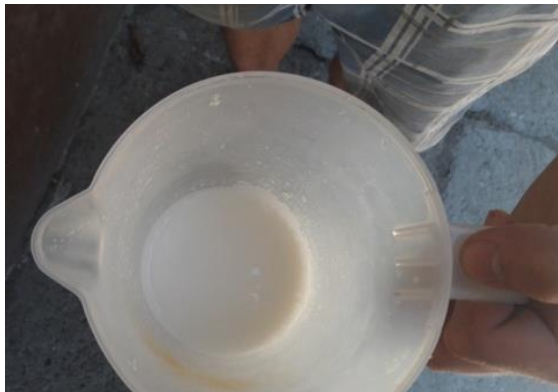
Slika 1. Žućkasto bijela boja svježe izmuzenog kobiljem mlijeka

Od fizikalnih svojstava najviše se izdvajaju točka ledišta, boja, kiselost i energijska vrijednost. Točka ledišta kobiljeg mlijeka je nešto niža od one kod kravljeg mlijeka. Kod kobiljeg mlijeka se ona kreće od -0,532^{\circ}\text{C} (Čagalj i sur., 2014.) pa sve do -0,554^{\circ}\text{C} (Pagliarini i sur., 1993.). Na točku ledišta može utjecati kemijski sastav mlijeka, kao i neke čimbenici poput: vrste mužnje, skladištenja mlijeka, ostatak vode nakon pranja i dr. (Casali i sur., 1998.; Slauchis, 2001.). Kiselost mlijeka se može mjeriti titracijskom kiselošću ( ^{\circ}\text{SH} ) ili ionometrijskom kiselošću (pH). ^{\circ}\text{SH} je dosta varijabilna kod kobiljeg mlijeka, te se kreće od 1,35-3,62 ^{\circ}\text{SH} (Čagalj i sur., 2014.). Što se tiče pH vrijednosti, tu su manje varijacije, te se mlijeko kreće od 6,9-7,2 pH (Čagalj i sur., 2014.). Energijska vrijednost kod kopitara pa samim time i kod kobiljeg mlijeka je manja od ostalih sisavaca. Ta vrijednost se kreće u rasponu od 1.936-2050 kJ/L. Mlijeko kobila je žućkato bijele boje, za što je najviše odgovoran \beta -karoten. Mlijeko je slatkastog okusa te gušće konzistencije o kravljeg.