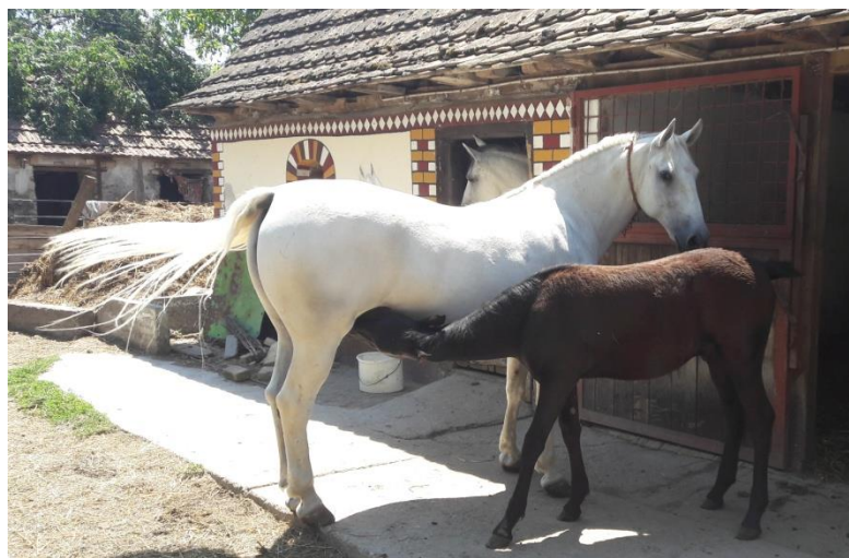
Slika 3. Ždrijebe od četiri mjeseca siše majku

(TM) proizvede 2,5-3 kg mlijeka tijekom laktacije (Doreau i Martin Rosset, 2002.; Salimei, 2011.). Nakon ove faze slijedi suhostaj koji traje jedan do dva mjeseca, a koji je neophodan ukoliko želimo kobilu pravovremeno pripremiti za naredni graviditet, laktaciju i razvoj ždrijebeta. Ne preporuča se trajanje suhostaja kraće od jednog mjeseca jer je izgledna pojava problema u reprodukciji i narednoj laktaciji (Alatrović i sur., 2017.). U praksi se najviše koriste hladnokrvne pasmine kobila za ovaj tip proizvodnje, jer kao što je ranije spomenuto možemo pomesti veće količine mlijeka, a i ždrijebe je veće tjelesne mase te ga se može koristiti u tovu, odnosno za proizvodnju mesa. Da bi ždrijebe neometano raslo, tj. napredovalo ne preporuča se da se od kobile izmuze više od jedne trećine ukupno proizvedenog mlijeka.