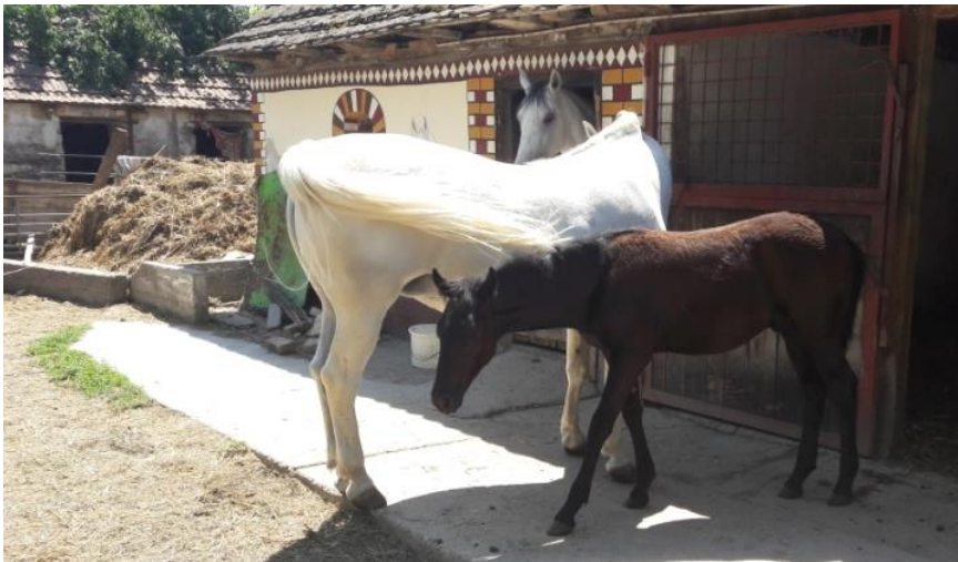
Slika 7. Pridruživanje pomlatka kobilama nakon mužnje

Zbog intenzivnog rasta i razvoja ždrebadi bitno je pružiti im mogućnosti da sišu. U ovakvoj proizvodnji ždrebadi ima priliku najviše konzumirati mlijeko tokom noći, kada s ne odvija mužnja. Kvalitetnom tehnologijom proizvodnje ne bi trebali utjecati na konačan prirast ždrebeta.