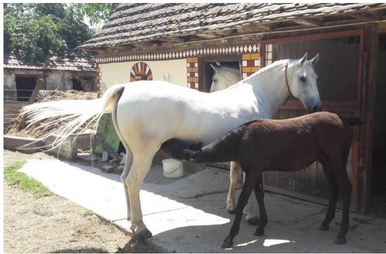
Slika 3. Ždrijebe od četiri mjeseca siše majku

(TM) proizvede 2,5-3 kg mlijeka tijekom laktacije (Doreau i Martin Rosset, 2002.; Salimei, 2011.). Nakon ove faze slijedi suhostaj koji traje jedan do dva mjeseca, a koji je neophodan ukoliko želimo kobilu pravovremeno pripremiti za naredni graviditet, laktaciju i razvoj ždrijebeta. Ne preporuča se trajanje suhostaja kraće od jednog mjeseca jer je izgledna pojava problema u reprodukciji i narednoj laktaciji (Alatrović i sur., 2017.). U praksi se najviše koriste hladnokrvne pasmine kobila za ovaj tip proizvodnje, jer kao što je ranije spomenuto možemo pomesti veće količine mlijeka, a i ždrijebe je veće tjelesne mase te ga se može koristiti u tovu, odnosno za proizvodnju mesa. Da bi ždrijebe neometano raslo, tj. napredovalo ne preporuča se da se od kobile izmuže više od jedne trećine ukupno proizvedenog mlijeka.