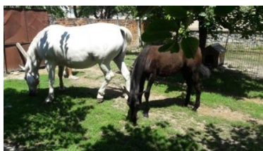
Slika 9. Kobila i ždrijebe uživaju u ispaši

Što se ždrebadi tiče, njihova prva hrana je kolostrum. Vrlo je važno da ga što ranije posišu u što većim količinama da bi apsorbirali što više imunoglobulina u svoj organizam. Ona već nakon tjedan dana kreću sa prvom konzumacijom suhe hrane. Iako tek poslije 4 mjeseca starosti mogu biti na suhoj hrani, ne preporuča se odbiće prije 6 mjeseci starosti. Najbolje bi bilo za ždrijebe da ima stalan izvor koncentrata i voluminoze uz majčino mlijeko, te da uzima po volji krutu hranu. To je dosta bitno jer samo mlijeko kobile dosta brzo prestaje biti dovoljna hrana za ždrijebe. U četvrtom mjesecu života ždrijebe bi trebalo konzumirati oko 1 kg krute hrane uz majčino mlijeko. Bitno je da ždrijebe ima dostatne količine što raznovrsnije hrane da bi što bolje razvilo mišiće i kosti (paša bi bila idealna, zbog kretanja i raspoložive hrane) jer ukoliko „zakrčlja“ u početku razvoja to se više nikada ne može ispraviti. Koliko je bitna ishrana govori i činjenica da bi ždrijebe sa 6-7 mjeseci starosti trebalo biti 40-50% težine odraslog konja. Nakon zalučenja ždrebadi ona jedu koncentrate i voluminozu i korištenje paše ukoliko je moguće. Sol i voda im također uvijek moraju biti na raspolaganju.