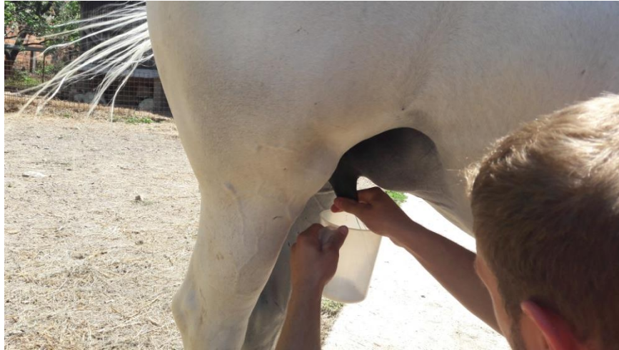
Slika 5. Ručna mužnja kobile

Prije mužnje, tijekom mužnje i po završetku mužnje treba kontrolirati vime i ukoliko vidimo neke nepravilnosti i oštećenja pravodobno i adekvatno reagirati.