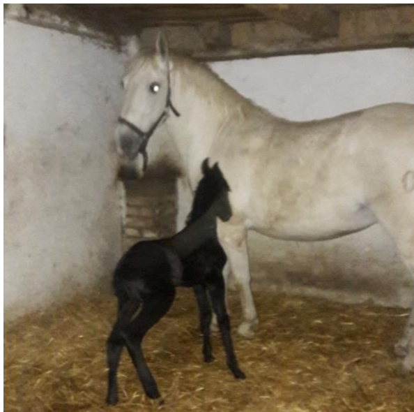
Slika 4. Majka i ždrijebe par sati nakon ždrijebljenja

slučajevima i do godinu dana, ovisno o genetici kobile, ali i spolu ždrebeta kao i brzini sazrijevanja ploda. Postoje dvije faze sazrijevanja ploda, embionalna koja traje prvih 35 dana, i fetalna koja traje skroz do oždrebljenja. Alatrović i sur. (2017.) navode da neposredno pred porod, mliječna žlijezda (vime) se povećava i počinje lučenje kolostruma koji se nakuplja u obliku kapljica na otvorima vrhova sisa,. Porod (partus) označava fiziološki završetak gravidnosti koji se sastoji od tri faze: faze otvaranja (traje od 2 do 4 sata, kod ždrebica i do 6 sati), faze istiskivanja ploda (traje 5-30 minuta) te faze istiskivanja posteljice (2-3 sata nakon poroda posteljica treba biti istisnuta; Makek i sur., 2009.).