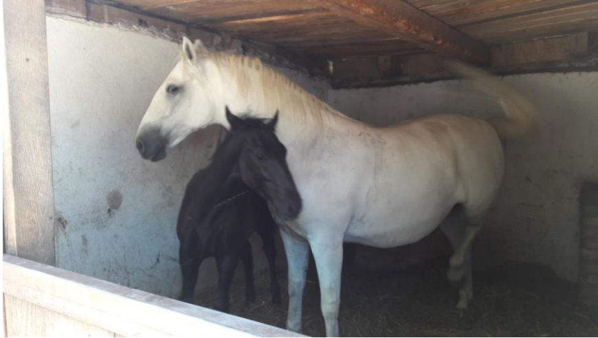
Slika 8. Kobila i ždrijebe u boksu adekvatne veličine