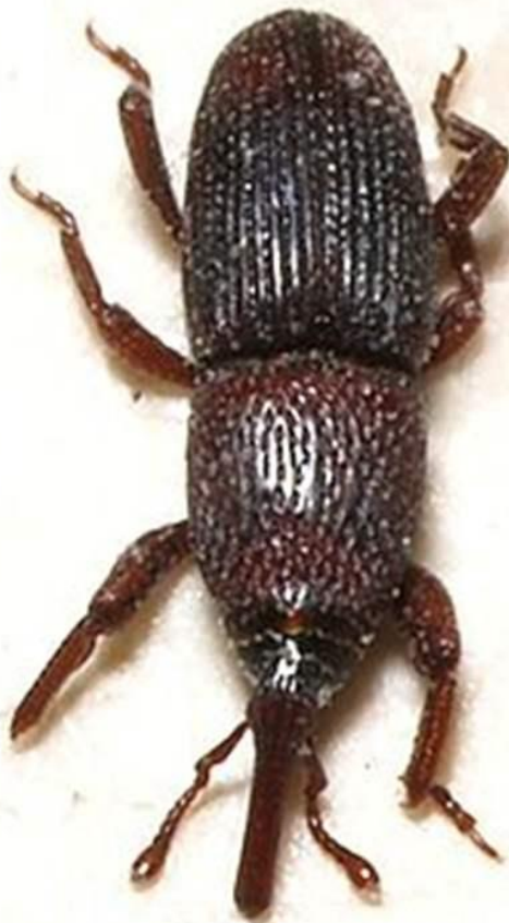
Slika 5. Imago žitnog žiška Sitophilus granarius L.

http://keys.lucidcentral.org/keys/v3/eafrinet/maize_pests/key/maize_pests/Media/Html/images/Sitophilus_granarius_(Linnaeus_1875)_-Granary_Weevil/Sitophilus_granarius.jpg