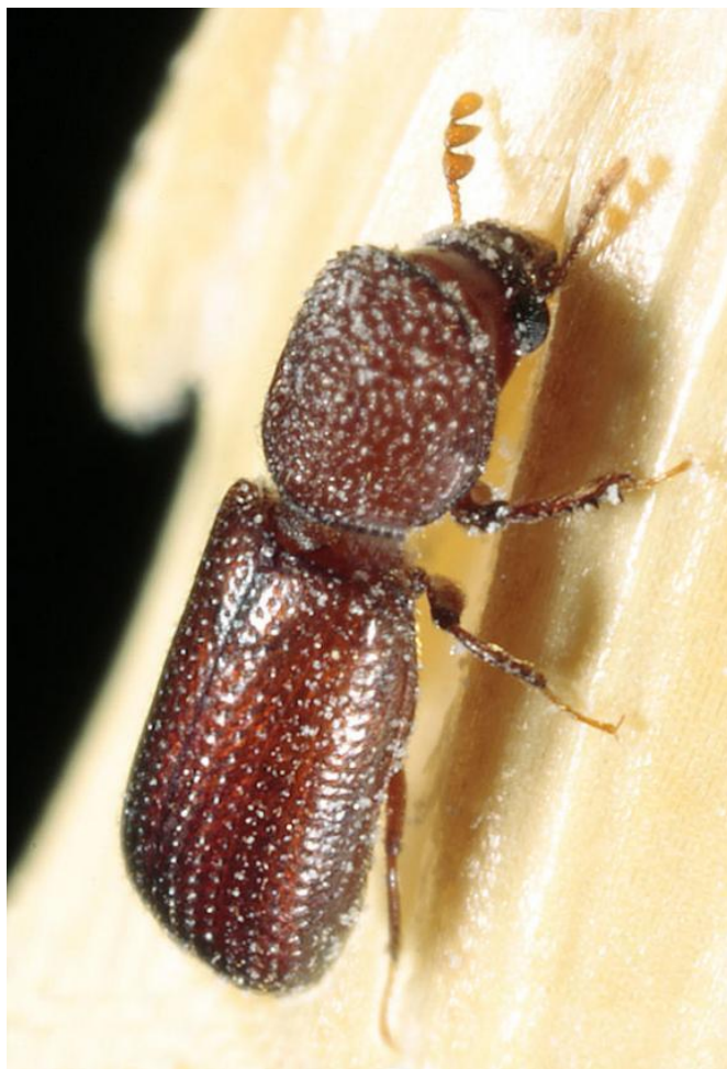
Slika 7. Imago žitnog kukuljičara - Rhyzopertha dominica F.

Ima svojstveno građeni vratni štit koji pokriva glavu u prognantnom položaju. Dužina tijela imaga iznosi 2,3-3,0 mm, valjkastog oblika, boja je tamnosmeđa do hrđasta (Slika 7.). Zadnjih nekoliko godina značajan je porast broja ovog štetnika. Ima krila, te letenje omogućuje brzu zarazu. Ličinka je bijele boje, blago je zakrivljena i tijelo joj je pokriveno dlačicama. U jednom zrnju može biti više ličinki. Hrane se endospermom te ga izgrizaju sve do ljuske. U našim uvjetima ovaj štetnik ima 2 generacije godišnje, za rast i razvoj potrebne su temperature iznad 30 °C. Može oštetiti toliko zrnje da za 20-30 dana ostane samo tanka ljuska zrna.