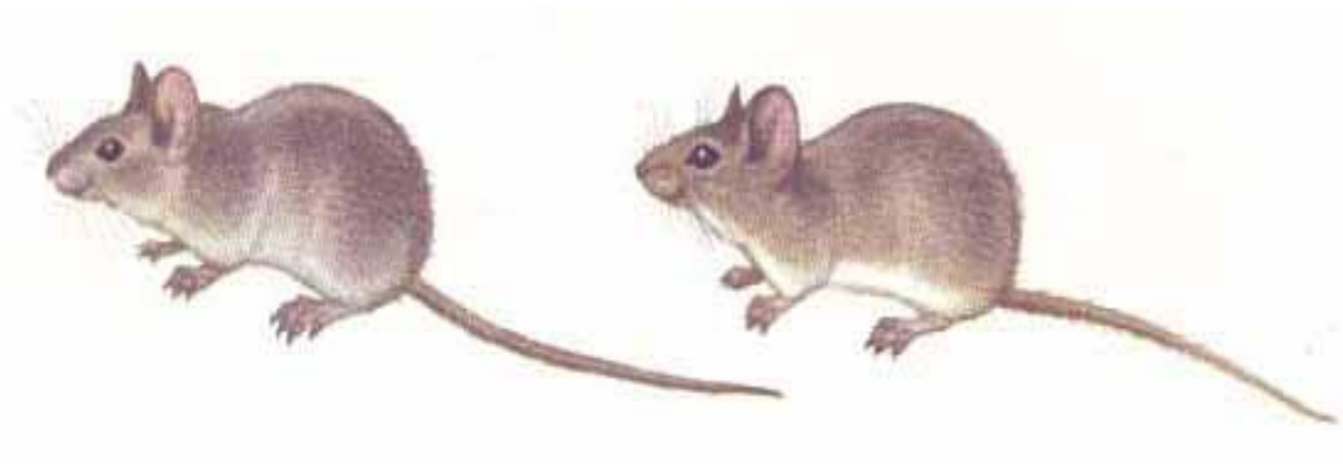
Slika 4. Mus musculus Linnaeus – domaći miš

http://www.agroatlas.ru/content/pests/Mus_musculus/Mus_musculus.jpg