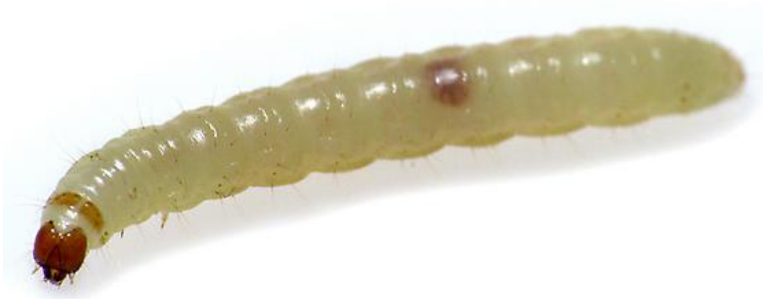
Slika 3. Gusjenica bakrenastog moljca Plodia interpunctella Hbn.

http://bugguide.net/images/cache/T0P/QA0/T0PQA02Q300K1KMKCK5KNK0KCK0KW K8KRSNQY07KRS9QTK5KOKUQAKIKJ0BQTK4KHSABKXKY09QVK9QVKZKV K1QZS.jpg