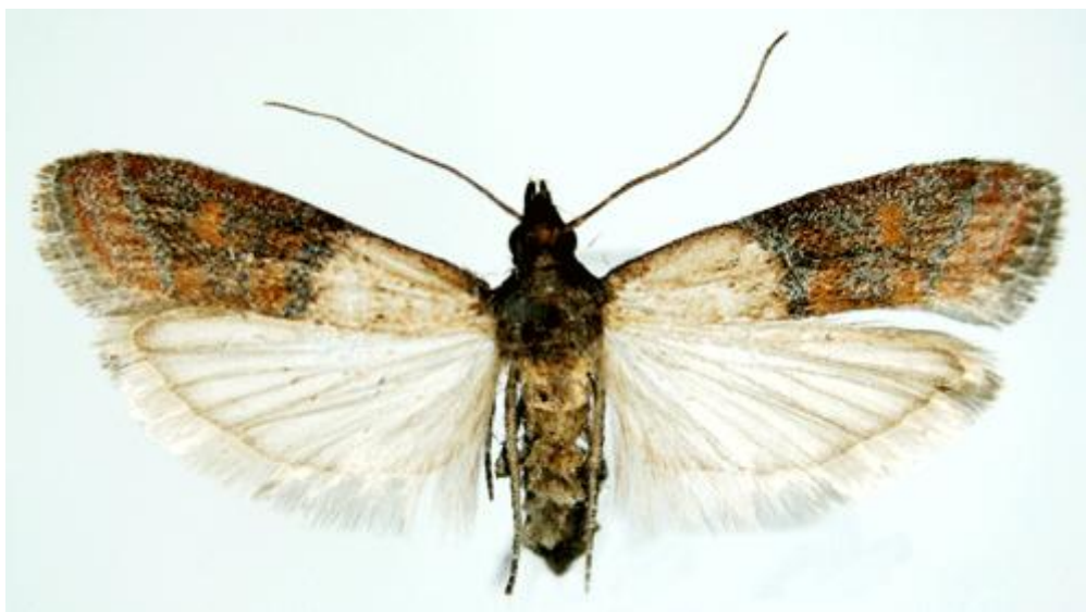
Slika 2. Imago bakrenastog moljca Plodia interpunctella Hbn.

Bakrenasti moljac ima skoro dvije trećine prednjeg para krila izrazito bakrenaste boje (Slika 2.), iako ponekad bakrenasta boja može biti u svjetlijoj ili tamnijoj nijansi. Dužine tijela je do 10 mm, najčešće 7-9 mm, a raspon krila kreće se oko 15-18 mm. Boja gusjenice kreće se od bijelo-žućkaste do prljavo-sive sa crnim dlakama i točkama na tijelu (Slika 3.). Glava je tamnije boje od tijela. Ženka ovoga štetnika odlaže jaja na temperaturama 14-32 °C i može ih položiti 60-400.