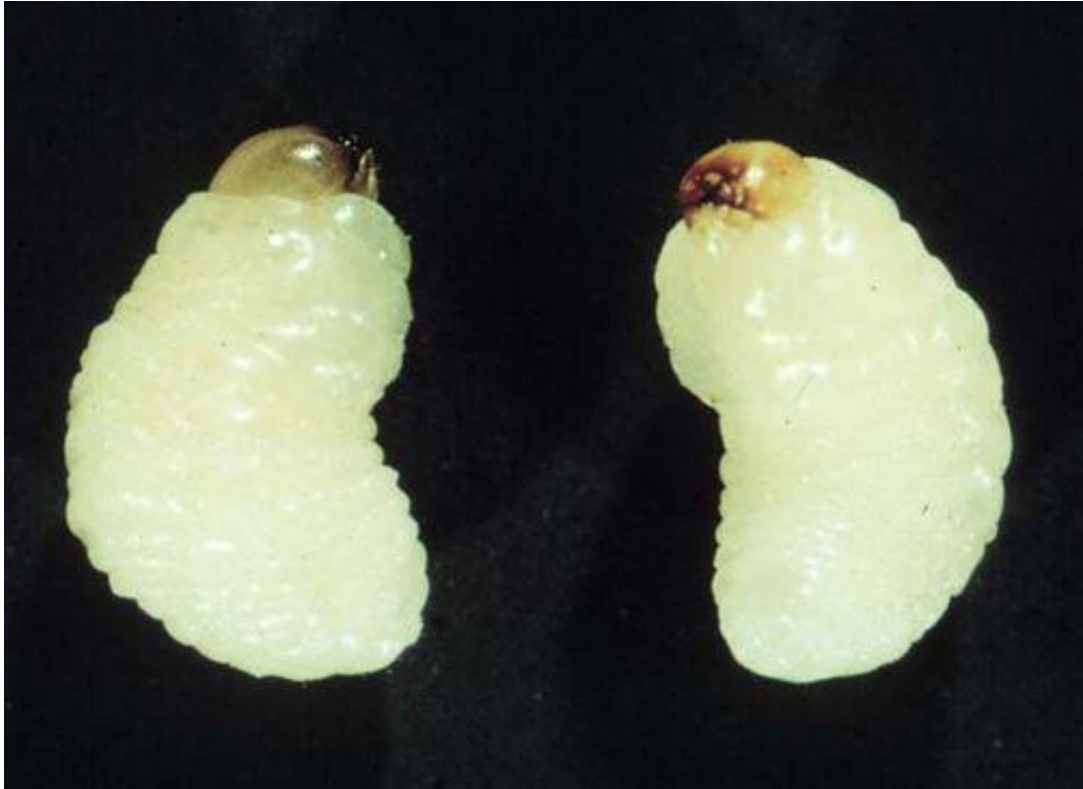
Slika 6. Ličinka žitnog žiška - Sitophilus granarius L.