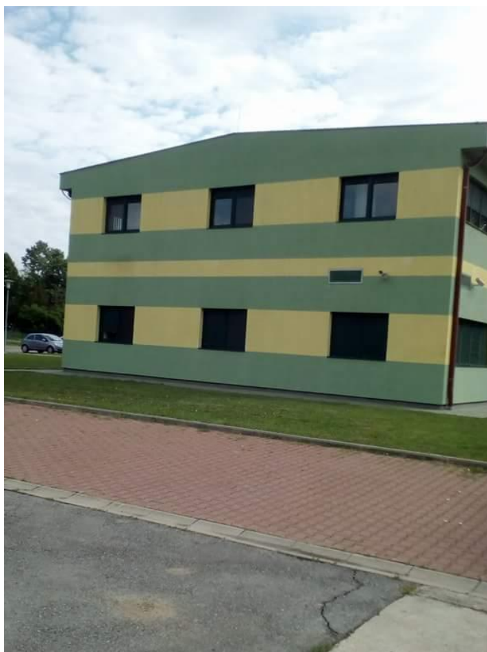
Slika 1. Upravna zgrada Zavoda za sjemenarstvo i rasadničarstvo

Zavod za sjemenarstvo i rasadničarstvo (Slika 1.) započeo je s radom 1998. godine. Prvih 12 godina djelovao je samostalno, a 2010. godine pridružen je Hrvatskom centru za poljoprivredu, hranu i selo u čijem se sastavu još nalaze Zavod za zaštitu bilja, Zavod za vinogradarstvo i vinarstvo i Zavod za voćarstvo. Unutar samoga Zavoda nalaze se Odjel za priznavanje novih biljnih sorti, Odjel za nadzor sjemenskih usjeva i izdavanje certifikata, laboratorij za ispitivanje sjemena i Odjel za rasadničarstvo. Neki od važnijih zadataka Zavoda su kontrola i praćenje GMO proizvoda, ispitivanje novih biljnih sorti, čuvanje biljnih genetskih izvora i certifikacija sjemena i sadnog materijala.