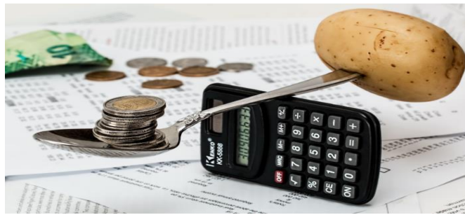
Slika 1. Bilančna ravnoteža imovine i izvora imovine