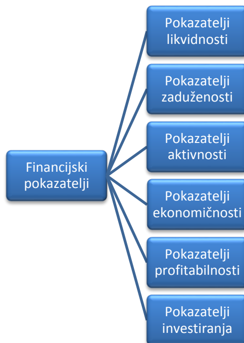
Slika 3. Financijski pokazatelji

S obzirom na različitost zahtjeva i ciljeva interesnih skupina poduzeća, razlikuje se nekoliko skupina financijskih pokazatelja: