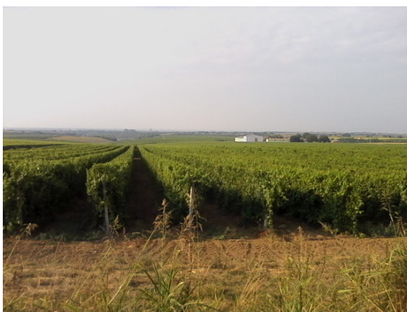
Slika 1. Vinogradi s pogledom na vinariju Vino Ilok d.d.

Nasad vinograda je u jednoj cjelini, uglavnom ravnog, blago nagnutog položaja. Posađeno je oko 4.300 čokota po ha u redove koji su dugi više stotina metara, a manipulativni putevi omogućuju normalan rad, okretanje i prilaz pojedinim dijelovima.