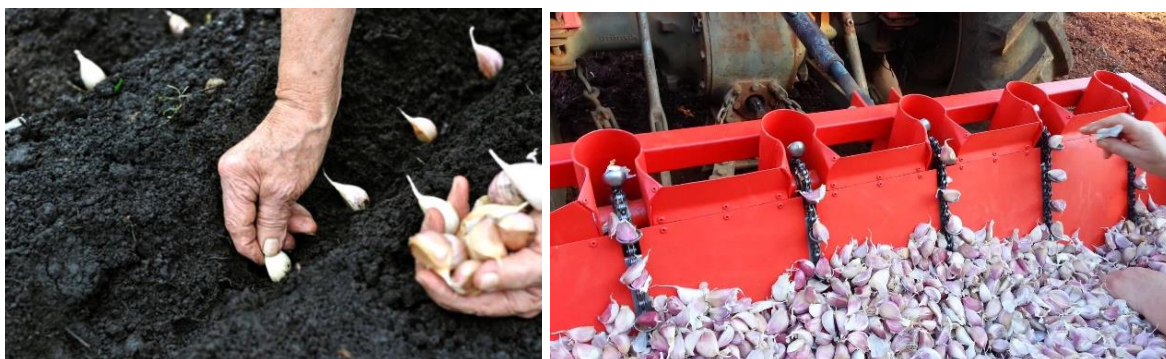
Slika 4. Sadnja češnjaka ručno (lijevo) i strojno (desno)

Prije sadnje češnjaka potrebno je glavice češnjaka rasčešnjati na češnjeve. Za sadnju su poželjne što veće glavice sa što krupnijim češnjevima kako bi sama biljka bila što jača te na kraju dala što veći prinos. Češnjak koji je namijenjen za sjeme bilo bi poželjno čuvati na temperaturi od 15-16°C čime se uvjetuje jaka dormantnost, a prije sadnje čuvati ga na temperaturi 5-6°C pri kojoj se dormantnost prekida. Raščešnjavanje glavica treba odraditi pred samu sadnju te češnjeve tretirati odgovarajućim fungicidom i insekticidom. Potapanje sjemena u otopinu insekticida i fungicida provodi se 15 minuta prije sadnje.