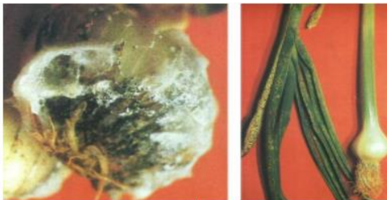
Slika 6. Bijela trulež luka (lijevo) i hrđa (desno)

biljka požuti, vene i suši se. Zaštitu treba provoditi u doba leta leptira prve i druge generacije insekticidima u dva odvojena tretiranja s razmakom od 10 dana. Značajno je provoditi navedenu zaštitu u proizvodnji sjemenskog češnjaka.