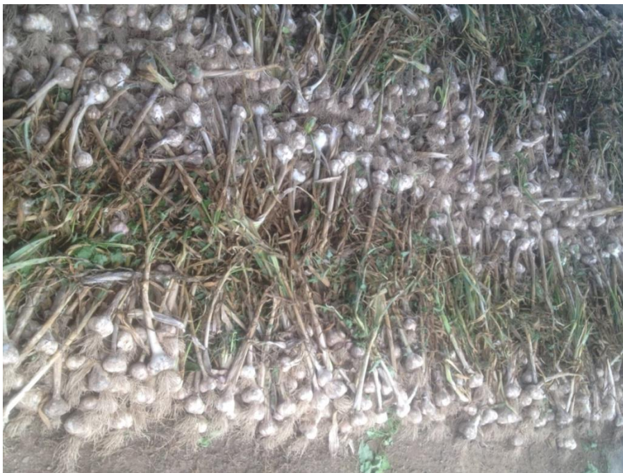
Slika 7. Skladištenje češnjaka nakon vađenja

prozračan i suh. Nakon čišćenja te sortiranja češnjaka, češnjak se pakira u mrežaste vreće, gajbe ili u rinfuzi. Tako upakiran češnjak skladišti se do stavljanja na tržište (N.N., 2017.).