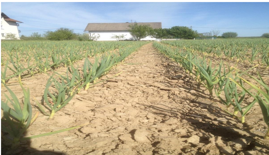
Slika.1. Nasad češnjaka

Češnjak ( Allium sativum L.) je jednogodišnja biljka karakteristična mirisa i okusa, bogata proteinima, mineralnim tvarima i specifičnim eteričnim uljem alicinom (Brkljača, 2011.). Alicin je karakteristični sastojak češnjaka koji je snažan prirodni antibiotik te kao takav pogoduje u sprječavanju i liječenju raznih zdravstvenih poteškoća. Češnjak je porijeklom iz srednje Azije, točnije iz pustinje Kirgizije odakle se proširio po cijelom svijetu. Češnjak predstavlja jednu od najstarijih i najaromatičnijih uzgajanih vrsta. Tako je zanimljiv i podatak da su u Starom Egiptu, robovi, graditelji Keopsove piramide konzumirali češnjak radi zaštite od rana i infekcija tijekom dvadeset godina njezine gradnje. S druge strane, Grci su ga mrzili i prezirali zbog neugodna mirisa, ali je znano da su ga na starogrčkim olimpijadama, atletičari ipak koristili kao prirodni doping. Zbog svega toga, češnjak se već 5000 godina smatra savršenim lijekom te je znanstveno dokazano da pomaže u borbi protiv uzročnika bolesti, normalizira crijevnu floru, čini krvne žile elastičnim, potpomaže prokrvljenost, snižava kolesterol te štiti od prehlade, a što je dovoljan razlog da ga što više koristimo u prehrani, osobito u hladnijim danima (Brkljača, 2011.).