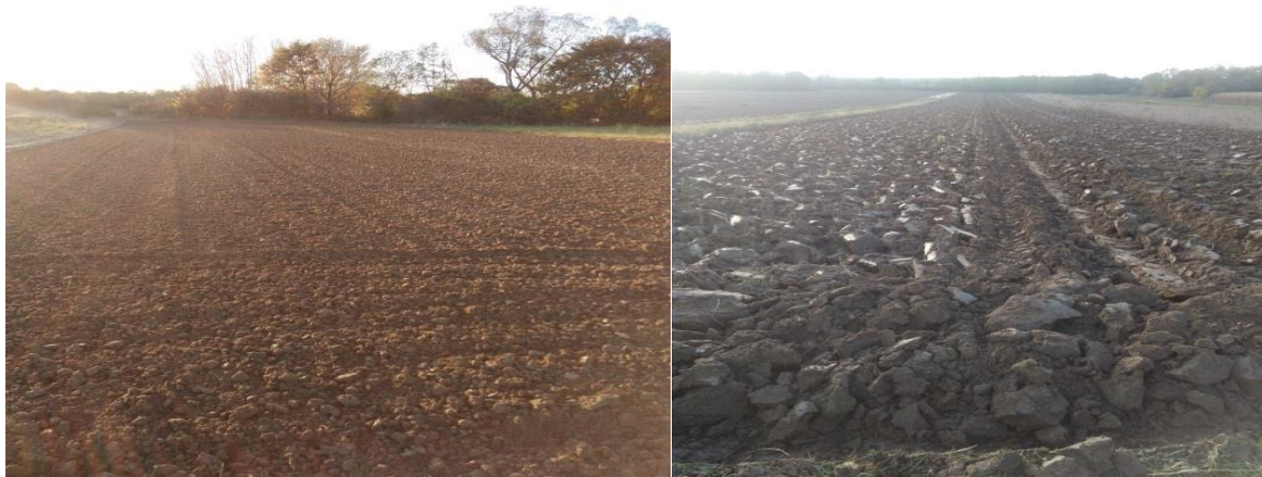
Slika 3. Zimska brazda i njiva prije sjetve

sadnju te se na taj način izbjegne prevelika vlaga u zoni sadnje. Priprema tla počinje oranjem na dubinu od 25-30 cm uz dodavanje kalija i fosfora. Količina gnojiva koja se dodaje u ovom roku ovise o kemijskoj analizi tla. Potrebno je izbjegavati pretjerano usitnjavanje površinskog sloja kako bi se spriječilo stvaranje pokorice. Zadatak predstjetvene pripreme je stvaranje rastresitog sloja tla dubine oko 8 cm (Marjanović, 2017.).