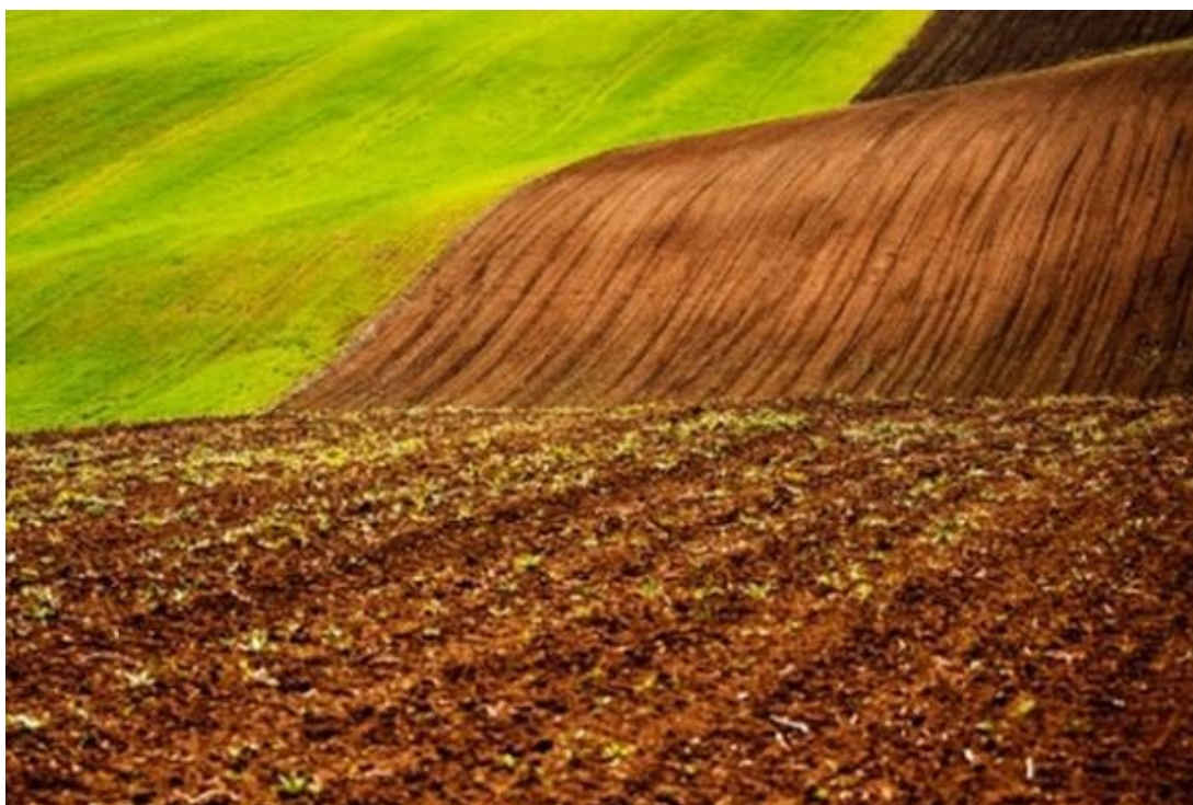
Slika 2. Oranica prije sjetve

Prvi korak u procesu proizvodnje češnjaka, a koji mora biti kvalitetno odrađen je odabir pogodnih tala. Za uzgoj češnjaka prikladna su lakša aluvijalna tla dobre strukture i blago kisele ili neutralne reakcije te nikako zaslanjena tla. Idealna kiselost tla za uzgoj je pH 6,8-7,2. Dobra ocjeditost tla i umjerena vlaga važna je za vegetativan rast. U slučaju dužeg sušnog razdoblja navodnjavanjem se može izbjeći stres od suše i osigurati planirani prinos. Češnjak je po prirodi stvari zahtjevna biljka pa tako ima velike zahtjeve prema svjetlosti što znači da za uzgoj treba izabrati dobro osunčane terene bez zasjena, drugih visokih vrsta. Za zriobu lukovice, poželjno je suho i toplo vrijeme. Povoljni uvjeti za uzgoj češnjaka u nas su u dolinama rijeka u istočnoj Slavoniji, gdje je klima aridnija, a u kraškim poljima na prisojnim položajima, gdje se zimi ne zadržavaju vode. Ako u vremenu zriobe lukovica padne više oborina, često pucaju vanjski ovojni listovi ili lukovica poprimi sivu boju od saprofitnih gljivica (N.N., 2014.).