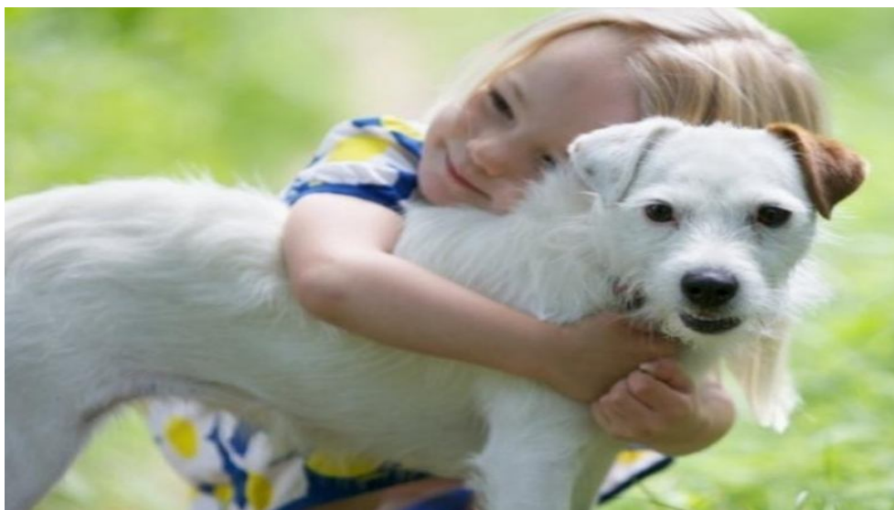
Slika 1. Pas je čovjekov najbolji prijatelj

Individualnu selekciju pasa s ciljem dobivanja željenih pasminskih osobina, čovjek je provodio od davnina. Za daljnji pripust bi ostavljao jedinke koje bi udovoljavale njegovim potrebama, a izlučivao one s nepoželjnim osobinama. Rezultat toga je da danas na svijetu postoji preko četiristo poznatih pasmina pasa. Stoga se s pravom može reći da danas svatko može izabrati pasminu koja najbolje odgovara njegovim potrebama i željama.