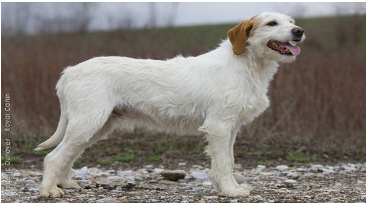
Slika 4. Istarski oštrodlaki gonič, izvor: www.rujanajeger.com pristup stranici: 17.05.2017. u 10:30 sati