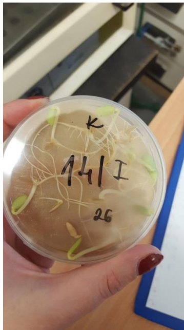
Slika 1. Petrijevka s klijancima krastavca

Na dno petrijevke stavljen je filtar papir i na njega je položeno po 10 sjemeni krastavca, odnosno salate. Potom je sjeme prekriveno s 10 mL pripremljene otopine tj. 10 mL otopine dobivene iz svakog supstrata. Nakon sedam dana izbrojan je broj iskljalih sjemenki te je mjerena njihova duljina (hipokotila i radikula) kako za krastavac tako i za salatu. Kao kontrola koristila se petrijevka s 10 mL destilirane vode.