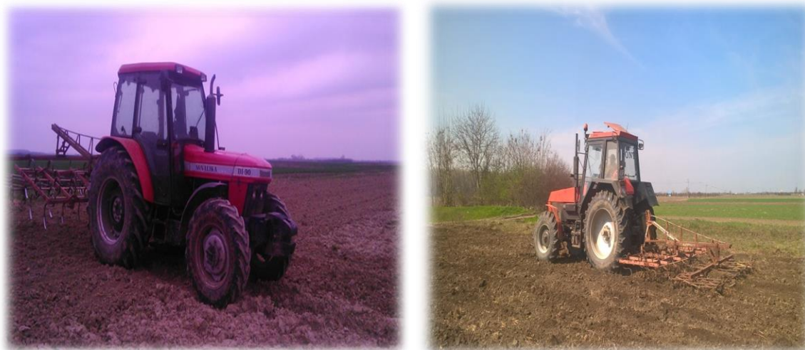
Slika 8. Sjetvospremač „Rau“ i traktori Sonalika DI 90 i Ursus 1634 na OPG-u Kate Nemet (pedsjetvena priprema tla)