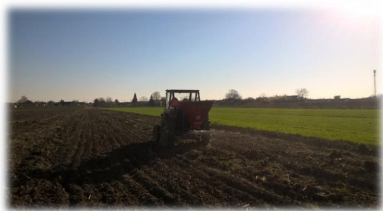
Slika 9. Predsjetvena gnojidba kukuruza na OPG- u Kate Nemet

(0:20:30) u količini od 100 kg/ha i ureom u količini od 100 kg/ha. Prihrana je obavljena u fazi 5 – 7 listova KAN-om u količini od 100 kg/ha. Ukupna količina dušika iznosila je 188 kg/ha, dok je ukupna količina fosfora iznosila 120 kg/ha, a kalija 180 kg/ha (Tablica 13.) te je u 2016. godini općenito bila provedena optimalnija gnojidba s većom količinom osnovnih hraniva u odnosu na prethodne godine.