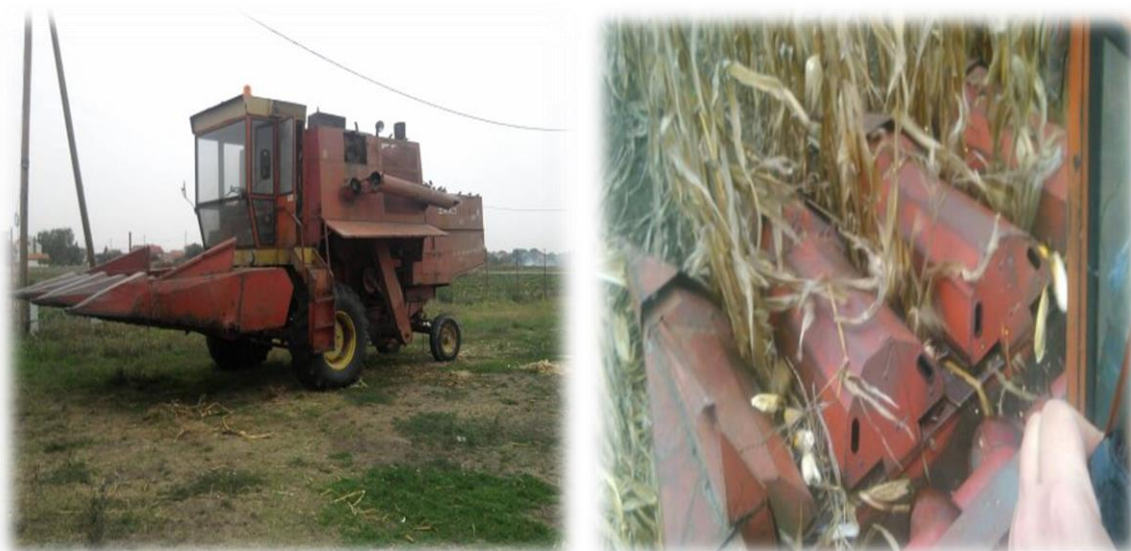
Slika 12. Kombajn Zmaj 142 RM