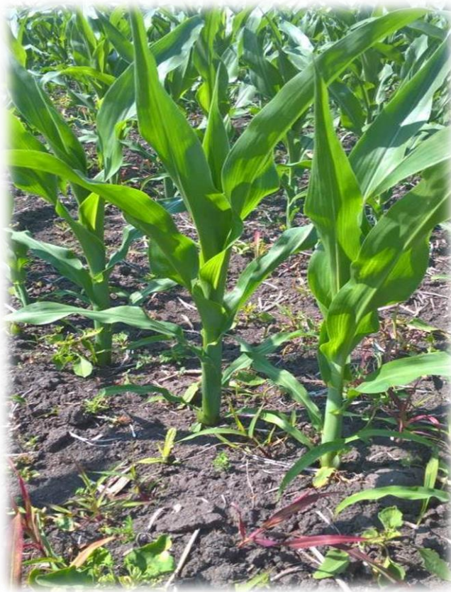
Slika 3. Početak vegetacije kukuruza (faza 6-8 listova)

Razmještaj listova, njihova građa i oblik omogućuju skupljanje i najmanjih količina vode i rose te njihovo provođenje prema korijenu. Dobar usjev trebao bi imati LAI (indeks lisne površine) 3 – 4, što znači da je ukupna lisna površina usjeva 3 – 4 puta veća od površine na kojoj biljke rastu (Pospišil, 2010.).