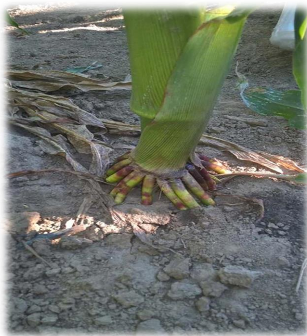
Slika 1. Zračno nodijalno korijenje kukuruza

površine tla nazivamo nadzemno nodijalno korijenje ili „zračno“ korijenje. U tlu se prva etaža ovoga korijenja razvija oko četiri tjedna horizontalno, a zatim raste u dubinu. Svaka sljedeća etaža raste manje horizontalno, a zadnje prodiru u tlo gotovo odmah okomito, što je povezano s temperaturom i vlažnosti tla. Korijen najintenzivnije raste u ranim etapama razvoja i tada nekoliko puta nadmašuje rast nadzemnog dijela biljke.