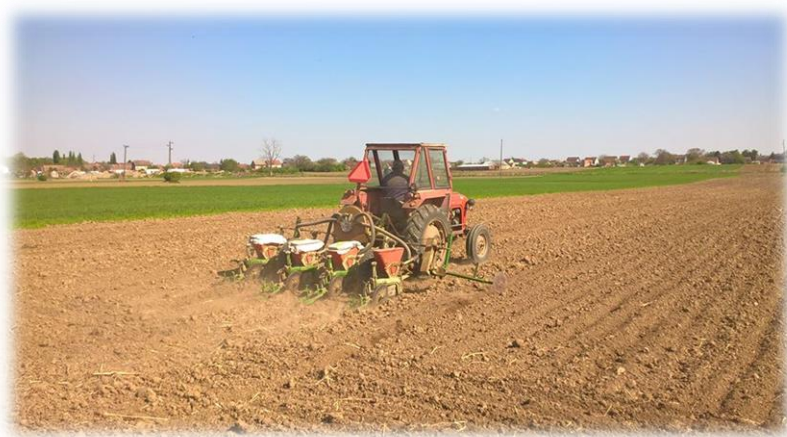
Slika 10. Sjetva kukuruza na OPG- u Kate Nemet

Sjetva je obavljena od 13. do 25. travnja, a prema podacima u Tablici 14. je vidljivo da je sjetva (Slika 10.) obavljena u optimalnom roku u svim prikazanim godinama.