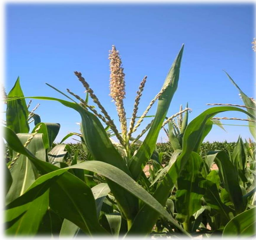
Slika 4. Metlica na početku cvatnje