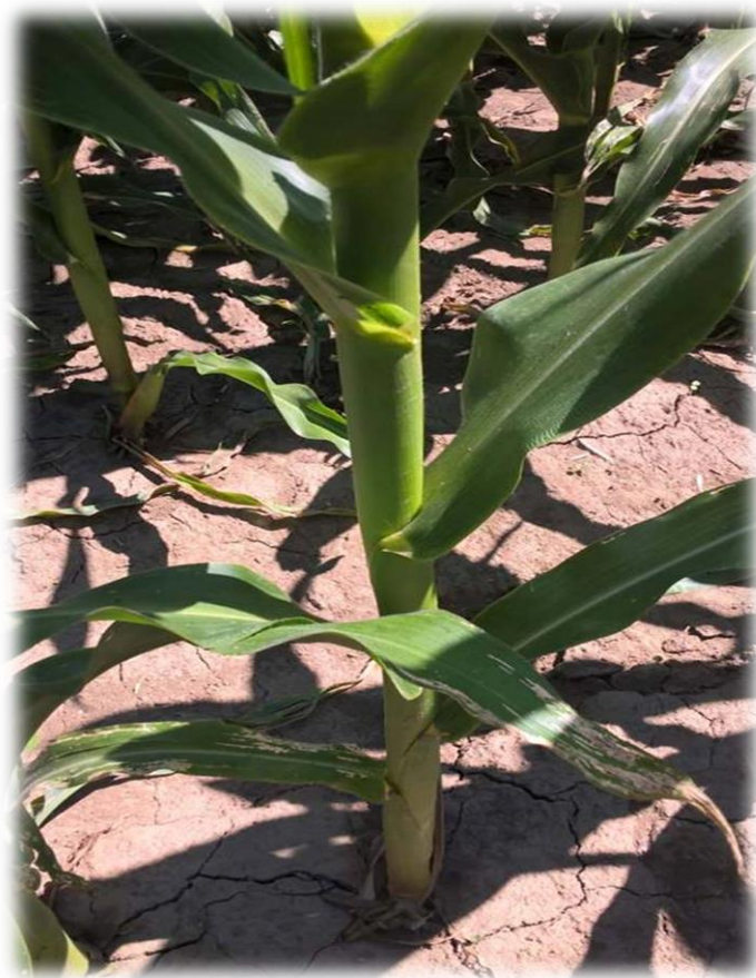
Slika 2. Nodiji i internodiji kukuruza

Unutrašnjost stabljike kukuruza ispunjena je srži (parenhimom) dok je svaki snopić provodnog staničja obavijen sklerenhimskim staničjem što daje određenu veću čvrstoću stabljici.