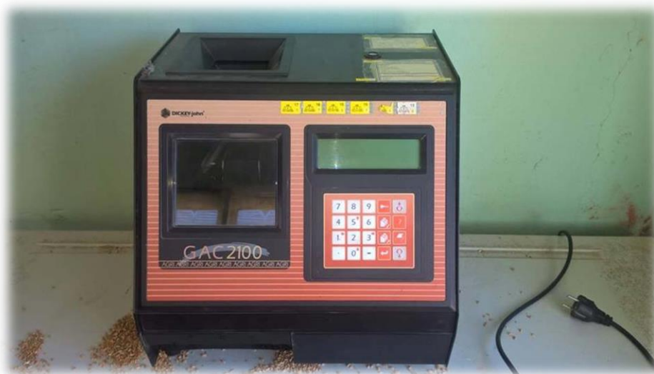
Slika 11. Uređaj za određivanje vlage zrna i hektolitarske mase