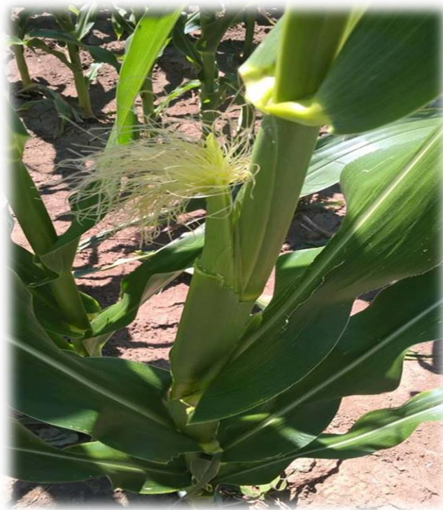
Slika 5. Klip za vrijeme svilanja

Cvjetovi na vrhu klipa imaju najkraće, a cvjetovi na dnu klipa najduže njuške i vratove tučka. Klip je s vanjske strane prekriven komušinom. Broj cvjetova može biti od 500 do 600, a kod nekih hibrida kasnije vegetacije i preko 1000.