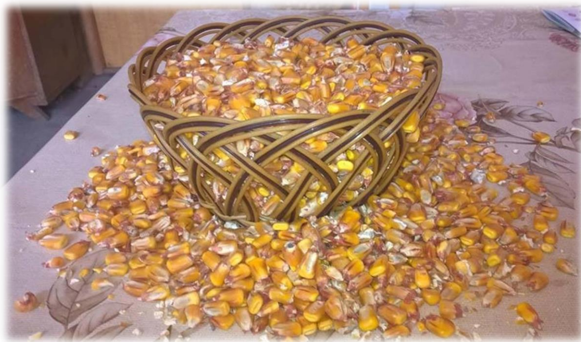
Slika 6. Zrno kukuruza tipa zuban

Omotač zrna čini 5 – 8 % mase zrna i sastoji se od perikarpa kojeg čine 10 – 12 slojeva stanica perisperma. U stanicama perikarpa nalaze se pigmenti koji daju boju zrnu ( različite nijanse žute, crvene, narančaste, smeđe, ljubičaste i dr.). Endosperm čini 78 – 85 % mase zrna i različite je konzistencije. Aleuronski sloj je jednoslojan, bezbojan ili s pigmentima. Klica je prilično velika i čini 8 – 14 % mase zrna. Smještena je u bazi endosperma s prednje strane zrna. S obzirom na kemijski sastav zrno kukuruza ima 72 % škroba, 8 – 12 % bjelančevina, 4 – 5 % ulja, 2,2 – 2,5 % sirove celuloze, 1,2 – 1,5% pepela (Guberac, 2000.).