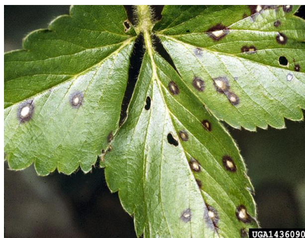
Slika 13. Simptomi obične pjegavosti lista jagode

Prema Paulus (1990.) bolest je manje opasna nego prije zbog pojave tolerantnih sorti. Takođe, danas zbog promjena u načinu uzgoja jagoda ova gljiva ne predstavlja tako veliki problem. Prvi simptomi bolesti vidljivi su u obliku malih crvenih pjega na površini mladih listova. S vremenom pjege rastu te sredina pjege poprima sivo-bijelo boju, a rubovi postaju crvenkastosmeđi (Slika 13.). Pjege se pojavljuju i na stabljikama gdje poprimaju izduženi oblik, na nekim dijelovima cvijeta i ponekad na plodovima. Gljiva prezimi na otpalom lišću i biljnim ostacima u obliku sklerocija i peritrecija. Širenju pjega pogoduje vlažno vrijeme i niske temperature. Suzbijanje je teško zbog jako malo dozvoljenih sredstava za uporabu. Dozvoljeno sredstvo za suzbijanje obične pjegavosti lista jagode kod uzgoja jagode na otvorenome je Cuprablau-z ( https://fis.mps.hr ).