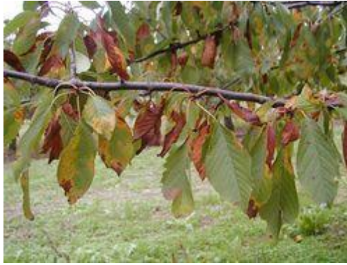
Slika 10. Uvijenost i sušenje lišća višnje

Jači napad ove gljive u Hrvatskoj utvrđen je 2011. godine na području Ravnih Kotara, Šestanovca i Cista Prova (Ražov i sur., 2012.).