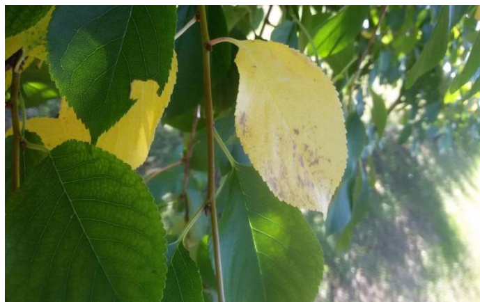
Slika 9. Kozičavost lista višnje