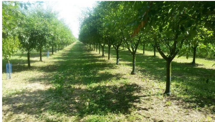
Slika 11. Voćnjak poljoprivrednog gospodarstva Degmečić

Obiteljsko poljoprivredno gospodarstvo Degmečić na lokaciji Donji Andrijevcu osnovano je 2008. godine. Voćnjak višnje sorte Oblačinska nalazi se na površini od 37,32 ha, a zasađeno je 400 stabala višnje. Razmak redova je 5 m, a unutar reda razmak je 3 m (Slika 11.).