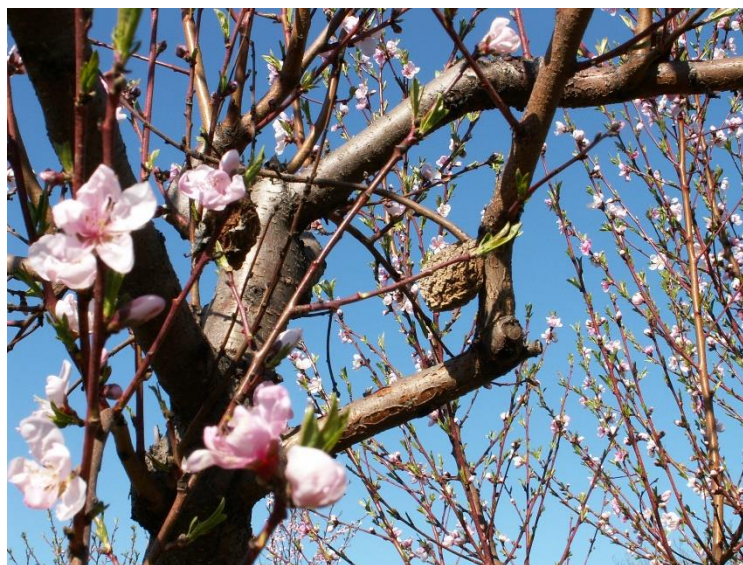
Slika 2. Monilinia laxa – mumija