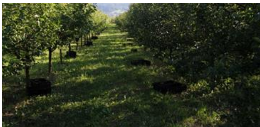
Slika 13. Berba višnje

U 2016. i 2017. godini na obiteljskom poljoprivrednom gospodarstvu Degmečić na lokaciji Donji Andrijevci praćena je pojava bolesti, determinacija uzročnika te je vođena evidencija o uporabi sredstava za zaštitu bilja.