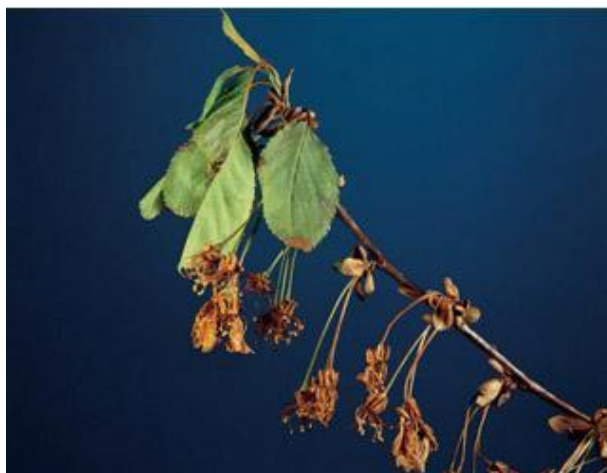
Slika 1. Palež cvijeta i mladice višnje

Sušenje mladica u cvatnji očituje se kroz naglo posmeđenje, sušenje i propadanje tek procvalih cvjetova (Slika 1.). Mladica se osuši, a broj osušenih mladica može biti velik i na njima nema plodova. Simptomi infekcije mogu biti vidljivi i na plodovima (Slika 2). Gljiva parazitira sve koštičavo voće i u našem uzgojnom području javlja se svake godine u slabijem ili jačem intenzitetu (Ivić i Novak, 2012.).