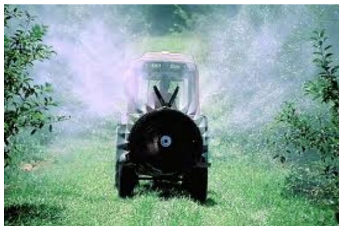
Slika 17. Tretiranje nasada višnje

Početni simptomi kozičavosti se javljaju krajem svibnja, na licu lista se nalaze sitne okruglaste do ovalne, ljubičaste do zagasito ljubičaste pjege, promjera 1 do 3 mm. Pjege se mogu spajati i zahvatiti veći dio površine lista. Na naličja lista vide se prljavo bijele nakupine koje se zovu acervuli. Za vlažnog vremena nastaje velik broj acervula i nakon pojave pjega listovi dobivaju žutu boju a zatim otpadaju.