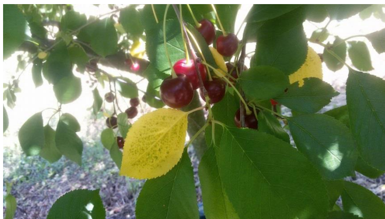
Slika 18. Stablo zaraženo Blumeriom jappii koje nije prouzročilo štetu za urod