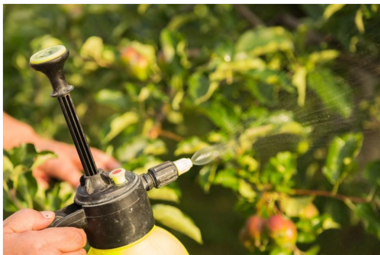
Slika 14. Folijarna prihrana

Precizan proračun iznošenja i unošenja hranjiva i praćenje visine prinosa te redovne analize tla mogu pomoći u planiranju i izračunu potrebne gnojidbe tla i folijarne prihrane, ovisno o zahtjevima biljne vrste. Za izračun potrebne količine gnojiva treba uvažavati planirani i mogući prinos te specifične potrebe biljne vrste ( http://www.savjetodavna.hr/ ).