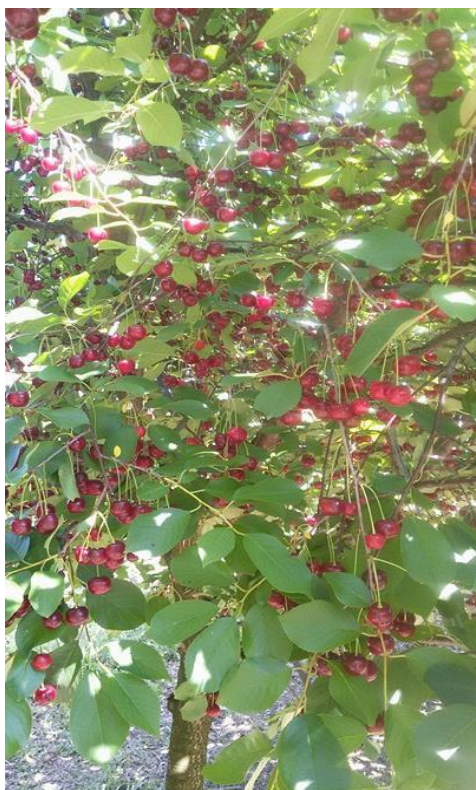
Slika 12. Urod jednog stabla višnje

Prosječan prinos jednog stabla u voćnjaku na poljoprivrednom gospodarstvu u Donjim Andrijevcima je oko 13 kilograma (Slika 12.).