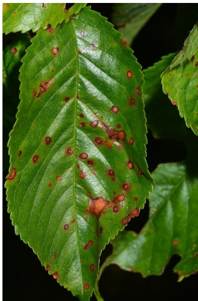
Slika 6. Pjege na listu

Na peteljckama nastaju izdužene pjege, a posljedica je sušenje lista. Napadnuti plodovi poslije cvatnje se suše, poprimaju tamnosmeđu boju i otpadaju. Na zelenim plodovima nastaju svijetlo smeđe velike pjege (Cvjetković, 2010.).