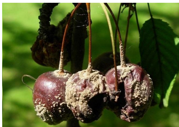
Slika 4. Trulež ploda višnje

Kao i Monilinia laxa i Monilinia fructigena se na koštičavom voću u Hrvatskoj javlja svake godine i može uzrokovati ekonomski vrlo značajne gubitke (Ivić i Novak, 2012.).