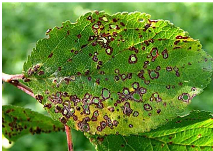
Slika 7. Šupljikavost lista višnje