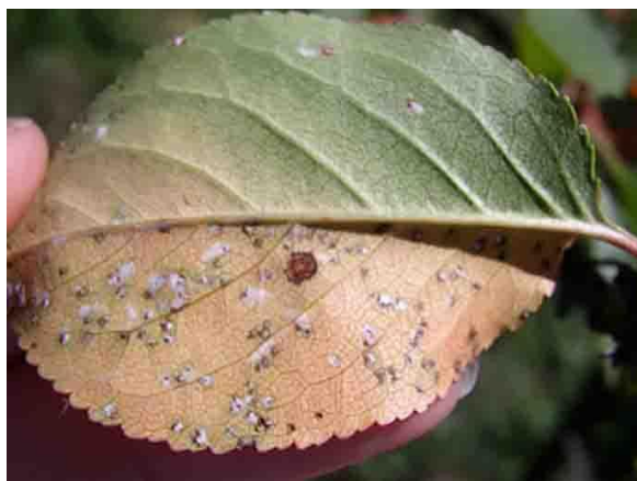
Slika 8. Prljavo bijele nakupine – acervuli

i zahvatiti veći dio površine lista. Na naličja lista vide se prljavo bijele nakupine koje se zovu acervuli (Slika 8.). Za vlažnog vremena nastaje velik broj acervula i nakon pojave pjega listovi dobivaju žutu boju a zatim otpadaju (Slika 9.).