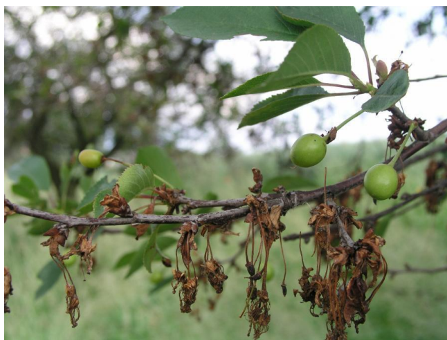
Slika 3. Palež cvijeta kada su plodovi zametnuti

Prezimi u zaraženim polusuhim granama na kojima u proljeće nastaju jastučići s mnoštvom konidija. Konidije obavljaju zarazu u cvatnji preko cvjetnih organa. Ponekada može doći do zaraze dok je cvijet još zatvoren ili kada su plodovi već zametnuti (Slika 3.). Najkritičnije vrijeme za zarazu je cvatnja, a ukoliko tada prevladava kišovito i prohladno vrijeme nastaje veliki broj zaraza, odumiranje cvjetova što će za posljedicu imati velike ekonomske gubitke (Cvjetković, 2010., Dimova i Titjmov, 2013.).