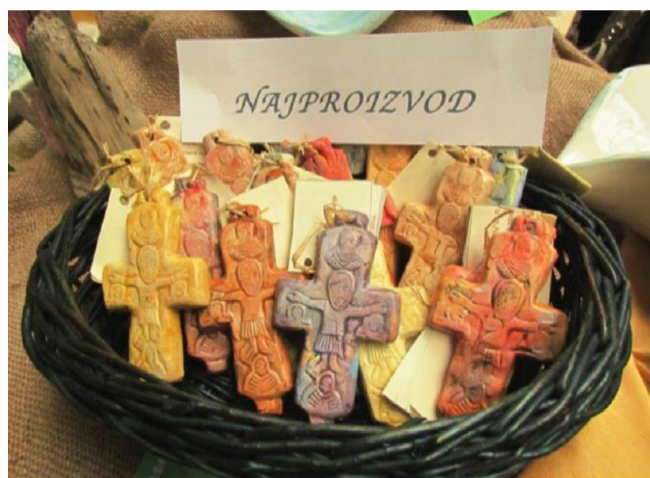
Slika 7. Čikin križić, UZ Mocire, OŠ Voštarnica, Zadar