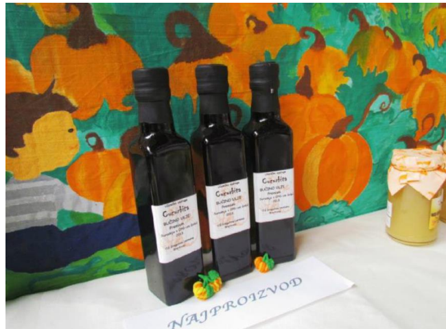
Slika 5. Bučino ulje, UZ Cucurbita, OŠ Dragutin. Lerman, Brestovac