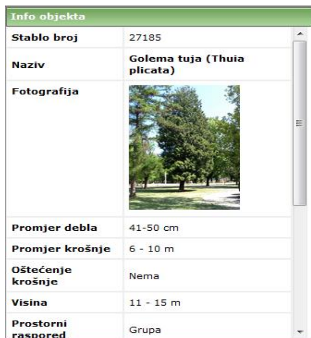
Slika 12. Primjer unošenja atributa stabla

Po potrebi se može dodati još atributa ako se ocijeni da je to potrebno radi efikasnijeg planiranja radova i slično (slika 12.). Fotografirati se može pojedinačno svako stablo, ili određene cjeline (pogled na ulicu, park i sl.) a zbog potrebe detaljnije arhive podataka kao i mogućnosti vizualnog uvida i usporedbi stanja izvršenih zahvata na zelenim površinama u određenom vremenskom razdoblju.