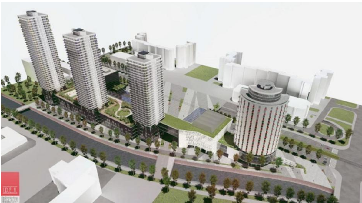
Slika 1. Primjer plana za stambeno poslovni prostor za kojeg je potrebna ekspropiracija

Pojam arondacije obuhvaća zaokruživanje nekog društvenog posjeda. Ova operacija može se provoditi radi izvođenja melioracijskih i protiv erozivnih radnji. Također cilj arondacije može biti i pošumljivanje, podizanje plantaža voćnjaka ili vinograda, racionalnije iskorištavanje i obrada poljoprivrednog zemljišta uz bolje korištenje mehanizacije itd. Za razliku od primjerice komasacije, kod arondacije se ne projektiraju novi putevi niti se izvode objekti hidrotehničkih melioracija. Isto tako, granice, oblik i veličina novih parcela ovise uglavnom o pravilnosti već postojećih putnih i kanalizacijskih mreža. Nedostatak ove operacije je što se većim dijelom provodi za društvene posjede, dok su individualni poljoprivrednici u ovom procesu samo indirektni sudionici.