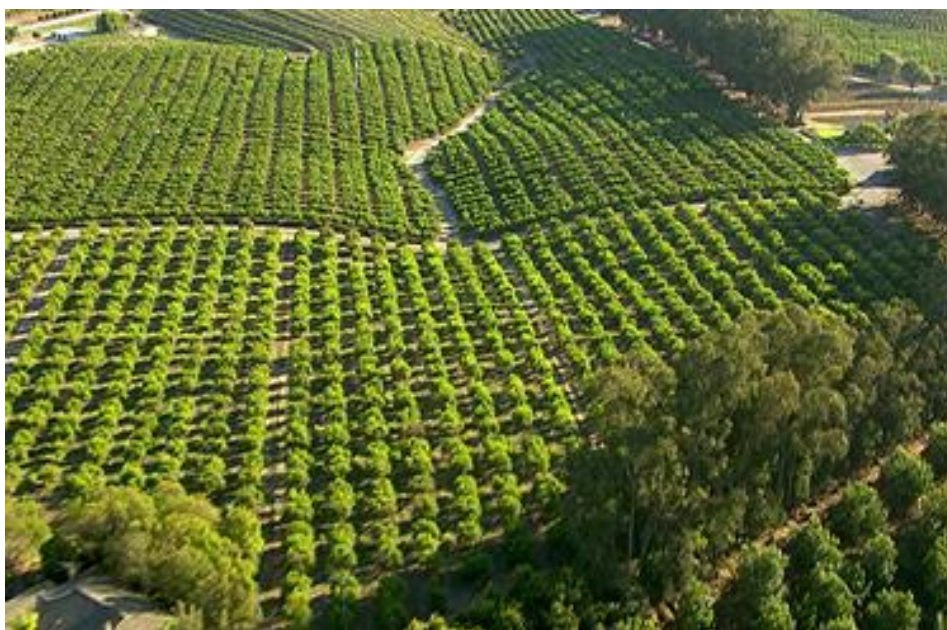
Slika 5. Poljoprivredno zemljište nakon komasacije

zadovoljenja općih potreba (izgradnja škola, vrtića, ambulanti, športskih igrališta itd.). Nakon provedene komasacije jednostavnije je održavanje katastra odnosno katastarskih planova te se omogućava stvaranje poslovnih zona i lakša promocija lokalnih razvojnih projekata. Općenito, potiče se decentralizacija te jača uloga i odgovornost lokalnih nositelja vlasti, u cijeli projekt se uključuju i lokalne agencije. Za dio stanovništva prilika je da tijekom komasacije jednostavnije i povoljnije ponude ili prodaju svoje poljoprivredne površine. Država, zbog boljeg korištenja (ograničenog) zemljišnog potencijala, potiče količinski veću i konkurentniju poljoprivrednu proizvodnju, veću zaposlenost te ostanak u ruralnom prostoru. Uredne vlasničke knjige olakšavaju i potiču tržište poljoprivrednim zemljištem te se često „otkriva” nekada uzurpirano državno poljoprivredno zemljište. Nakon komasacije lakše se sprječava „uzurpacija“ poljoprivrednog zemljišta za različite nepoljoprivredne namjene, ali ispravlja i često proširuje granice građevinskog dijela naselja što olakšava legalizaciju i uknjižbu objekata. Da bi se sagledao gospodarski učinak nakon provedene komasacije zemljišta, trebalo bi odgovoriti na pitanje u kojoj je mjeri komasacija omogućila uštedu rada i za koliko je povećala prinose poljoprivrednih proizvoda u pojedinim gospodarstvima (Grgić i sur, 2016).