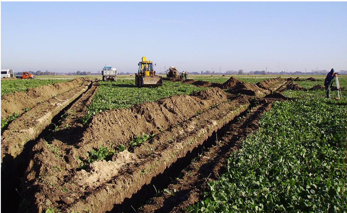
Slika 3. Postupak melioracije zemljišta

Cilj tog zakona bio je zaokruživanje seoskih gospodarstava u što jedinstveniji kompleks obzirom da je prethodno zbog rascjepkanosti seoskih gospodarstava došlo do slabijeg iskorištavanja određenih parcela. Doneseni zakon nije udovoljavao svim očekivanjima pa je 1902. usvojen novi zakon poznat kao Hrvatski zakon o komasaciji zemljišta prema kojem su se komasacije provodile narednih 50ak godina. Kasnije tijekom povijesti donosilo se još zakona o komasaciji, a sve s ciljem unapređenja poljoprivredne proizvodnje. Od osamostaljenja Republika Hrvatska nije pridavala veću pozornost komasaciji, a djelovanje geodetske struke bazira se uglavnom na sređivanju postojeće evidencije (internet) te državnoj katastarskoj izmjeri, koje za svrhu imaju, prije svega, „legalizaciju“ postojećeg stanja na terenu i rješavanje imovinsko-pravnih odnosa na obuhvaćenom području kroz zemljišnoknjižni ispravni postupak te izradu suvremenih (digitalnih) katastarskih planova. (Slika 4.)