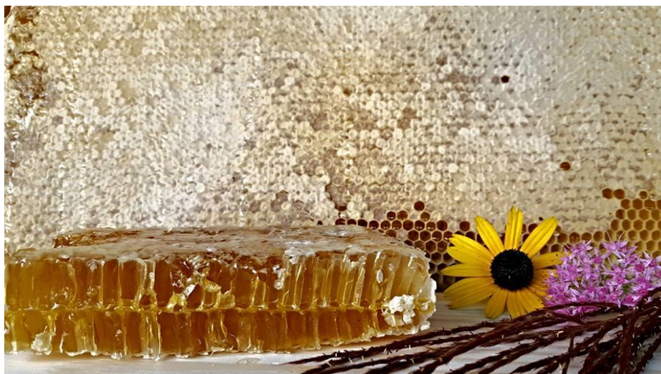
Slika 10. Med u saću

Na ovom OPG-u proizvodi se med s prirodnim, organskim dodacima poput cejlonskog cimeta, svježeg đumbira, ali i oni za kojim će rado posegnuti ljubitelji čokolade, organskim kakaom i čokoladom koja sadrži 80% kaka. U sklopu njihovih proizvoda nalazi se i med u saću, vosak, tinktura propolisa kao i njegov prah, pelud te matična mliječ.