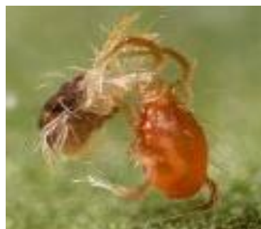
Slika 22. Phytoseiulus permisilis