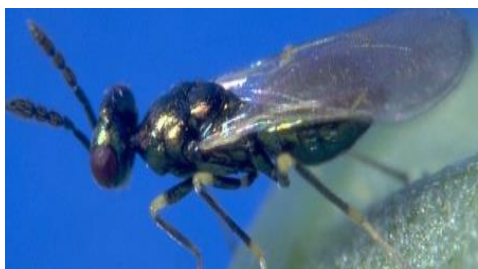
Slika 29. Diglyphus isaea