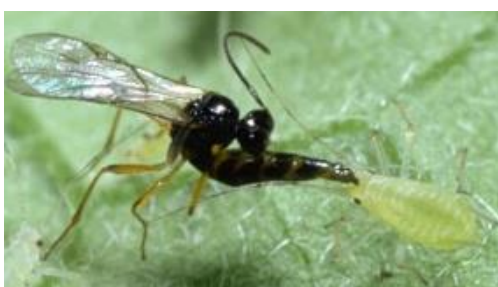
Slika 31. Aphidius ervi