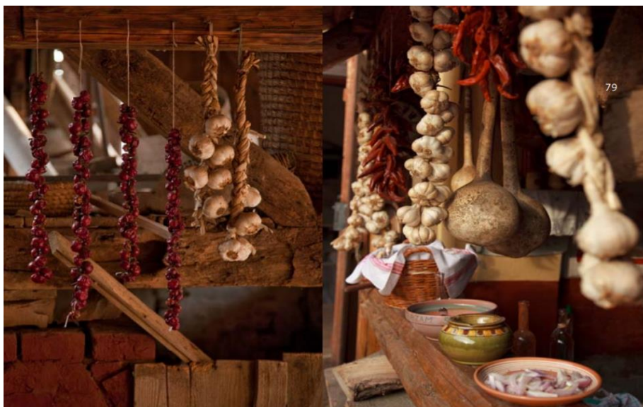
Slika 21. Čuvanje namirnica za zimu

biti siguran da će u toj obitelji uvijek naći oslonac. Budući da se u pušnici meso puši na dimu, ta je prostorija crna od čađi, a u Sklepića, puna je kobasica, šunki i baranjskog kulena, napravljenih od domaćih crnih svinja, također uzgojenih na dotičnom imanju. Zimnica i druge namirnice čuvaju se preko zime na način kako se to nekada radilo (Slika 21).