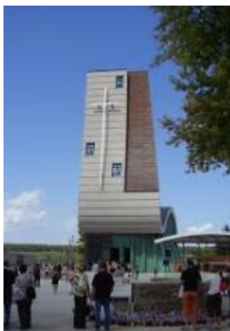
Slika 13. Crkva Gospe od Utočišta u Aljmašu