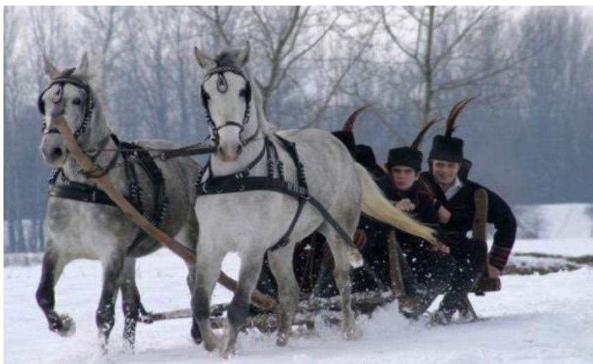
Slika 24. Vožnja saonicama kroz baranjsku ravnicu

doživljaja kada su se pojedini mladići i djevojke upravo na takvim zimskim vožnjama zbližili i proživjeli ljubavnu avanturu.