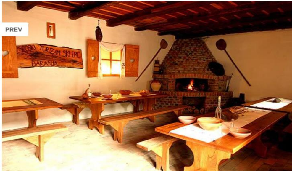
Slika 22. Prostorija za ručak