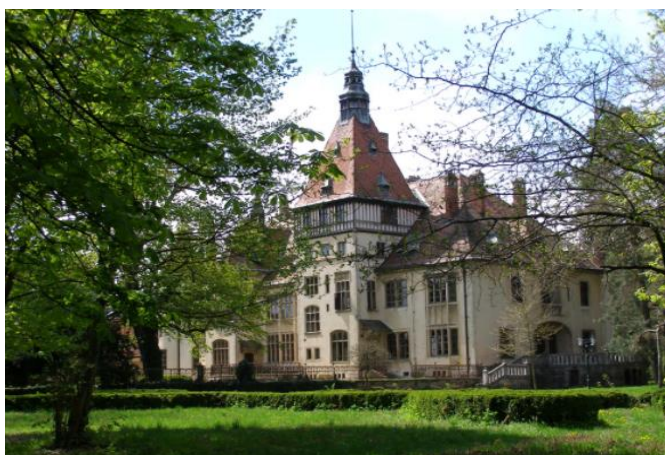
Slika 10. Dvorac Hilleprand-Mailath u Donjem Miholjcu

Dvorac Hilleprand-Mailath smješten u samom središtu Donjeg Miholjca i okružen lijepo uređenim parkom, vanjskim je izgledom vjerojatno najatraktivniji u Županiji, a pripada i među najbolje očuvane dvorce u Hrvatskoj. Jedan od glavnih razloga je i razmjerna mladost ovog dvorca, izgrađenog početkom 20. stoljeća, zbog čega on ipak ima manje povijesno značenje ne samo od našičkog, nego i od turistički još slabije valoriziranog valpovačkog dvorca.