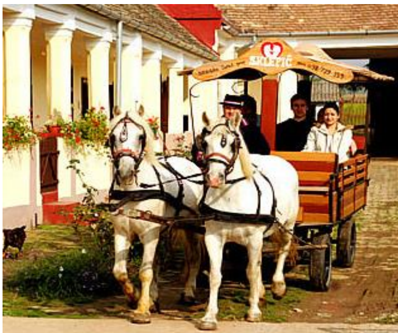
Slika 20. Posjetitelji obiteljskog gospodarstva Sklepić u originalnim seljačkim kolima s konjskom zapregom

Posjetitelji su obično radoznali, pa ih se provede kroz prostorije, a posebno je svima zanimljiva soba u kojoj su smješteni neki od alata i „uređaja“ koji su se u prošlosti upotrebljavali. Tako se može sjesti za tkalački stan i provući nit koja stvara „krparu“ (starinski tepih izrađen od odbačenih krpa raznih boja; takvim su tepisima obložene sve spavaće sobe na Sklepićevu imanju). Postoji i soba s krušnom peći, gdje su nekada sjedile bake, grijući si leđa i štrikajući čarape za zimske dane, a na zapečku iznad krušne peći nerijetko su u hladnim danim spavala djeca. U takvoj atmosferi nije teško zamisliti tu brojnu djecu rumenih obraza kako se bude iz sna i traže pogledima jesu li gotovi kukuruzni žganci za prvi doručak.