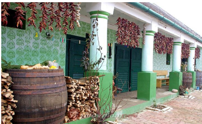
Slika 18. Panonska kuća uređena je na starinski način, s neizostavnim ulaznim „ganjkom“