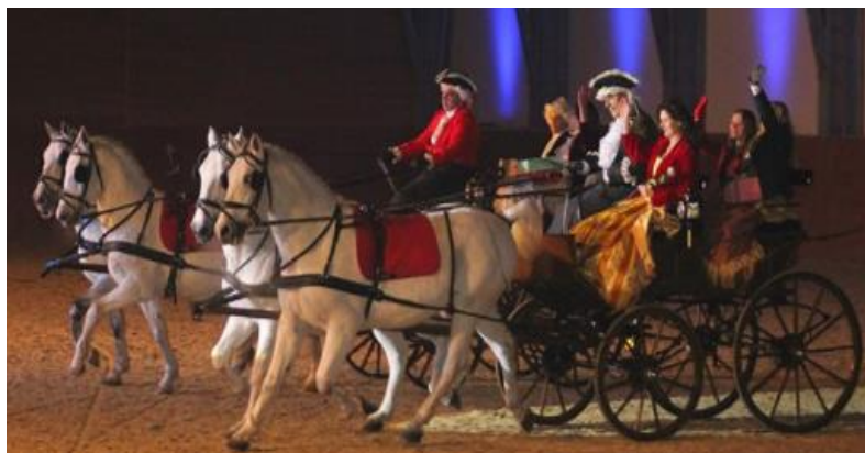
Slika 5. „Božićni bal“ na Ergeli lipicanaca u Đakovu

Održavanje takvih prigodnih svečanosti poznato je diljem Hrvatske i svake godine privlači velik broj posjetitelja iz zemlje i inozemstva, što je zasigurno značajan doprinos cjelokupnom razvoju turizma ove regije.