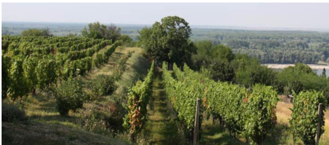
Slika 7. Erdutsko vinogorje

Erdutsko vinogorje – Erdutski su vinogradi smješteni na istočnim padinama Daljske planine, uz rijeku Dunav koja oplavljuje Erdut i čini ga poluotokom. Plantažni se vinograd pruža na plodnim lesnim nanosima u pravcu istok – zapad, na obroncima Erdutsko-Daljske planine, s najvišim kotama od 130 do 190 metara, a ta je nadmorska visina idealna za uzgoj vinove loze na tom pjeskovito-ilovastom tlu. Ovaj prostor ima status zaštićenog krajolika, a najbolji dokaz vrijednosti njegova slikovitog izgleda su brojne kuće za odmor uz županijsku cestu Aljmaš – Erdut iznad Dunava. Upravo se ova lokacija u cijeloj Slavoniji smatra najatraktivnijom za posjedovanje kuće za odmor, tako da se vrijednosti nekih kuća s pogledom na Dunav i okolne šume mogu uspoređivati s kućama za odmor na najekskluzivnijim lokacijama na Jadranu. Ove su činjenice osobito važne zbog toga što u Erdutu postoji vinarija u sklopu nekadašnje kurije Adamović-Cseh, poznata po hrastovoj bačvi kapaciteta 75.000 litara, najvećoj na svijetu, te je stoga uvrštena u Guinnessovu knjigu rekorda. Jedino mjesto s kojeg se pruža pogled na Dunav stara je srednjovjekovna kula u Erdutu, koja stoga i figurira kao ključna točka zanimljiva za turističke posjete. 57