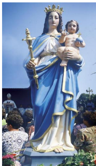
Slika 14. Kip Gospe od Utočišta u Crkvi u Aljmašu