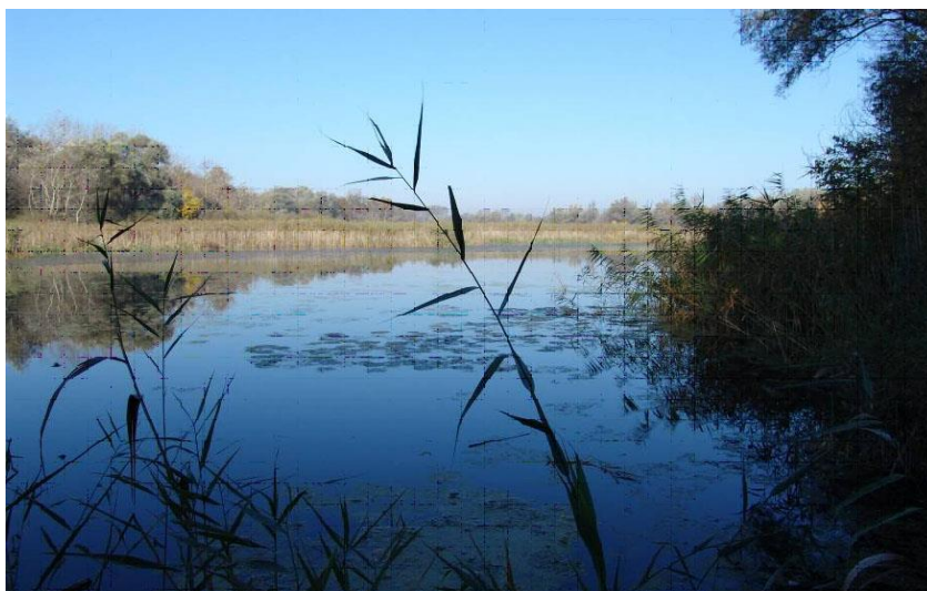
Slika 3. Pogled na Kopački rit