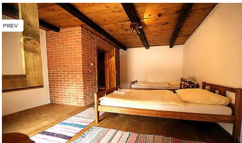
Slika 19. Jedna od sedam dvokrevetnih spavaćih soba na imanju Sklepić

Noćenje s doručkom na Sklepićevu imanju stoji 185,00 kuna. Za više ostvarenih noćenja odobrava se popust.