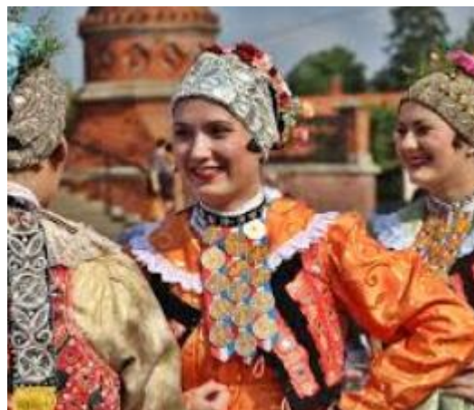
Slika 15. Smotra folklor na priredbi Đakovački vezovi

Đakovački vezovi danas su dobro poznata i afirmirana manifestacija izvornog narodnog folklor, koja se svake godine u ljeto održava u Đakovu. Prvi Đakovački vezovi održani su 1967. godine i doživjeli su velik uspjeh kod ljudi iz Slavonije. U sklopu ove manifestacije izvodi se izvorni folklor ne samo Slavonije, Baranje i zapadnog Srijema, već i drugih krajeva Hrvatske, uz prateće priredbe kao što su: otvorenje raznih izložbi, konjičke priredbe, pučko crkveno pjevanje, Đakovština u pjesmi i plesu, svečana povorka