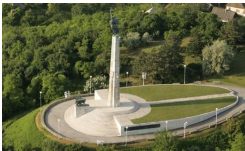
Slika 8. Spomenik s Vidikovcem u Batini

Valja naglasiti da je osnova privlačnosti spomenika dvojaka: s jedne strane privlačnu snagu ima sam spomenik poznatog hrvatskog kipara Antuna Augustinčića, kao arhitektonsko djelo sorealističke arhitekture i spomenik jednom posebnom kontekstu oslobađanja naše zemlje od fašizma, a s druge strane privlači lokacija spomenika na jednom od najatraktivnijih vidikovaca Hrvatske. Kao vidikovac, ovaj je lokalitet privlačan svakom putniku namjerniku, dok je kao spomenik, usprkos svojoj jedinstvenosti, izrazito privlačan samo manjem dijelu potencijalnih turista. 64