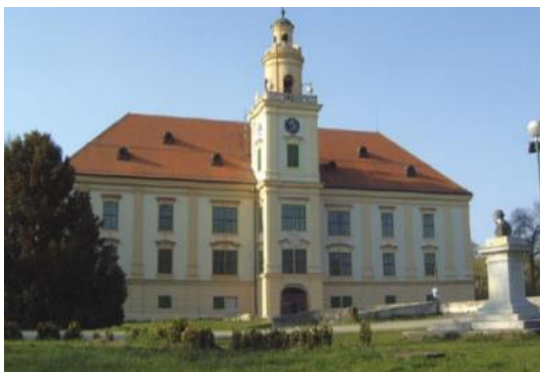
Slika 11. Dvorac Prandau-Normann u Valpovu

Kao rijetko koja srednjovjekovna utvrda u Hrvatskoj, utvrda u Valpovu uspjela se sačuvati sve do danas, i to zato jer je Turci, prilikom povlačenja 1687. godine nisu srušili. U 18. stoljeću tu nekadašnju utvrdu grofovi obitelji Hilleprand von Prandau pretvorili su u dvorac, a oko njega uredili prostrani perivoj. Južni dio perivoja čini autohtona šuma u kojoj prevladavaju hrast i lipa. Dvorac u kojem se danas nalazi