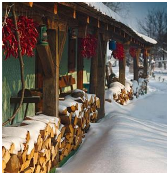
Slika 23. Zimski ugođaj na baranjskom imanju Izvor:

Moglo bi se pretpostaviti da najviše gostiju dolazi u proljeće, ljeto i jesen, međutim, u razgovoru s Denisom Sklepićem, doznaje se da popriličan broj gostiju dolazi na njihovo imanje i u zimsko vrijeme. Posebno su bili česti „zimski“ gosti ranijih godina, kada su zime bile žešće, a snjegovi obilni. Zima na seoskom gospodarstvu ima posebne ljepote (Slika 23).