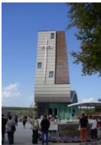
Slika 13. Crkva Gospe od Utočišta u Aljmašu