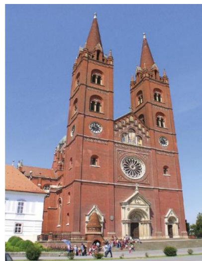
Slika 12. Katedrala Sv. Petra u Đakovu

Đakovo se s pravom ponosi svojom prošlošću i kulturno-povijesnim spomenicima od najstarijih vremena pa do 20. stoljeća. Skladne i stilski ujednačene građevine iz različitih povijesnih razdoblja – zidine iz 14. stoljeća, župna crkva Svih svetih, nekadašnja turska džamija iz 16. stoljeća, kasnobarokne kaptolske kanoničke kurije, neoromanička biskupska katedrala sv. Petra, biskupski dvor, Dijecezanski muzej, Spomen-muzej biskupa Josipa Jurja Strossmayera i Muzej Đakovštine s galerijom slika, dijecezanski arhiv i knjižnica, samostan sestara sv. Križa sa crkvom i druge građevine – sačuvale su draž stare jezgre grada isprepletene karakteristikama baroka, secesije i historicizma.