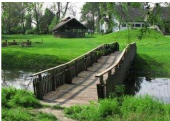
Slika 2. Drveni most premošćuje ritski kanal

Kopački rit dobio je ime od mađarskih riječi kapocs , što znači kopča, i ret = močvarna livada. Riječ kopča označava poveznicu, a tu su funkciju oduvijek imali mnogobrojni drveni mostići koji su povezivali dvije obale kanala kojih je ovaj rit prepun. 44