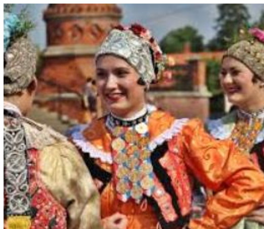
Slika 15. Smotra folklor na priredbi Đakovački vezovi

Đakovački vezovi danas su dobro poznata i afirmirana manifestacija izvornog narodnog folklor, koja se svake godine u ljeto održava u Đakovu. Prvi Đakovački vezovi održani su 1967. godine i doživjeli su velik uspjeh kod ljudi iz Slavonije. U sklopu ove manifestacije izvodi se izvorni folklor ne samo Slavonije, Baranje i zapadnog Srijema, već i drugih krajeva Hrvatske, uz prateće priredbe kao što su: otvorenje raznih izložbi, konjičke priredbe, pučko crkveno pjevanje, Đakovština u pjesmi i plesu, svečana povorka