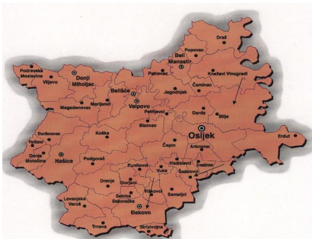
Slika 1. Osječko-baranjska županija

Osječko-baranjska županija nalazi se u Euroregiji Dunav – Drava – Sava, te graniči s Mađarskom i Srbijom, a u blizini je i Bosna i Hercegovina. Kroz zemljopisni položaj Osječko-baranjska županija povezana je euroregionalnom suradnjom s drugim regijama koje dotiče rijeka Dunav. U skoroj budućnosti kroz Osječko-baranjsku županiju prolazit će koridor Vc, čime se očekuje značajan porast tranzitnih gostiju s područja Poljske, Češke, Slovačke, Mađarske, Njemačke i Ukrajine.