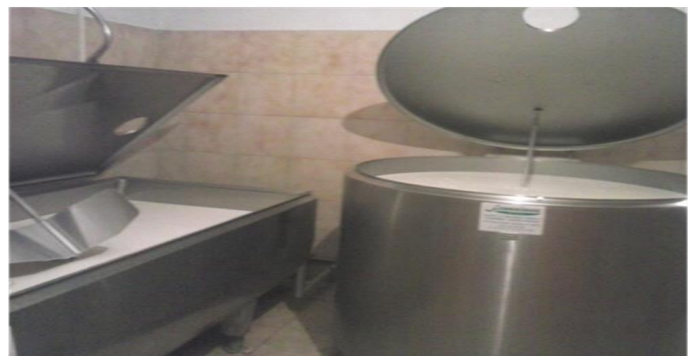
Slika 5. Laktofrizi na OPG