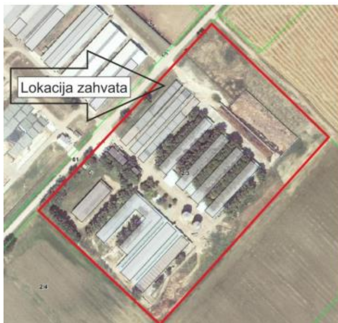
Slika 2. Snimak područja sa objektima farme Jakobovac

Kao što je već navedeno potrebno je rekonstruirati postojeće i izgraditi nove objekte na farmi junica Jakobovac koja će služiti za uzgoj junica te za uzgoj rasplodnog podmlatka (www.vusz.hr, 2017.). Na slici 2. prikazan je plan lokacije proizvodnih objekata. Na farmi je predviđeno slobodno držanje rasplodnih junica na dubokoj stelji u stajama tipa hladne staje.