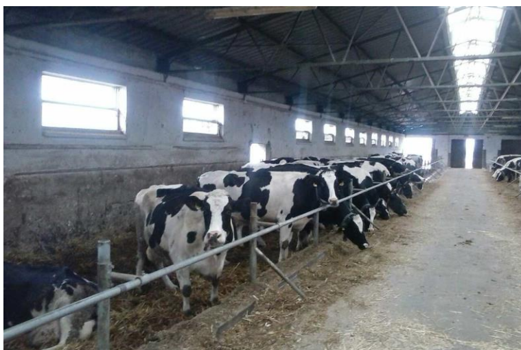
Slika 3. Holstein-frizijska pasmina

Na farmi Jakobovac uzgoja se Holstein-frizijska pasmina goveda, te je tehnologija i organizacija proizvodnje usmjerena proizvodnji mlijeka. Holstein-frizijska pasmina je najmlječnija pasmina rasprostranjena gotovo u cijelom svijetu. Proizvodni kapacitet mliječnosti iznosi 7.000 do 10.000 i više kilograma s 3,6% mliječne masti i 3,2% proteina. Za uzgoj ove pasmine krava potrebni su odgovarajući uvjeti držanja i dobra hranidba, kvalitetno voluminoznom hranom kao i odgovarajućem količinama koncentrata. Podložna je jalovosti, mastitisu i visokom remontu. Proizvodni vijek krava može biti prosječno 4 godine. U proizvodnji mesa su slabiji rezultati zbog zamašćivanja nižih prirasta i lošije konverzije hrane. Prema informacijama s farme za 2017. godinu, broj krava za mužnju na farmi Jakobovac je za mjesec siječanj iznosio 1.065; za veljaču 1.070 za mjesec ožujak 1.069, odnosno u prosjeku za 2017. godinu 962. (Interni podaci farme Jakobovac o pasminama, broju, sustavu držanja krava te proizvedenom i izvedenom mlijeku za 2017. godinu).