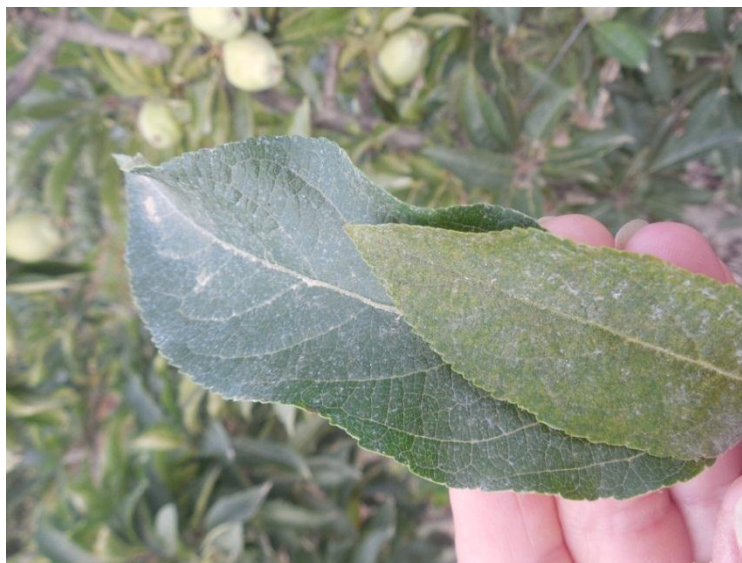
Slika 12. Simptomi crvenog voćnog pauka na listu – usporedba zdravog i oštećenog lista

zbog nedostatka hrane. Ličinke odmah odlaze na naličje lista gdje sišu sokove. Na napadnutom lišću se vide žute točkice (Slika 12.) koje postupno poprimaju ljubičasto - crvenu boju. Točkice su smještene uz žile i s vremenom se spajaju te lišće postaje smeđe, suši se i zatim otpada (Brmež i sur., 2010.). Najjači napad je za vrijeme zadnjih generacija. Posljedica napada crvenog voćnog pauka također je i slabiji razvoj pupova te nepravilan razvoj plodova što može uzrokovati štetu i iduće sezone. Ličinke prolaze kroz tri stadija tijekom razvoja, nakon kojih slijedi po jedan stadij nimfe koja miruje. Svaki od šest stadija traje jedan do dva dana što znači da ličinka završava svoj razvoj za 7 do 10 dana. Nakon jednog do četiri dana ženka počinje odlagati ljetna jaja na naličju lišća i taj stadij jajeta traje 5 do 11 dana. Razvoj zimskog jajeta traje 170 do 230 dana, te jaja moraju biti izvrgnuta niskim temperaturama kako bi iz njih mogle izaći ličinke. Generacije se isprepliću tako da istovremeno mogu naći odrasle jedinke, nimfe, ličinke i ljetna jaja. Dužina životnog ciklusa ovisi o temperaturi i vlažnosti, a optimalna temperatura za rast i razvoj je od 23 do 25°C i relativna vlažnost zraka 50 - 70%.