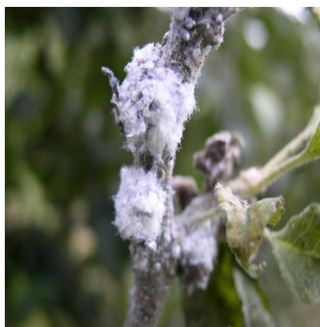
Slika 3. Jabučna krvava uš prekrivena bijelom voštanom prevlakom

Jabučna krvava uš se hrani na stablu, korijenju, razvijenim granama i mladim izbojima na način da siše biljni sok i pri tome stablo slabi. Ova uš proizvodi mednu rosu na koju se naseljavaju gljive čađavice uglavnom na plodovima i lišću. Posljedica napada je pucanje kore, sušenje grana i stvaranje rak-rana na mjestima gdje štetnik siše (Slika 4.).