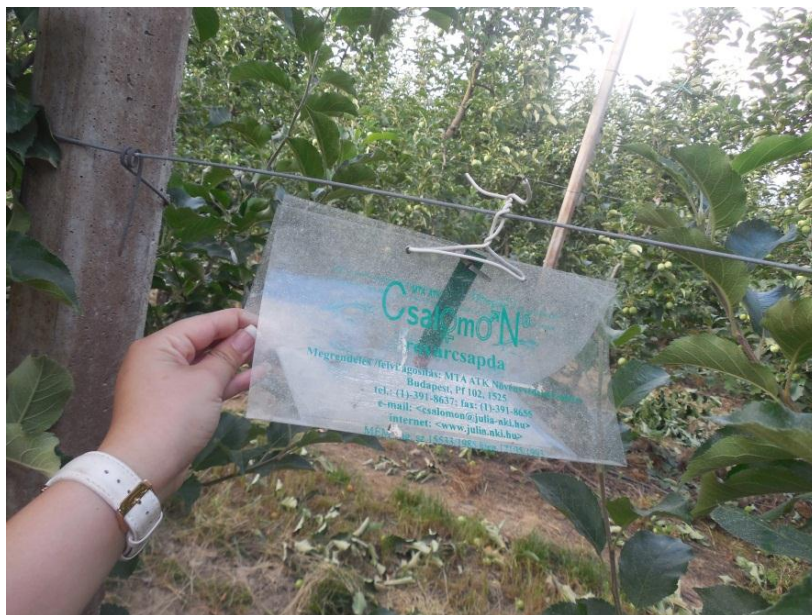
Slika 8. Feromonski mamac za praćenje pojave lisnog minera

pregledaju se biljke kako bi se utvrdila prisutnost i brojnost jaja. Pragom odluke nakon cvatnje smatra se 100 jaja na 100 listova. Ako se prije cvatnje metodom 100 udaraca nađe više od 80 leptira, potrebno je primijeniti insekticide u vrijeme ovipozicije ili najkasnije do pojave prvih gusjenica, što i je optimalni rok za primjenu biotehničkih insekticida. Najučinkovitije suzbijanje se postiže suzbijanjem prve generacije, kada su razvojni stadiji međusobno odvojeni. Za suzbijanje se mogu rabiti regulatori razvoja kukaca ili neonikotinoidi.