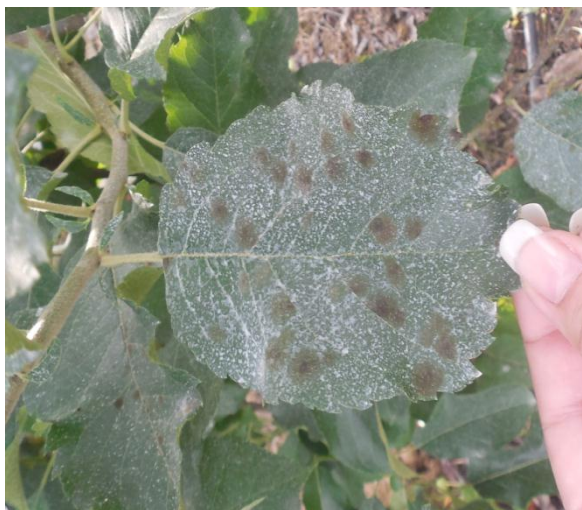
Slika 13. Mrljavost lista

obliku pjege koje mogu biti pojedinačne, razasute po plodu ili zahvaćaju veći dio ploda čineći veće oštećenje. Pjege su u početku maslinasto zelena, ali se kasnije boja mijenja. Unutarnji dio stare pjege je svjetlo - smeđi s tamnijim rubom. Ako do zaraze dođe u doba intenzivnog porasta, može doći do plićih ili dubljih pukotina u kori i mesu, a pokožica ne može slijediti taj rast jer je odumrla te takvi plodovi nemaju karakterističan oblik i deformirani su i to je tipičan simptom krastavosti ploda (Slika 14.). Plodovi koji su zaraženi u ranoj fazi mogu otpasti, no ako ostanu na stablu tada se na mjestima gdje su raspucali naseljavaju saprofiti ili paraziti rana ( Monilinia , Botrytis i dr.), te ti plodovi trunu. Ispod mrlja na plodu se formira plutasti sloj, te taj zaraženi dio nema normalnu transpiraciju. Pjege na peteljka ploda i lista su iste ili slične.