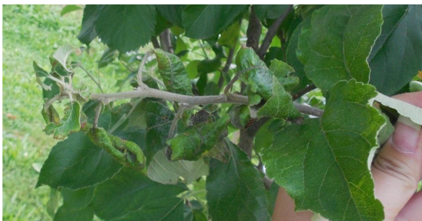
Slika 2. Simptomi napada jabučne zelene uši na izboju jabuke

Pragom odluke za suzbijanje se smatra 10 - 15 kolonija na 100 organa, ili 20 - 25 uši uhvaćenih metodom 100 udaraca.