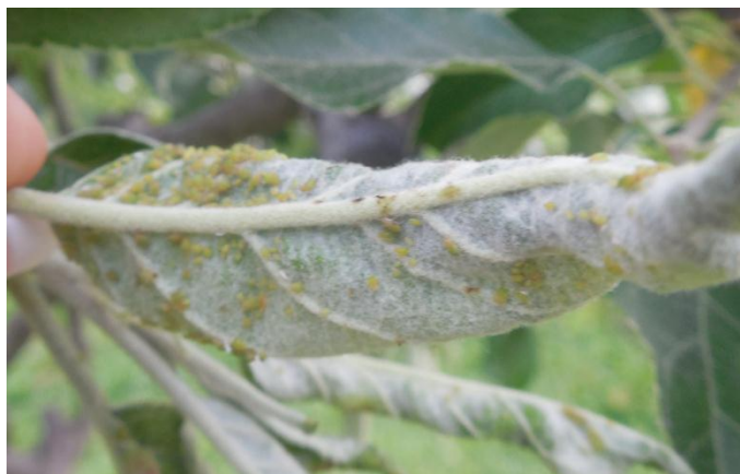
Slika 1. Jabučna zelena uš na naličju lista

Jabučna zelena uš je proširena po cijeloj Europi, a često se pojavljuje i kod nas. Osim jabuke ona napada i krušku. Ubraja se u monoecijske vrste. Tijelo joj je dugo 1,5 - 2 mm i žuto - zelene boje (Slika 1.), ovalnog do kruškolikog oblika (Maceljki i Igrc Barčić, 1999).