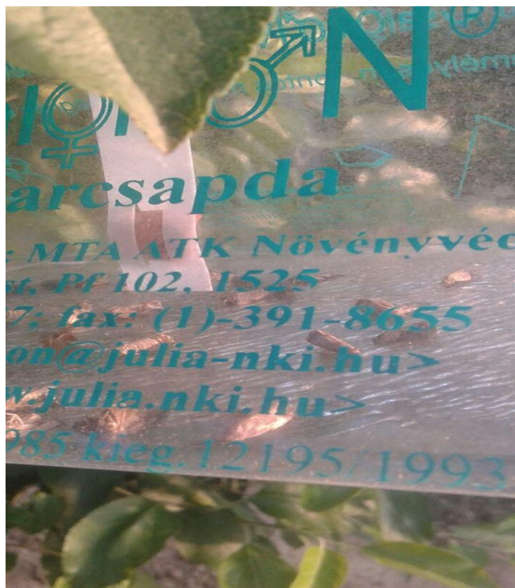
Slika 10. Ulov jabučnog savijača na feromonskom mamcu

Uporaba insekticida ne treba biti više od 4 puta tijekom vegetacije. Tretiranje se obavlja na osnovu ulova štetnika na feromonskim mamcima, analize sume efektivnih temperatura, analize srednjih temperatura u poslijepodnevni satima i na osnovu broja oštećenih plodova. Prskanje se treba obaviti pri visokoj vlazi zraka i temperaturama nižim od 20 °C (ujutro i navečer). Ovisno o rodnosti voćnjaka prag odluke je 3 – 5 leptira po feromonskom mamcu (Slika 10.). Od bioloških insekticida koriste se oni na bazi Bacillus Thuringiensis Berliner.