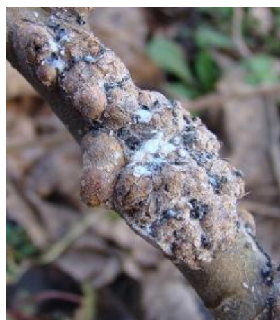
Slika 4. Oštećenja od krvave uši na grani jabuke