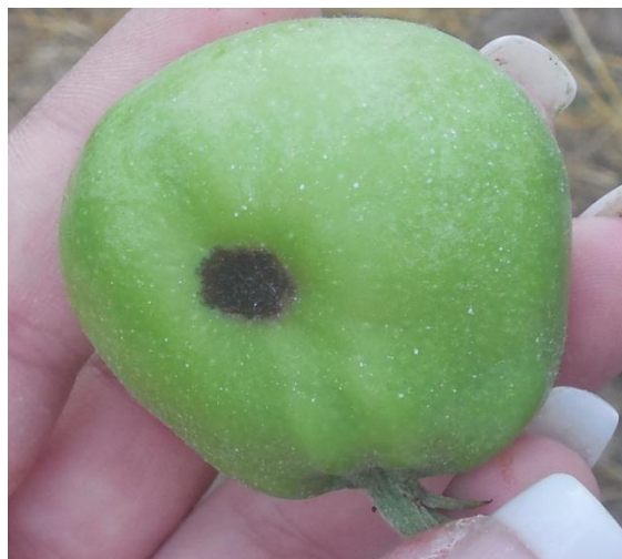
Slika 14. Krastavost i deformacija ploda

Ova gljiva ima dvije faze razvoja, saprofitsku i parazitsku. Saprofitska faza - tijekom zime postupno dolazi do formiranja pseudotecija s askusima i askosporama, a u proljeće dolazi do pojave prvih pseudotecija koji imaju izgled malih crnih kuglica, položenih u oštećenom tkivu lista. Pseudoteciji se počinju formirati 30 dana poslije opadanja lišća, a optimalna temperatura za klijanje askospora je 16 - 20°C (Kišpatić, 1980). Svaki pseudoperitecij sadržava 100 - 150 askusa, s 8 askospora. Od 1992-1995 je vršeno istraživanje i ustanovljeno je da su pseudoperiteciji s askosporama u Sjeverozapadnoj Hrvatskoj zreli oko 20. ožujka, te se samim time prve infekcije mogu