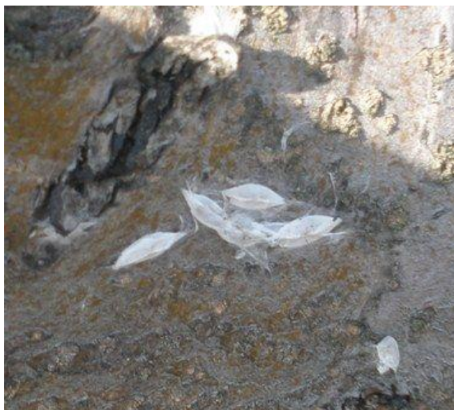
Slika 6. Kukuljice moljca kružnih mina