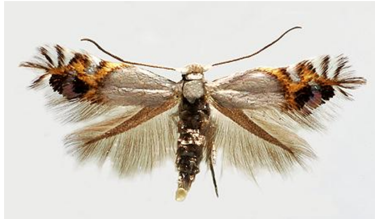
Slika 5. Imago moljca kružnih mina

svjetlo - siva s dugačkim resama (Slika 5.). Jaja su mliječno – bijela, a ličinke žućkaste, bijele ili prozirne, duga 5 mm.