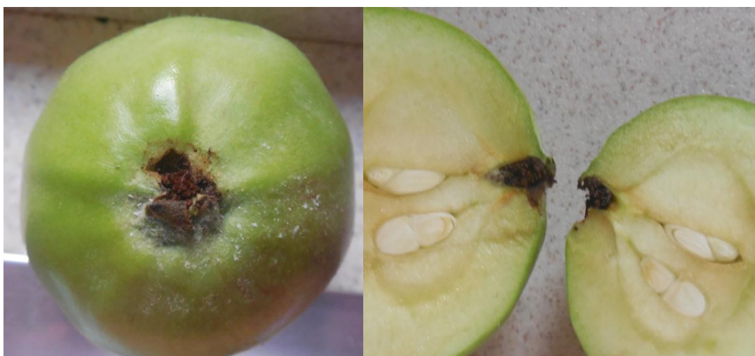
Slika 9. Štete od jabučnog savijača na plodu jabuke

Jabučni savijač ima 2 generacije godišnje. Prezimi kao odrasla gusjenica u kokonu ispod kore ili u raznim pukotinama na deblu i u debljim granama. U travnju se kukulji na mjestima prezimljenja. Let leptira počinje krajem travnja i traje sve do kraja lipnja. Mužjaci se javljaju prije ženki. Leptiri lete u sumrak, a kopulacija počinje pri temperaturi višoj od 15 °C. Jaja odlažu na lišće, plodove i grančice. Inkubacija traje 7 - 14 dana, a kad izađu iz jaja, gusjenice se ubušuju u plodove, obično kod časkе ili na mjestu gdje se dodiruje plod s listom ili dva ploda međusobno te uzrokuje „crvljivost“ plodova (Slika 9.). Prije nego krene prema sjemenim zamecima, gusjenica napravi spiralan hodnik. Napadnuti plodovi otpadaju. Razvoj gusjenice traje oko 20 dana i zatim odrasla gusjenica napušta plod, te odlazi u pukotine na deblu i granama, gdje se zapreda i kukulji. Nakon desetak dana javlja se leptir koji započinje svoj let. Let traje od polovine srpnja do polovine kolovoza. Odlaze jaja na plodove u koje se gusjenice ubušuju. Na početku samo površinski oštećuje plod, a zatim se ubušuju dublje do jezgre, te kroz otvor izbacuje izmet van. U vrijeme zriobe, gusjenice izlaze iz plodova i zatim odlaze na mjesta gdje prezimljavaju. Dio gusjenica ostane za vrijeme berbe u plodovima te je zajedno s plodovima prenesu u skladište, gdje pronalaze skrovnita mjesta za prezimljavanje.