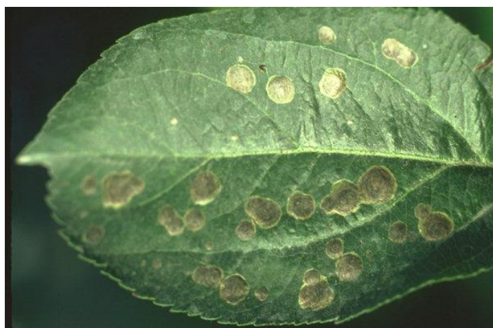
Slika 7. Simptomi oštećenja moljca kružnih mina na listu