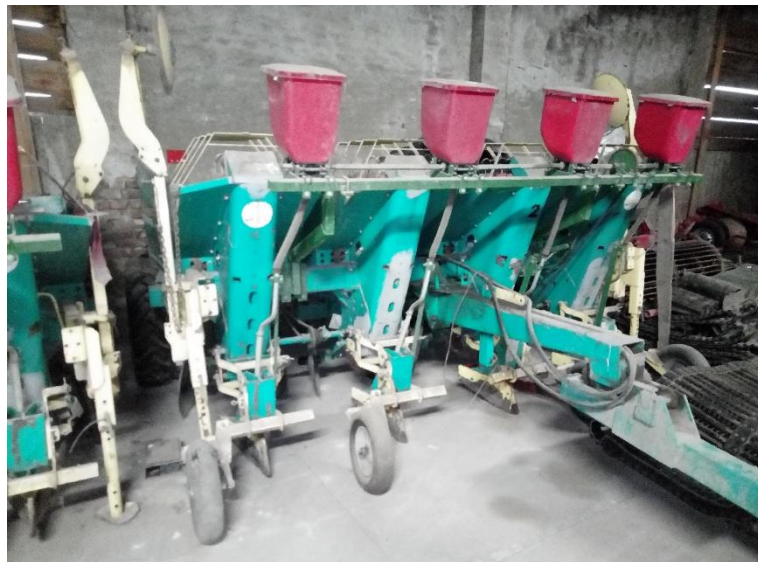
Slika 12. Sadilica za krumpir „Cramer“ 4 reda

Tijekom dnevnog tehničkog održavanja provodi se ispravnost gibljivih cijevi za vakuum, provjera zategnutosti lanaca i lančanika, te njihovo brisanje suhom krpom i podmazivanje. Nakon završetka rada obavezno se vadi sjeme iz sjetvenih kutija, te parkira sijačicu zajedno s traktorom u poluzatvoreni ili zatvoreni prostor. Komprimiranim zrakom se ispuhuju kutije za sjeme i sjetvene ploče. Nakon čišćenja slijedi vizualan pregled ulagača, zagrača sjemena, pneumatika i markera. Održavanje sijačica je sukladno nuputcima za rukovanje i održavanje propisano od strane proizvođača.