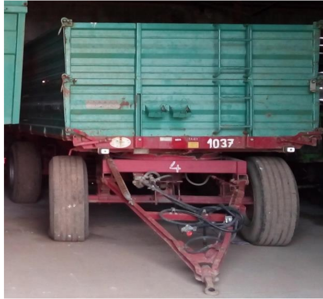
Slika 28. „Tehnostroj DP 1100“

Održavanje prikolica je vrlo bitno, jer prikolice često sudjeluju u javnom prometu. Neispravnom prikolicom izlažemo opasnosti rukovateljev život i živote ostalih sudionika u prometu. Ukoliko se uoče nedostaci kod signalizacije ili kočnica, prikolica se odmah parkira u radionicu dok se nedostaci ne otklone. Vrlo bitno je držati se uputa da se tijekom eksploatacije prikolica ne preopterećuje i ne vozi brzo po neravnom terenu.