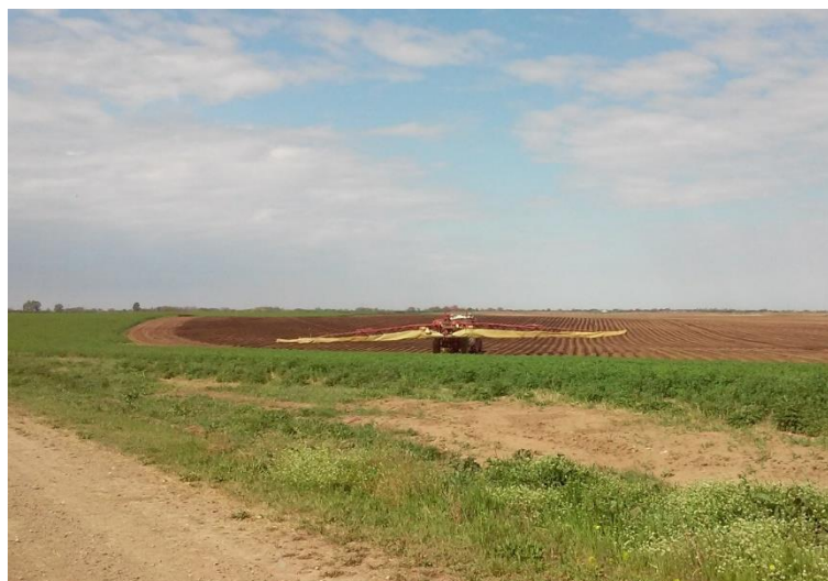
Slika 17. Zaštita mrkve „Hardi Commander 3300“

Sve mjere održavanja koje se provode na prskalicama u skladu su sa naputkom za rukovanje i održavanje koje preporučuje proizvođač.