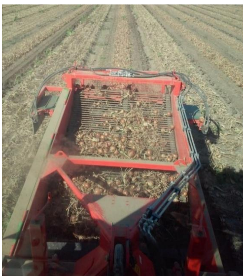
Slika 20. Vadicica „Holares UR135“

Vadicica za luk „Holares UR135“ (slika 20.) se priključuje na stražnji dio traktora u tri točke. Pogon od priključnog vratila traktora prenosi se preko kardanskog vratila, koje pogoni reduktor vadicice. Pogon se od reduktora preko lančanog prijenosa prenosi na osovinu za vađenje luka, gumeni valjak za sakupljanje luka i lančastu traku. Broj okretaja priključnog vratila se postavlja 540 o/min. Masa vadicice je 1100 kg, a širina radnog zahvata je 125 cm.