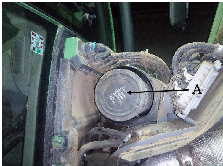
Slika 10. Traktor „Fendt 412 Vario“ A- zračni pročistač

U svakom traktoru se nalazi dnevnik rada stroja koji ispunjava rukovatelj stroja. Prije svakog korištenja tako i nakon završetka posla rukovatelj je obavezan pregledati ispravnost stroja i sve uočene neispravnosti unijeti u dnevnik rada stroja. U dnevnik rada stroja se upisuje datum, smjena, broja traktora, broj priključnog stroja, nadolivena količina goriva, nadolivena količina ulja, zatečeni kvarovi, nastali kvarovi tijekom smjene itd. Na temelju uvida u dnevnik rada stroja, rukovatelj koji dolazi u novu smjenu, može utvrditi u kakvom je stanju traktor ili priključni stroj prije početka rada. Nastali manji kvarovi tijekom radne smjene koji ne uzrokuju zastoje stroja otklanjaju se pri dnevnom tehničkom održavanju.