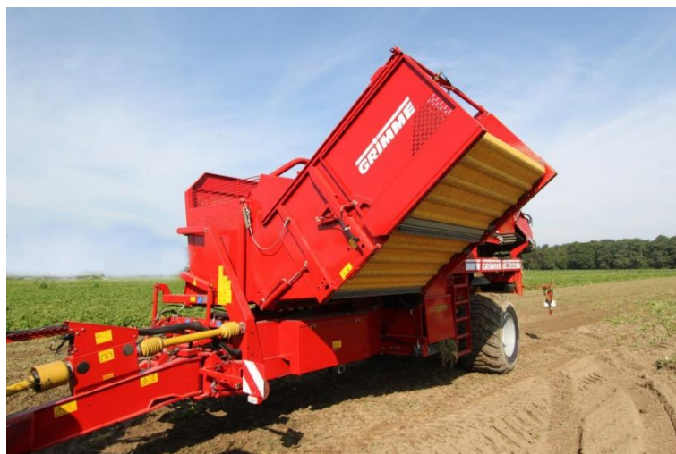
Slika 26. Kombajn za povrće „Grime SE 150-60“

Svakodnevno prije početka rada s kombajnom rukovatelj provodi mjere dnevnog održavanja u što spada: vizualna provjera stanja kombajna, provjera razine ulja u reduktoru, provjera zategnutosti remenja i lanaca, te zategnutost trake. Rukovatelj podmazuje sva mjesta koja su predviđena za podmazivanje.