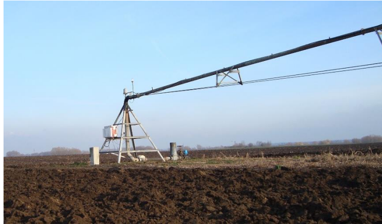
Slika 31. Centralni toranj kružno-pomične rampe („Pivot“)

Početak sezone provjerava se tlak zraka u pneumaticima i zategnutost vijčanih spojeva. Nekoliko dana prije početka natapanja postavljaju se rasprskivači i manometri.