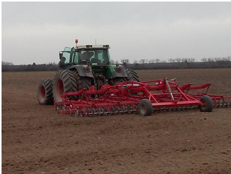
Slika 16. Sjetvospremač „Kongskilde Germinator Sp 7000“

„Kongskilde Germinator“ (slika 16.), je vučeni stroj za brzu pripremu tla prije sjetve u jednom proходу. Radna dubina mu je do 8 cm. Ukupna masa stroja je 2500 kg.