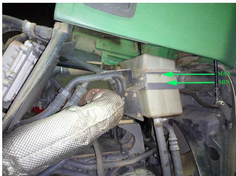
Slika 7. „Fendt 412 Vario“ Provjera rashladne tekućine

Dnevno tehničko održavanje obavlja rukovatelj stroja. Svakodnevno prije početka rada provode se slijedeće mjere održavanja: provjera rashladne tekućine (slika 7.), provjera ulja u mjenjaču (slika 8.), provjera ulja u hidraulici (slika 9.), provjera ulja u motoru, provjera signalizacije te punjenje traktora gorivom. U sezoni, kod obavljanja poslova kod kojih se pojavljuje velika količina prašine, pročistač zraka (slika 10.) i pročistač zraka kabine se svakodnevno (u prvoj smjeni) skidaju i čiste (ispuhaju) komprimiranim zrakom u radionici. Pri čišćenju, tlak zraka ne smije prijeći vrijednost od 5,0 bara, čime se sprječava nastanak mehaničkog oštećenja pročistača. Sve ostale radnje obavljaju se prema naputku za rukovanje i održavanje pojedinog traktora.