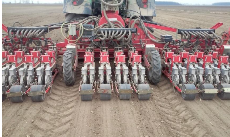
Slika 11. Sjetvi luka „Agricola SNT 3“