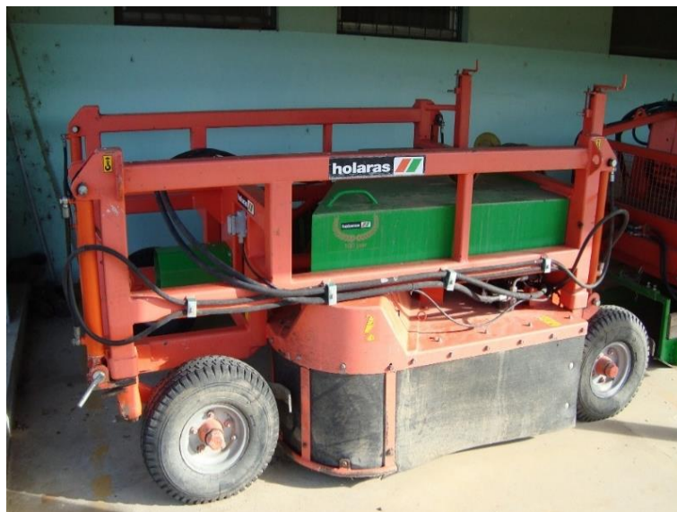
Slika 18. Sitnilica „Holares UM150“

Sitnilica ima ugrađenu automatsku regulaciju visine reza. Upravljanje hidrauličnim klipovima za automatsku visinu reza obavlja se pomoću elektorhidraulike koja je povezana s traktorom. Visina reza noževa podešava se ručno, a elektrohidraulika održava zadanu visinu. Radni zahvat stroja je 150 cm.