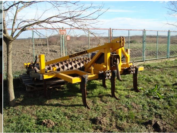
Slika 33. Garažiranje podrivača na otvorenom prostoru