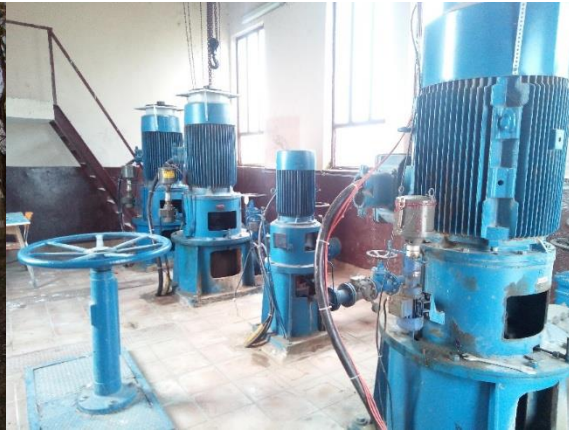
Slika 30. Unutarnji izgled crpne stanice

Radni cjevovodi su izrađeni od betona, postavljeni ispod zemlje i obavljaju raspodjelu vode do „Pivot“ sustava ili drugih uređaja za natapanje, koji se po potrebi mogu naknadno postaviti („tifoni“, „kišna krila“, „sustav kap po kap“). Na cjevovodima su predviđeni: priključci za pomične-rampe, hidranti, ispusti za vodu, ventili za ozračivanje i zatvarači.