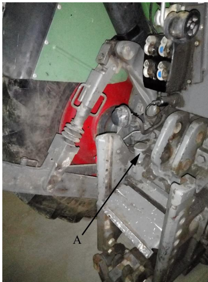
Slika 8. „Fendt 412 Vario“ A - Mjerač ulja u mjenjaču