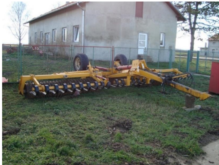
Slika 23. Valjak „Twose HF“

Vučeni valjak „Twose HF“ (slika 23.) se koristi za razbijanje krupnih komada zbijenog tla i pokorice, te uspostavljanje kontakta između posijanog sjemena i tla.