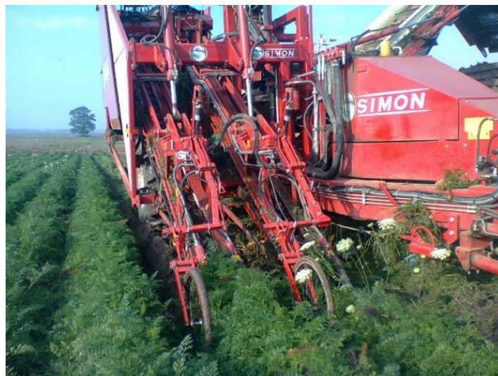
Slika 25. „Simone R2FCMR“ kombajn za mrkvu

Tvrtka posjeduje dva kombajna za povrće „Simon R2FCMR“ (slika 25.) i „Grimme SE150-60“ (slika 26.).