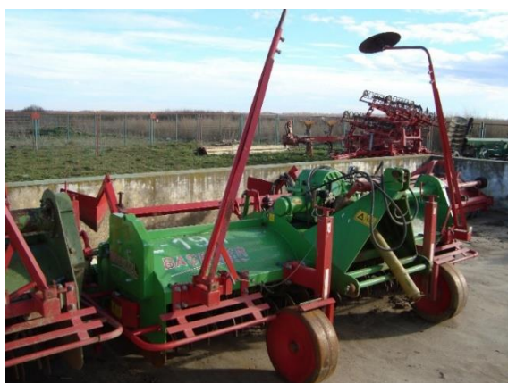
Slika 13. Stroj za izradu gredica „Baselier“

Gredice formiraju 4 valjka (slika 14.), pogonjena hidraulikom traktora, a dubina se regulira s pomoćnim kotačima. Radni zahvat stroja iznosi 300 cm, a razmak između gredica je 75 cm. Brzina gibanja stroja ovisi o stupnju pripreme i vlažnosti tla, te iznosi od 0,6 km/h do 1,2 km/h.