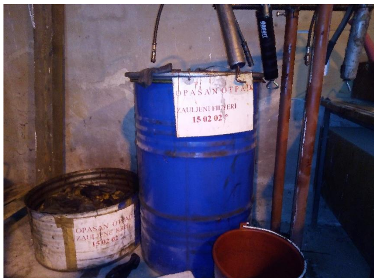
Slika 37. Bačve za odlaganje zaujelih krpa i bačva za odlaganje pročistača