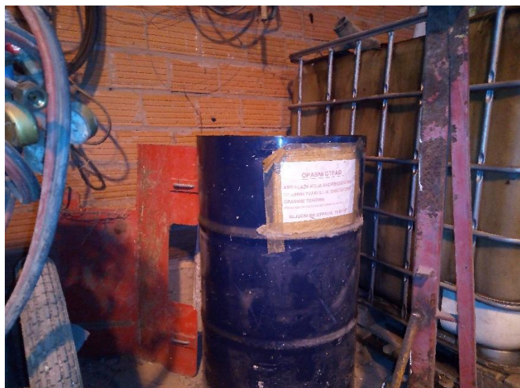
Slika 38. Bačva za odlaganje plastične ambalaže od ulja