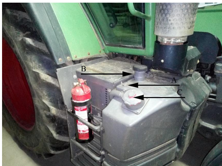
Slika 9. Traktor „Fendt 412 Vario“ A- Mjerač ulja u hidraulici, B- Pročistač ulja, C- Otvor za nadolijevanje ulja u hidrauliku