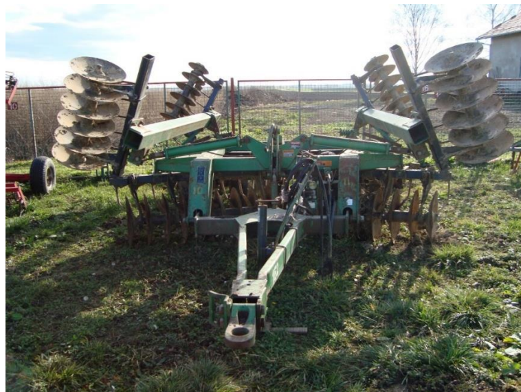
Slika 21. Tanjurača „JD 630“

Teška vučena tanjurača „JD 630“ (slika 21.) se koristi za srednje duboku obradu izoranog tla, usitnjavanje biljnih ostataka, te ravnanje površina i puteva oko „Pivot“ sustava za natapanje.