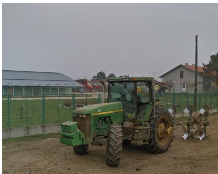
Slika 6. „John Deere 8100“

Traktor „John Deere 8100“ (slika 6.), snage motora 121 kW pripada skupini teških traktora. Traktor ima šesterocilindrični redni dizel motor radnog obujma 8100 cm 3 , koji je opremljen je turbopunjačem i hladnjakom stlačenog zraka. Traktor posjeduje sinkronizirani „PowerShift“ mjenjač s 16 brzina naprijed i 4 za hod unazad. Masa traktora je 11100 kg . Ovaj traktor se koristi uglavnom za osnovnu obradu tla i pripremu tla, te vuču i izvlačenje kamiona iz polja u nepovoljnim uvjetima.