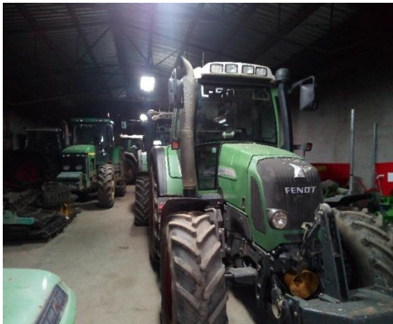
Slika 34. Garažiranje traktora u zatvorenom prostoru