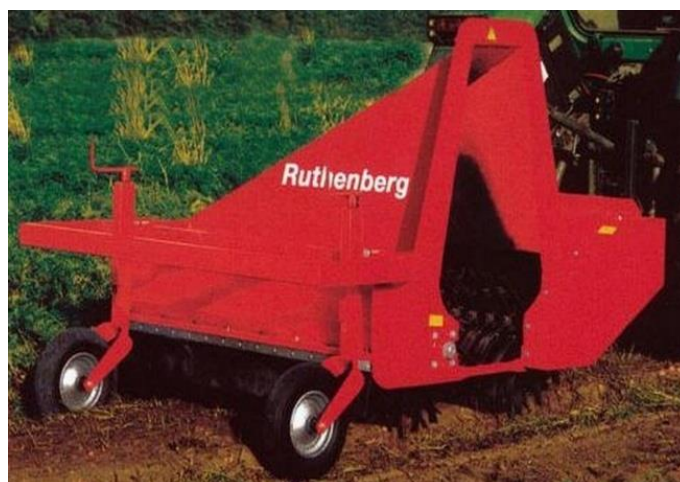
Slika 19. Sitnilica „Ruthenberg“

Sitnilica „Ruthenberg“ (slika 19.) je nošeni stroj koji se upotrebljava za košnju stabljike mrkve, ali i nekih drugih kultura (celer, luk, cikla). Sitnilica ima gumene noževe umjesto uobičajenih metalnih. Može se prikopčat na prednji ili stražnji dio traktora u tri točke. Radni zahvat stroja je 160 cm, a potrebna snaga traktora za pogon je 55 kW.