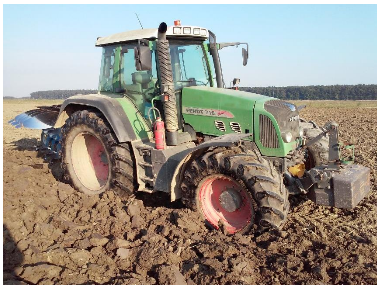
Slika 5. „Fendt 716 Vario“

Traktor „John Deere 8100“ (slika 6.), snage motora 121 kW pripada skupini teških traktora. Traktor ima šesterocilindrični redni dizel motor radnog obujma 8100 cm 3 , koji je opremljen je turbopunjačem i hladnjakom stlačenog zraka. Traktor posjeduje sinkronizirani „PowerShift“ mjenjač s 16 brzina naprijed i 4 za hod unazad. Masa traktora je 11100 kg . Ovaj traktor se koristi uglavnom za osnovnu obradu tla i pripremu tla, te vuču i izvlačenje kamiona iz polja u nepovoljnim uvjetima.