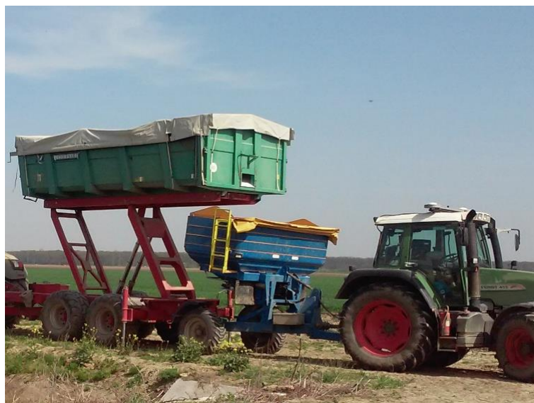
Slika 15. „Bogballe M3W“ centrifugalni rasipač

Za raspodjelu mineralnog gnojiva koristi se „BogBalle M3W“ (slika 15.), centrifugalni rasipač opremljen navigacijom. Sustavom za vaganje mjeri se masa gnojiva, te se opažaju promjene u protoku gnojiva i namještaju zatvarači tijekom vožnje. Na taj način se postiže optimalna točnost i preciznost količine gnojiva. Kapacitet spremnika iznosi 4000 dm 3 (4000 litara).