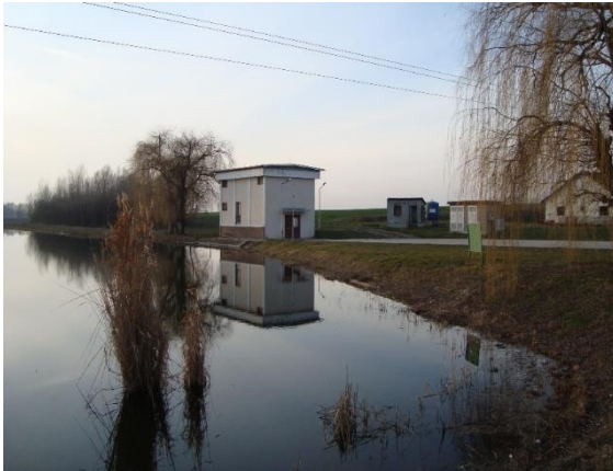
Slika 29. Crpna stanica „Grabovo“

Rukovatelj cjelokupnim sustavom za natapanje (crpke, „Pivoti“) upravlja pomoću računala (stolnog ili prijenosnog), a u slučaju kvara upravljati se može ručno. Rukovatelj pri pokretanju sustava, uz pomoć računala (koje se nalazi u upravnoj zgradi), uključuje crpku, određuje tlak i protok vode u cjelokupnom sustavu, te zasebno za svaki „Pivot“ odredi potrebnu količinu vode (u mm) i radni tlak na stožeru, te pokrene sustav.