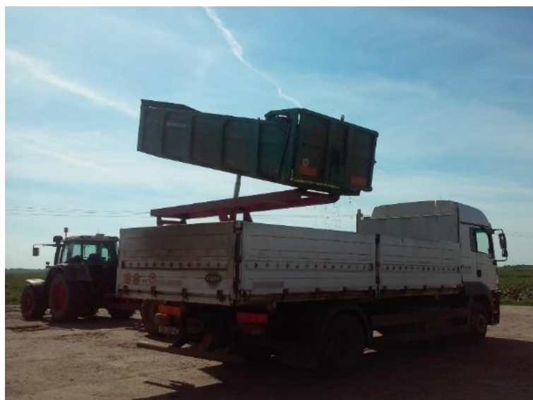
Slika 27. Univerzalna pretovarna prikolica „Tehnostroj Uniraiser“

agregata zbog sigurnosti i upravljanja ne bi trebala iznositi manje od 118 kW. Najveća dopuštena brzina gibanja prikolice je 40 km/h, a najveća nosivost prikolice je 12 000 kg.