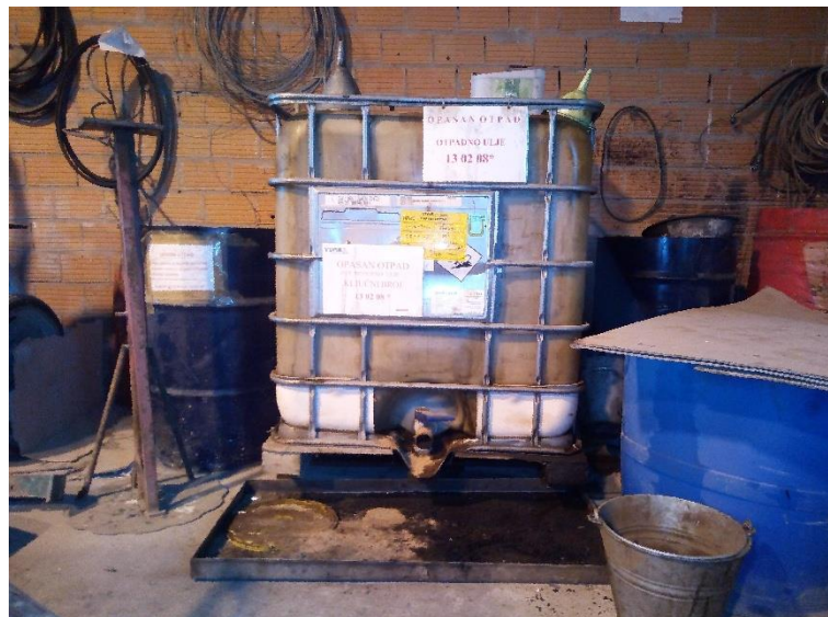
Slika 36. Spremnik za odlaganje ulja

Kako zauljene krpe, pročištače za ulje, te plastičnu ambalažu nije dozvoljeno spaljivati, bacati niti miješati s ostalim otpadom u PJ „Povrtlarstvo“ iste odlažu u posebne spremnike (slika 37. i slika 38.).