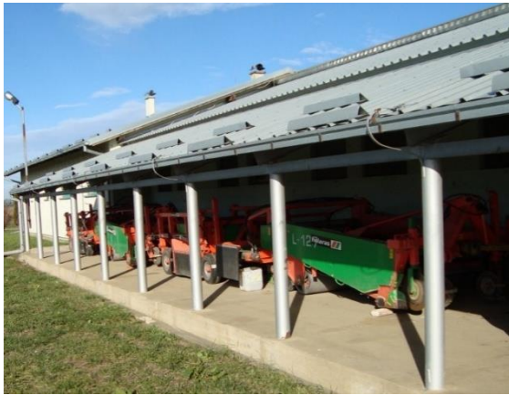
Slika 32. Garažiranje strojeva u poluzatvorenom prostoru