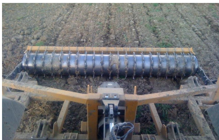
Slika 22. „McConnel Vibroaerator“ u radu

„McConnel Vibro Aerator“ (slika 22.), je vibracijski podrivač. Upotrebljava se za rahljenje tla ispod dubine tradicionalnog korištenja pluga, te prozračivanje tla. Oruđe se priključuje na traktor u tri točke. Na okviru se nalazi 6 radnih tijela i metalni „Paker“ valjak koji dodatno poravnava i usitnjava uzdignute komade tla.