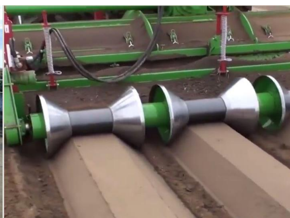
Slika 14. Izrada gredica za mrkvu „Baselier“

Svakodnevno prije početka rada obavlja se pregled kardanskog vratila te podmazivanje zglobova i unutarnjih površina vratila. Razina ulja u reduktoru se pregledava i po potrebi se ulje nadolijeva. Vrlo često, zbog velikih vibracija, dolazi do popuštanja vijčanih spojeva te se isti svakodnevno provjeravaju. Kod ovog stroja potrebno je voditi brigu o ispravnosti noževa. Česta su njihova oštećenja uslijed udaraca u kamenje ili zaostale metalne dijelove. Oštećene noževe potrebno je dovesti u ispravno stanje ili zamijeniti novima. Nakon završene sezone, oruđe se pere, pregledava te pravi zapis o eventualnim neispravnostima. Održavanje se obavlja sukladno napatku za rukovanje i održavanje.