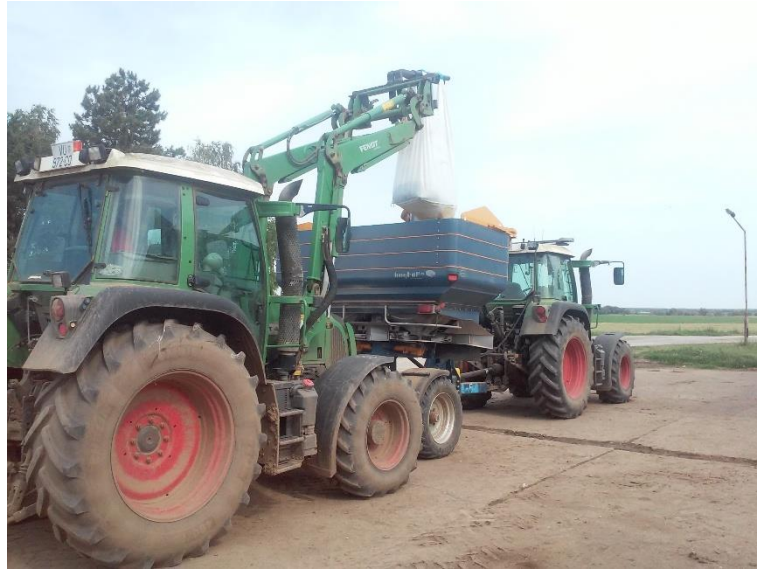
Slika 4. „Fendt 412 Vario“ opremljen utovarivačem i „Fendt 412 Vario“ opremljen navigacijom

Traktor „Fendt 716 Vario“ (slika 5.), mase 6290 kg, snage motora 121,8 kW pripada teškoj skupini traktora. Pogonski motor na traktoru je šesterocilindrični redni motor, hlađen rashladnom tekućinom. Radni obujam motora iznosi 5700 cm 3 . Motor je opremljen turbopunjačem i hladnjakom stlačenog zraka. Mjenjač na ovom traktoru je također „Vario“ i ima dvije brzine s razmakom od 0,2 km/h. Najveća brzina gibanja traktora u prvom stupnju je 32 km/h, a drugom 50 km/h. 540 o/min priključnog vratila postiže se pri 1938 o/min motora, a u ekonomičnom radu brzinu vratila od 540E o/min postiže kod 1473 o/min motora. Broj okretaja vratila od 1000 o/min ostvaruje se pri 1938 o/min motora. U traktoru se također nalazi „TMS“ uređaj. Traktor se upotrebljava za pripremu tla, pogon stroja za izradu gredica, pogon kombajna, te sve ostale potrebne poslove.