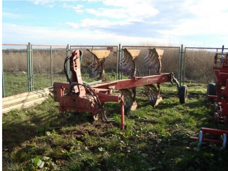
Slika 24. Plug „Kverneland“

Svi vijčani spojevi prije početka rada se provjeravaju, a potrebi zategnu ili ako su oštećeni zamijene novim. Tijekom rada potrebno je podmazivati plug prema napatku proizvođača. Redovite mjere održavanja pluga sukladne su mjerama proizvođača pluga i mjerama koje navode Emert i sur., (1995.).