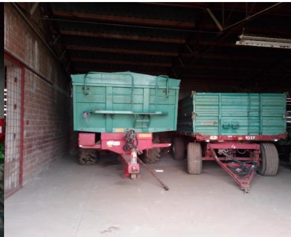
Slika 35. Garažiranje prikolica u zatvorenom prostoru