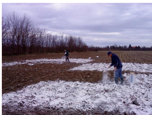
Slika 3. Rasipanje vapnenog materijala po tretmanima

U periodu od početka vlatanja do sredine vlatanja na pokusnim površinama su napravljene staze između svakog tretmana i svakog ponavljanja. Ovo se radi iz razloga što je u vrijeme uzimanja uzoraka biljnog materijala jednostavnije i brže snalaženje u prostoru (Slika 4).