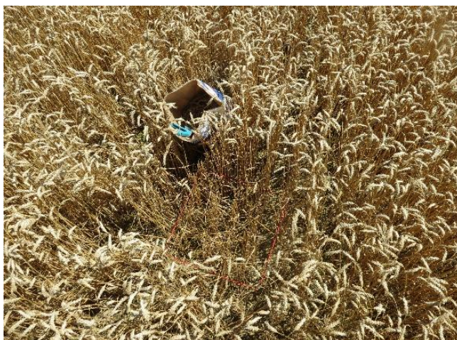
Slika 6. Uzimanje uzoraka biljnog materijala

Neposredno pred žetvu ručno su uzeti uzorci biljnog materijala s 1 m 2 (4 x 0,25 m 2 ) sa svake osnovne parcele uz pomoć kvadrata i vrtnih škara pri čemu je vrlo važno posvetiti pozornost označavanju svakog ponavljanja i tretmana (Slika 6). Uzorci su zatim korišteni za određivanje prinosa i komponenata prinosa (broj klasova po m 2 , masa 1000 zrna i hektolitarska masa).