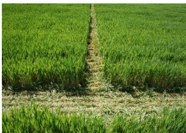
Slika 4. a i b. Izgled „staza“ u vlatanju

U periodu od početka vlatanja do sredine vlatanja na pokusnim površinama su napravljene staze između svakog tretmana i svakog ponavljanja. Ovo se radi iz razloga što je u vrijeme uzimanja uzoraka biljnog materijala jednostavnije i brže snalaženje u prostoru (Slika 4).