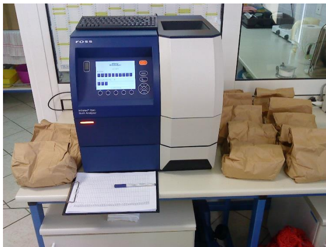
Slika 7. Infratec Grain Analizator, uređaj za određivanje kvalitete zrna pšenice

Iz ukupnog uzorka zrna s 1 m 2 određen je sadržaj proteina, škroba, vlažnog glutena, sedimentacija i hektolitarska masa. Ove analize su obavljene u laboratoriju Poljoprivrednog instituta Osijek pomoću Infratec 1241 Grain Analyser (Foss, Danska) uređaja koji radi na principu NIT tehnologije (Near Infrared Transmission) odnosno bliske infracrvene (570-1050 nm) transmisije (Slika 7).