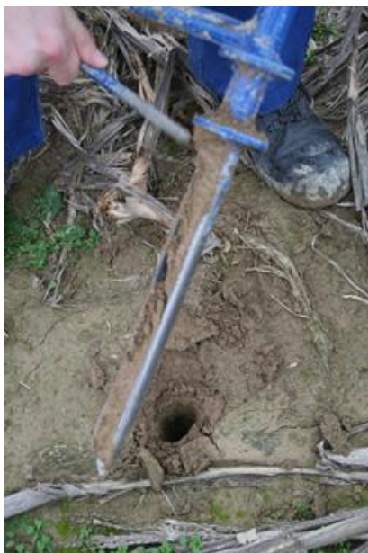
Slika 5. Uzimanje uzoraka tla pedološkom sondom

Uzorkovanje je obavljeno pedološkom sondom do dubine 30 cm (Slika 5) pri čemu je uzet jedan prosječni uzorak mase oko 1 kg koji se sastojao od 20 pojedinačnih uzoraka. Nakon dopremanja u laboratorij, uzorci tla su očišćeni od organskih ostataka i ostalih primjesa te osušeni u tankom sloju na sobnoj temperaturi. Zrakosuhi uzorci tla su zatim usitnjeni posebnim mlinom za tlo, prosijani kroz sito promjera 2 mm i homogenizirani, nakon čega su pripremljeni za analizu sukladno standardnom propisanom postupku (ISO 11464, 1994a).