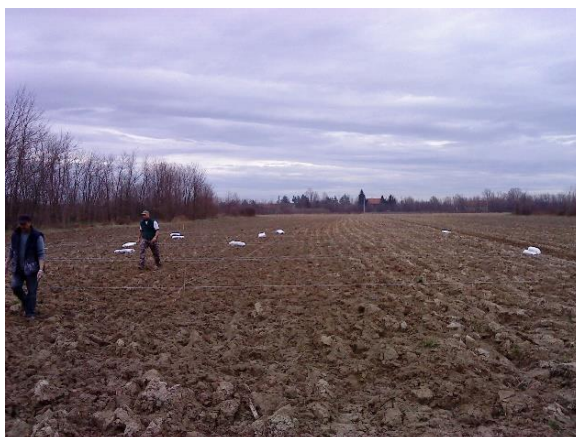
Slika 2. Razmjeravanje pokusa